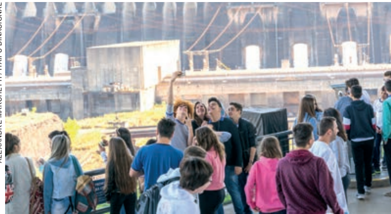
Recuperação de nascentes

Ainda no campo econômico-financeiro, a Itaipu promoveu a primeira redução tarifária desde