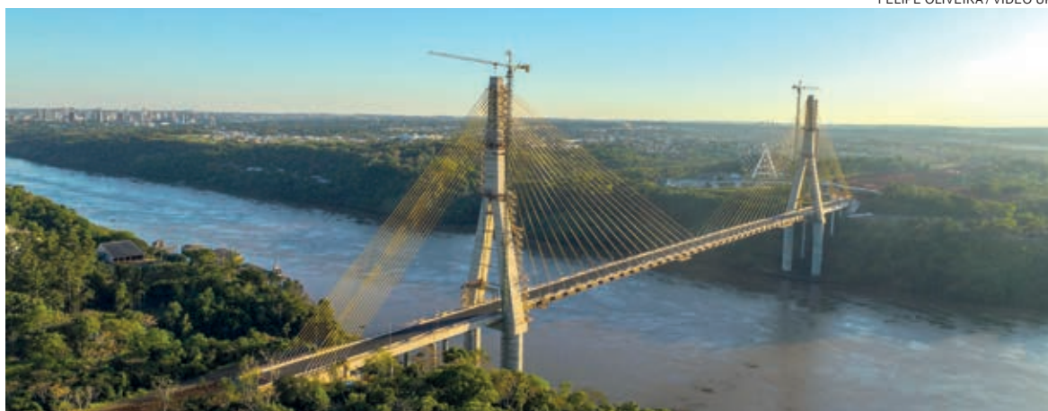
Ponte da Integração Brasil

A barragem da usina hidrelétrica também segue segura. A conclusão é do Board Internacional de Consultores Cíveis, que voltou a se reunir em 2022. O grupo, criado na época da construção de Itaipu, reúne alguns dos mais experientes profissionais do mundo no tema engenharia de grandes barragens. Após a conclusão do empreendimento, o Board passou a fazer encontros quadriênicos para analisar o desempenho das estruturas civis da hidrelétrica binacional.