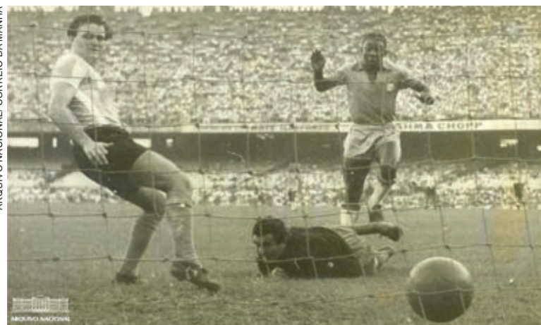
Pelé, Fotografia de um dos gols marcados pelo Brasil na vitória sobre a Argentina em jogo válido pela Copa Roca de 1957

A qualidade de Pelé era tamanha que a ideia de que ele era o rei do futebol surgiu antes mesmo da conquista de um título de expressão pela seleção. Jovem ainda, aos 17 anos, meses antes da disputa da Copa de 1958, o dramaturgo Nelson Rodrigues se referiu ao