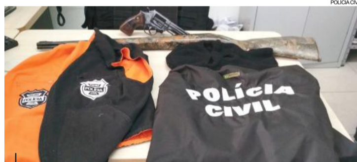
Coletes balísticos foram apreendidos em Cascavel