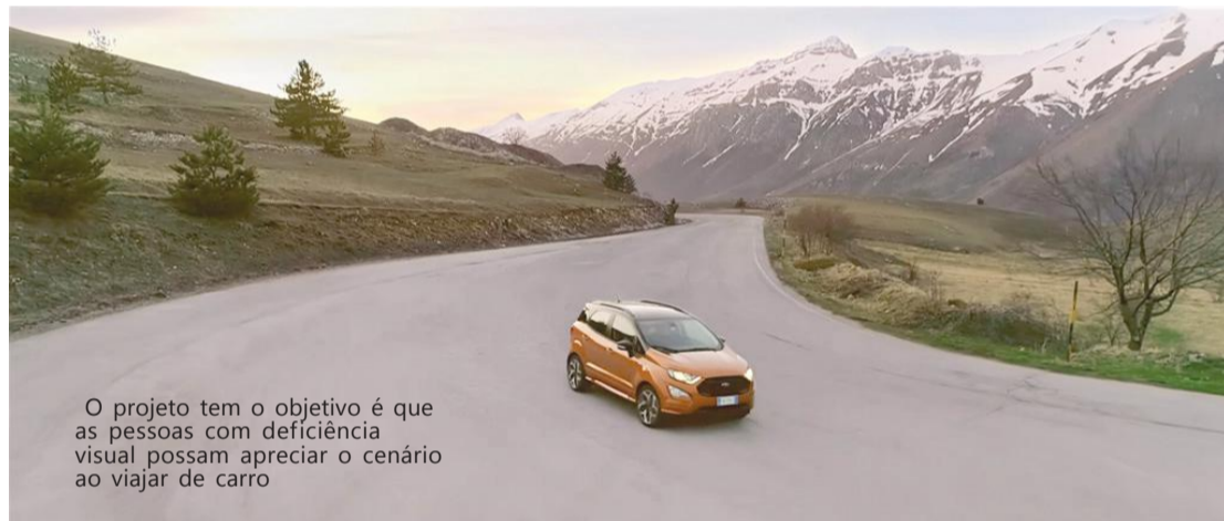
O projeto tem o objetivo é que as pessoas com deficiência visual possam apreciar o cenário ao viajar de carro

A marca ainda oferece as películas antivandalismo, que não permitem que o vidro estilhaçe, funcionando como uma semi-blindagem e auxilia na proteção do motorista em casos de tentativas de assalto sem arma de fogo.