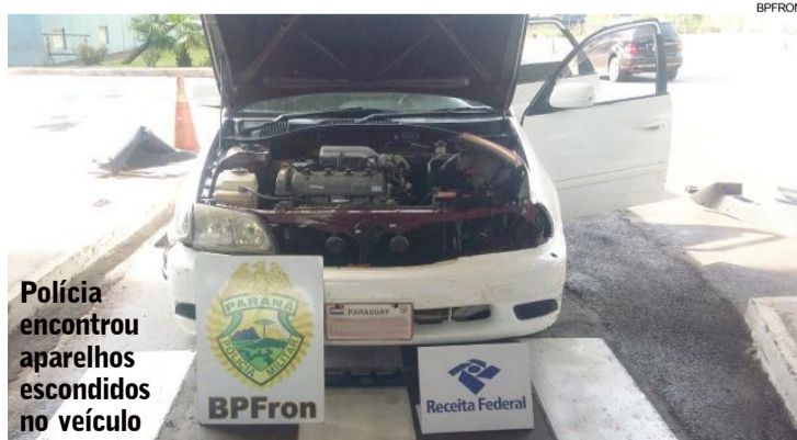
Polícia encontrou aparelhos escondidos no veículo

Um táxi paraguaio foi abordado pela polícia. Além do motorista, quatro passageiros estavam no veículo. Eles estavam com mercadorias dentro da cota de isenção permitida. Mesmo assim, os policiais decidiram fazer uma vistoria minuciosa no interior do veículo e retiraram a parte do tapete