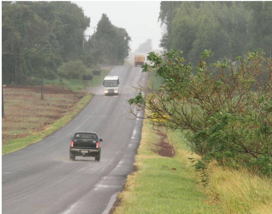
Segundo o DER, conservação da faixa de domínio garante mais segurança e resulta em mais cuidado com a pavimentação

(Programa Estadual de Recuperação e Pavimentação de Estradas). Serão contemplados os serviços de roçada de vegetação, remoção de lixo e resíduos, limpeza de valetas e bueiros, limpeza e pintura de meios-fios, pontes e pontos de ônibus e reparos das placas de sinalização.