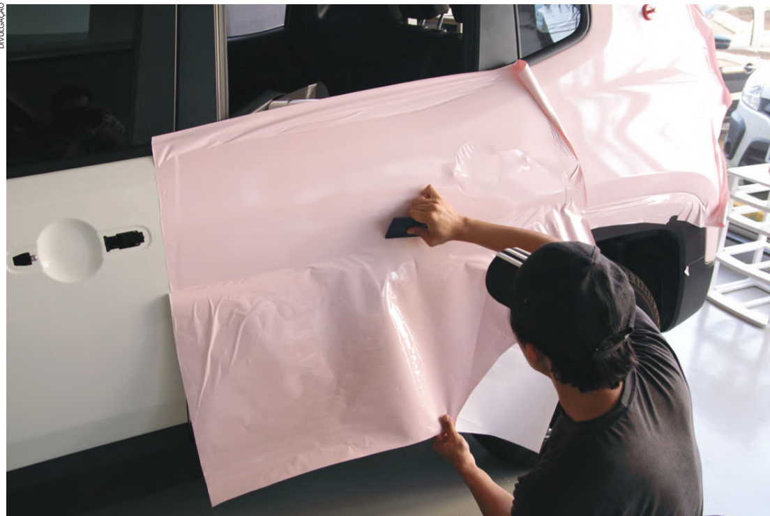
A colocação de uma película protege a pintura original do veículo, riscos de batidas de pedras ou manchas de combustível

A Multifilmes, rede de franquias de serviços automotivos, oferece uma película que protege a pintura original do veículo. "A película é transparente, não altera a cor do carro, mantém a aparência de novo por mais tempo. Além disso, protege de riscos de batidas de