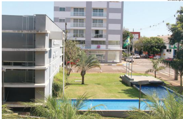
Prédio do Hospital Regional está pronto e fechado desde 2015

O sexto bloco ou partido, o PDT, não teve seu nome indicado nomeado pelo critério de proporcionalidade nas comissões, já que a CPI tem apenas