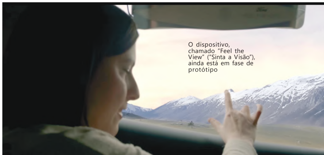
O dispositivo, chamado "Feel the View" ("Sinta a Visão"), ainda está em fase de protótipo