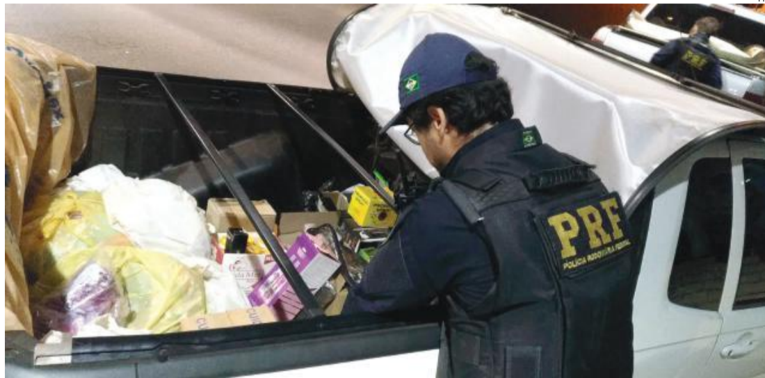
Medicamentos estavam em três veículos

Logo depois a polícia abordou uma camionet Amarok,