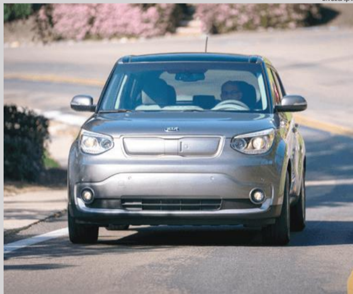
Os testes foram realizados em cinco Kia Soul, com eficiência de até 85%

Passo importante no futuro dos veículos elétricos, o Centro Técnico Hyundai-Kia America (HATCI) e a empresa de tecnologia Mojo Mobility (Mojo) completaram, após três anos, um projeto para desenvolver um sistema de transferência de energia sem fio de carregamento rápido em uma frota de teste de Kia Soul EV. O projeto, em colaboração com o Escritório de Eficiência Energética e Energia Renovável do Departamento de Energia dos Estados Unidos, abre caminho para o futuro dos veículos elétricos nos quais as tomadas não serão mais necessárias.