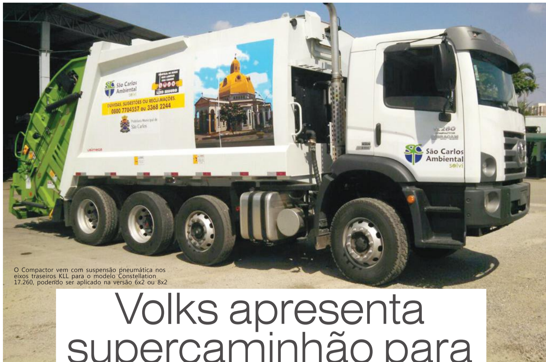
O Compactor vem com suspensão pneumática nos eixos traseiros KLL para o modelo Constellation 17.260, podendo ser aplicado na versão 6x2 ou 8x2