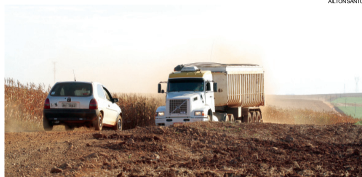
Apesar de normal para o período, secura desperta um alerta à saúde