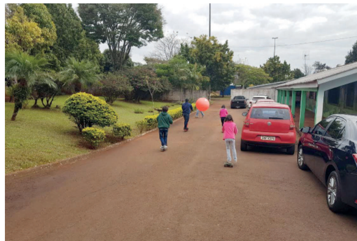
As crianças não esconderam a alegria em ganhar os brinquedos