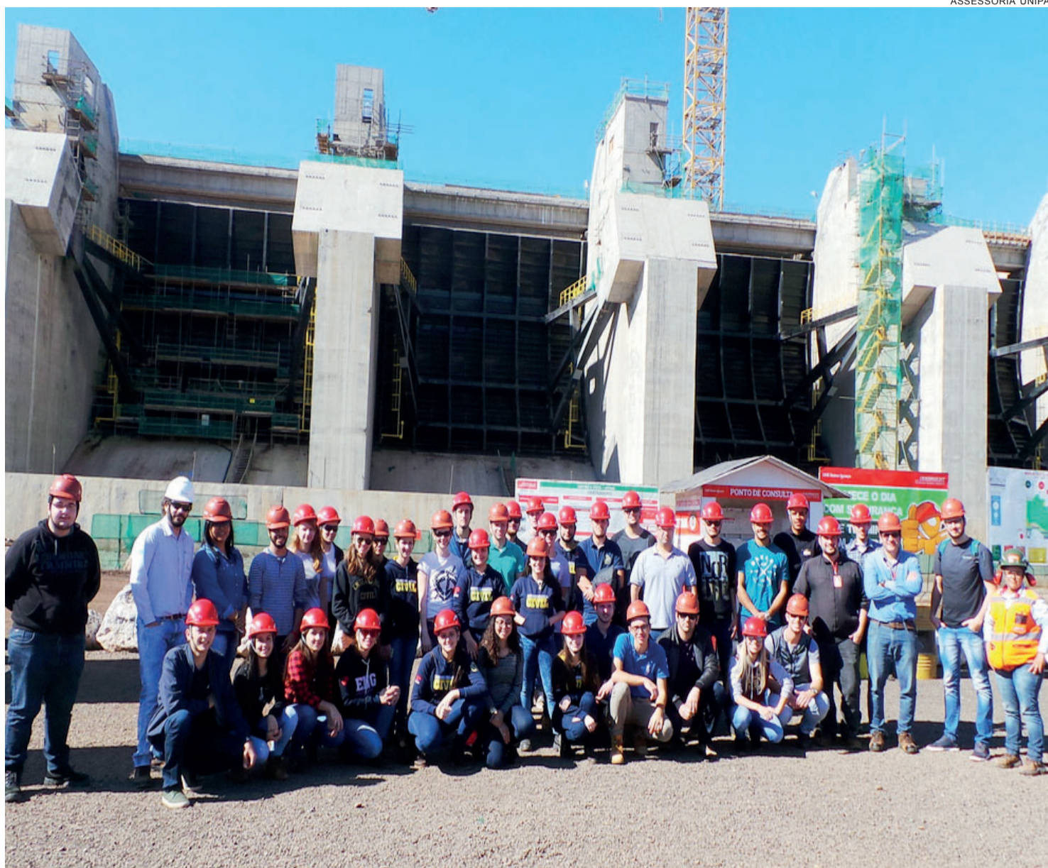
Turma de Engenharia Civil em visita à obra avaliada em R$ 1,6 bilhão