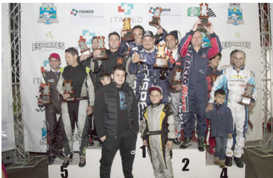
Pódio da Copa Mercosul, coroamento da festas do kart em Foz