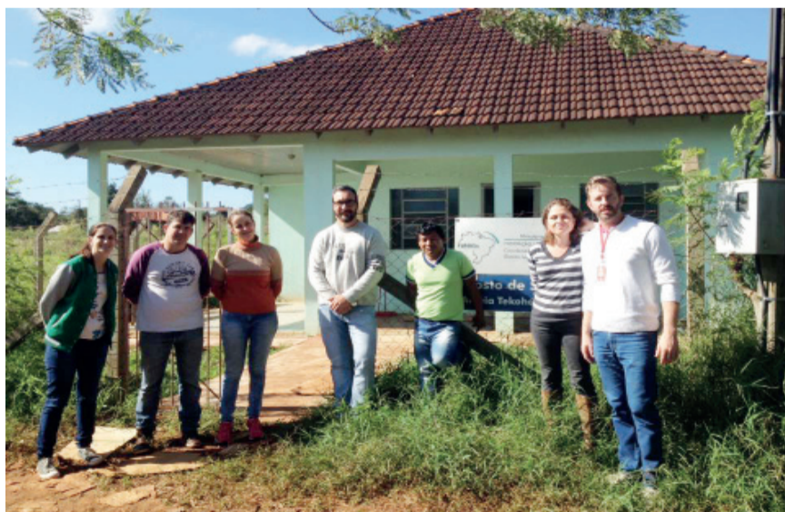
Coordenadores posam com equipe do Posto de Saúde e diretores de escolas