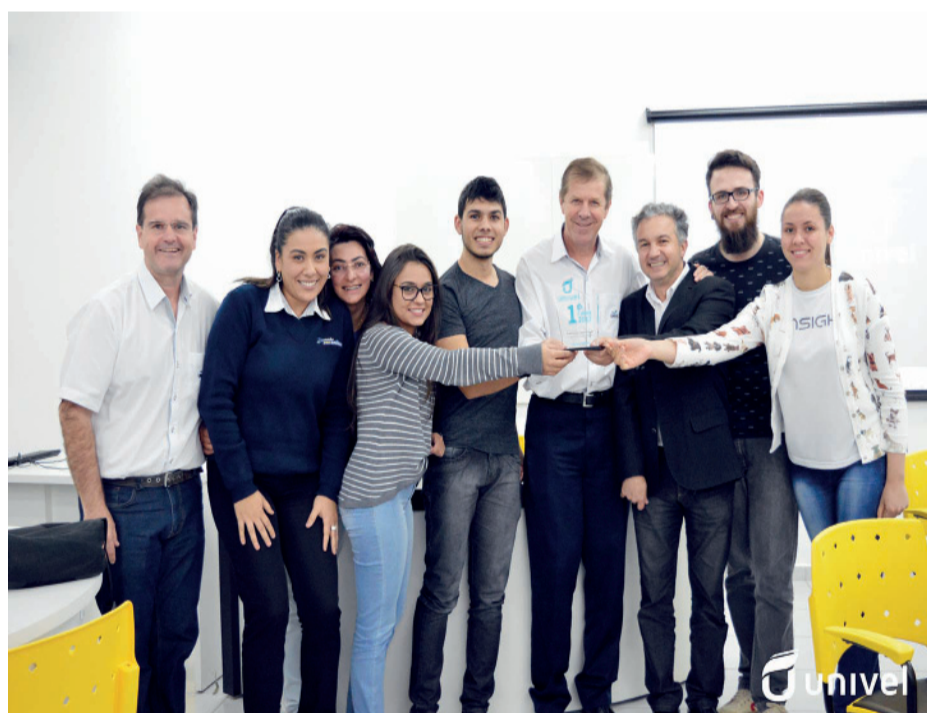
Acadêmicos da Univel vencedores de concurso de projetos de startups