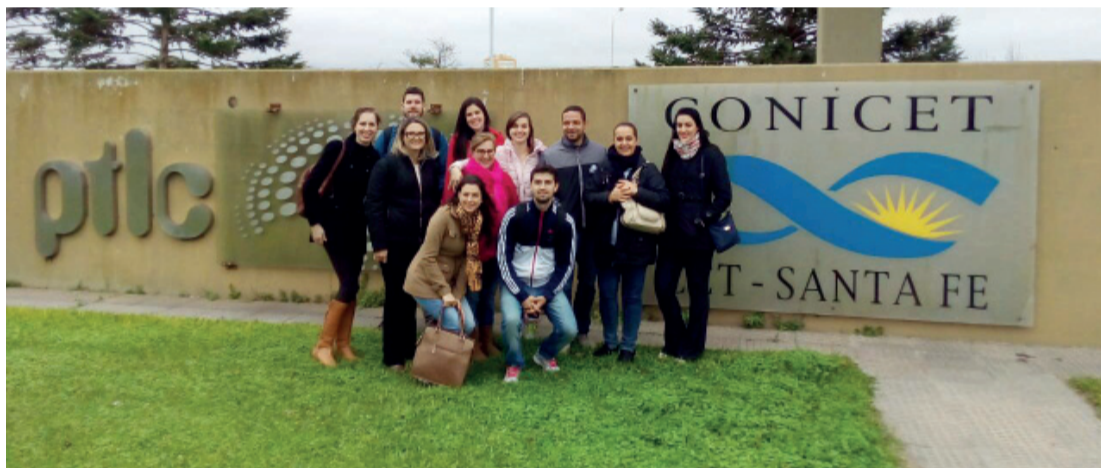
Representantes da Unioeste que participaram de visita técnica na Argentina