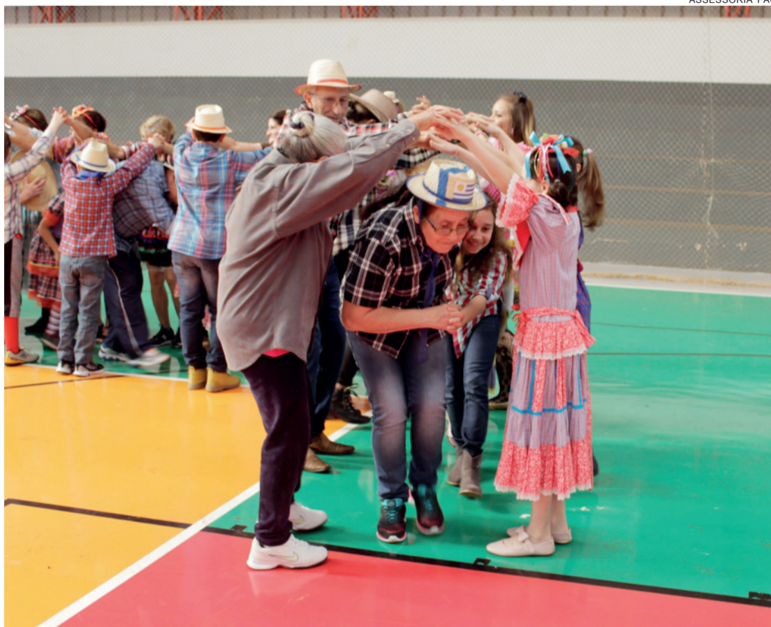
A mistura entre as gerações proporcionou um momento único