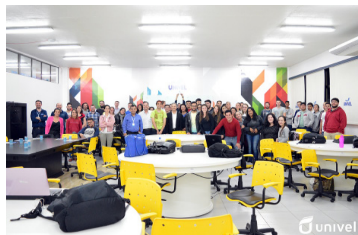
Acadêmicos trabalharam com integração de várias disciplinas