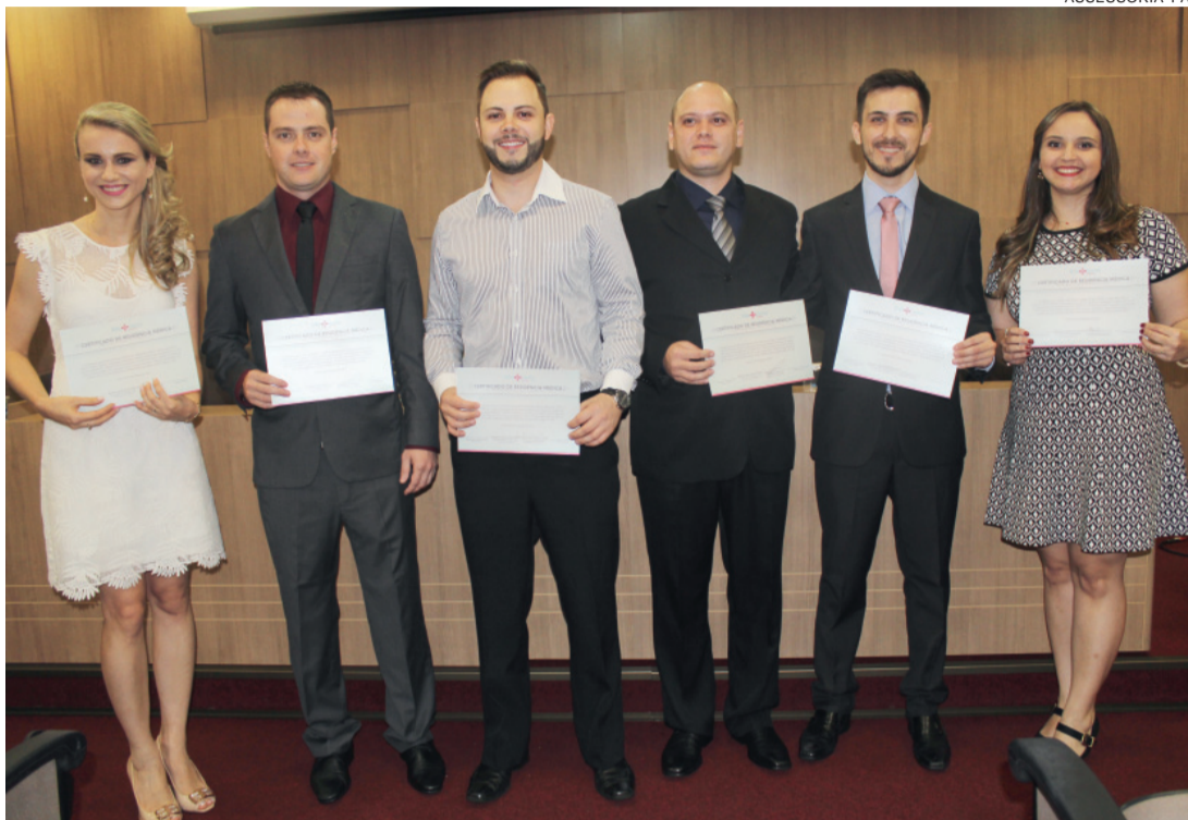
Dos sete formandos, seis estiveram presentes na cerimônia