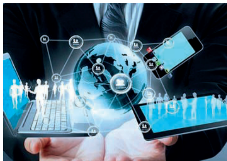
Mais informações e inscrições no site da Unipar, link da pós-graduação

Mais informações e inscrições no site da Unipar, no link da pós-graduação, ou pelo telefone (45) 3277-8500.