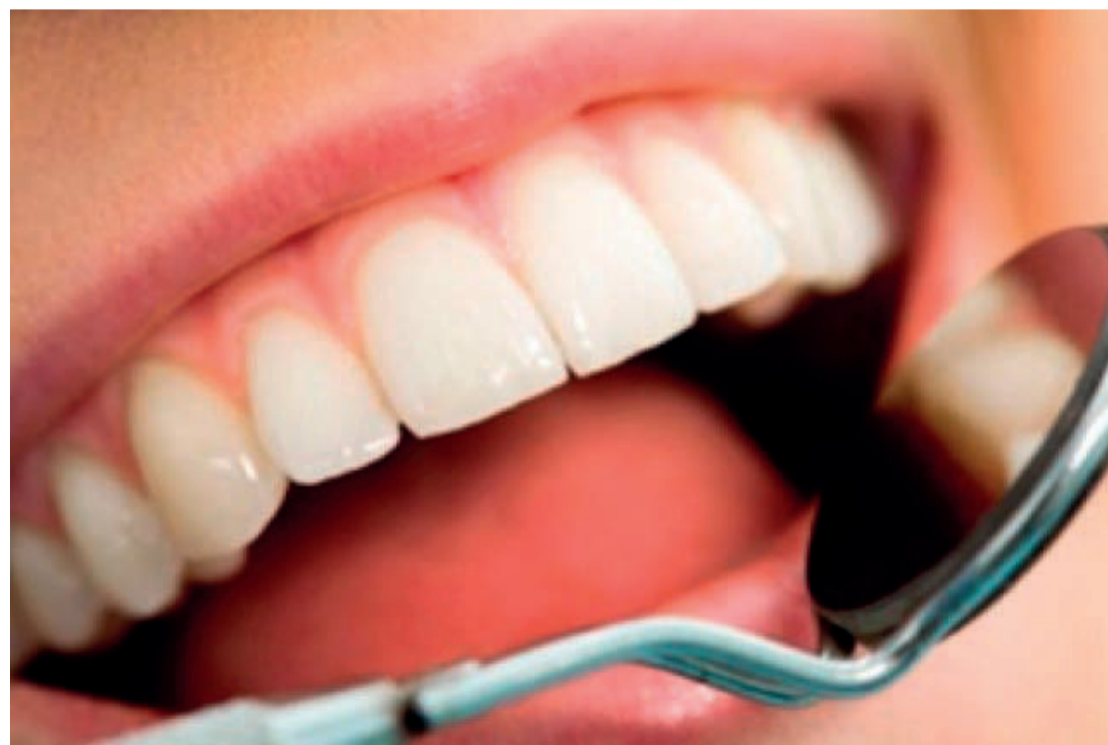
Mais informações e inscrições no site da Unipar; número de vagas é limitado, apenas 12

Cascavel - Doze vagas são ofertadas para a especialização em Dentística da Universidade Paranaense – Unipar. Os cirurgiões-dentistas, com registro no CRO e interessados nesta área, já podem se inscrever. Previsto para iniciar no mês de abril, curso é uma das mais de 110 opções ofertadas pela Instituição nas suas sete Unidades.