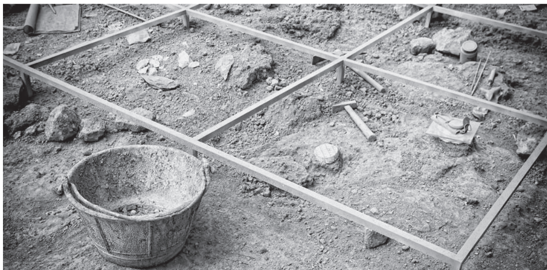
Ex-alunos da Unipar ganham descontos na mensalidade por meio do programa de fidelização

do vencimento e não é concedido aos cursos com número de vagas inferior a 20.