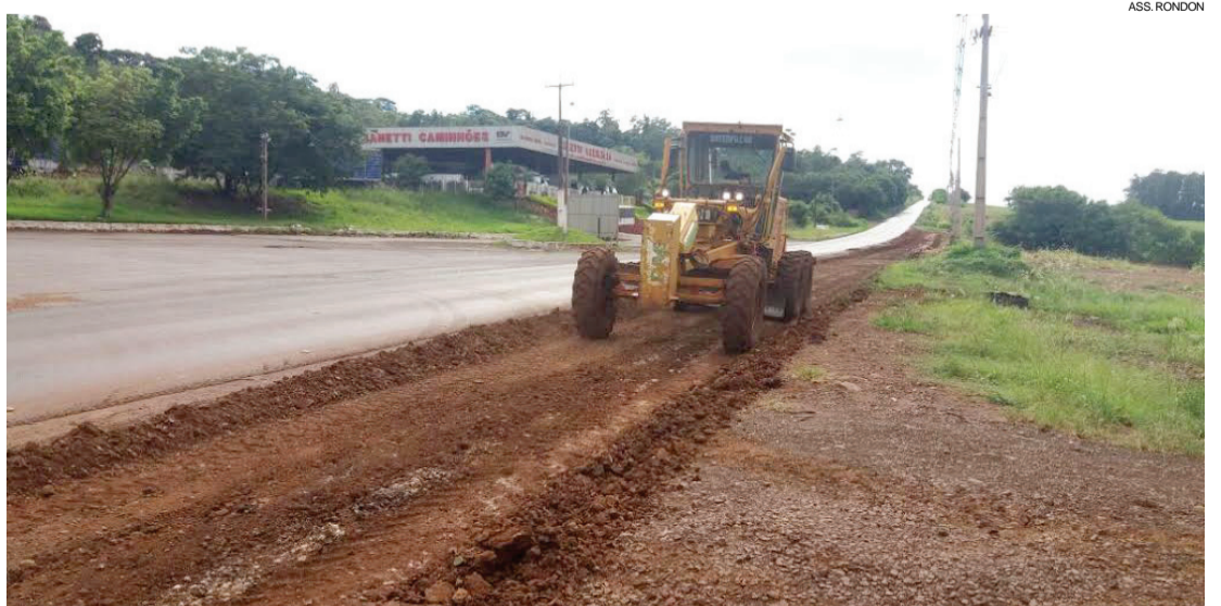
Trabalhos foram iniciados ontem na região próxima a Quatro Pontes. Mais segurança aos motoristas