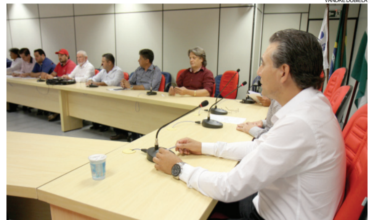
A eleição da nova diretoria do Cisop ocorreu na sede da Amop

A eleição foi realizada na sede da Amop, em Cascavel, e contou com a presença de 19 prefeitos e três vices, do de-