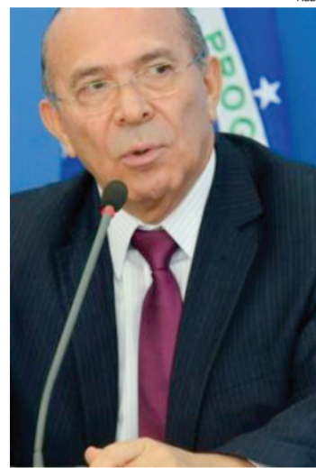
Padilha, que está licenciado, talvez nem volte mais para o governo

gamentos ilegais ao publicitário e à mulher dele, Mônica Moura, entre outubro de 2014 e maio de 2015.