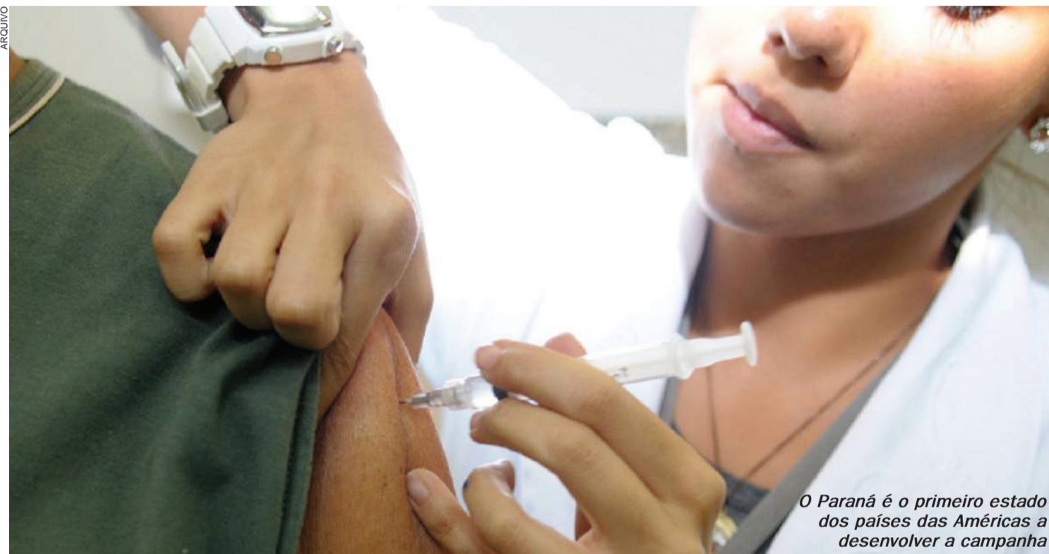
O Paraná é o primeiro estado dos países das Américas a desenvolver a campanha