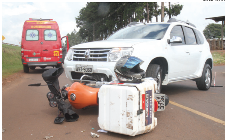
No Paraná são registrados três acidentes com moto por hora

esse número sobe para 60 vezes se a pessoa não estiver usando o capacete.