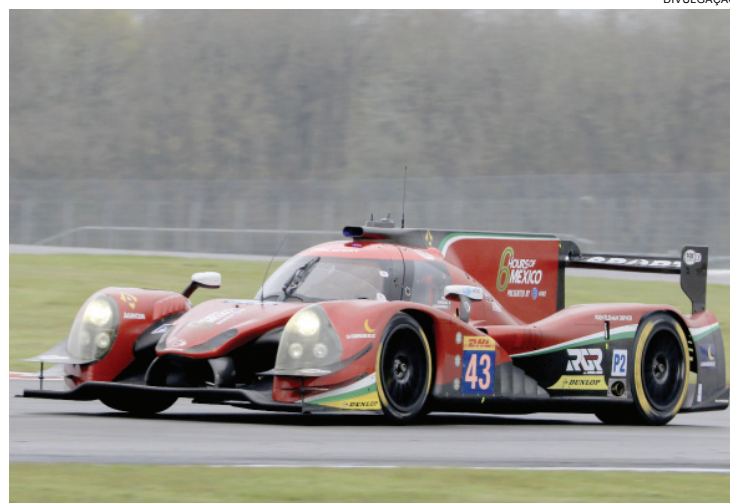
Bruno Senna será um dos pilotos do Ligier JS P2-Nissan nas 6 Horas de Spa-Francorchamps