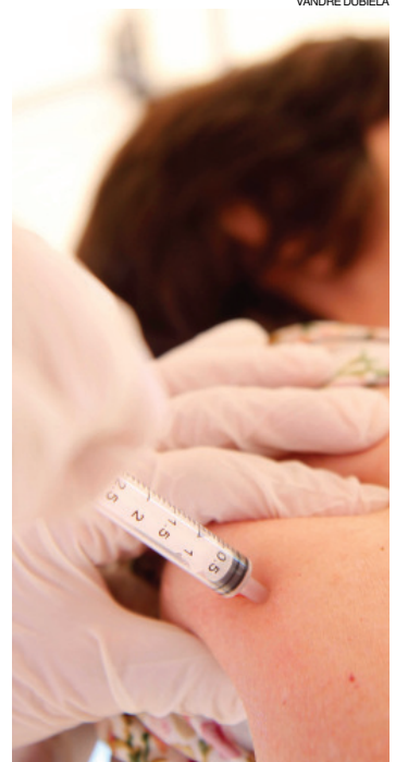
Estoque de vacina devem ser regularizados até o fim de semana em toda região

Aos grupos prioritários, que englobam gestantes, crianças de seis meses a cinco anos incompletos, puérperas, indígenas, idosos acima de 60 anos e trabalhadores de saúde, a cobertura vacinal na região atingiu 118.483 pessoas de acordo com dados das três regionais de saúde. Na contagem não estão incluídas as imunizações dos doentes crônicos e das pessoas privadas de liberdade. Ao todo, 362 mil pessoas devem ser vacinadas no Oeste até o encerramento da campanha, que ocorre em 20 de maio. Em todo o Paraná mais de 1,5 milhão de pessoas já foram imunizadas.