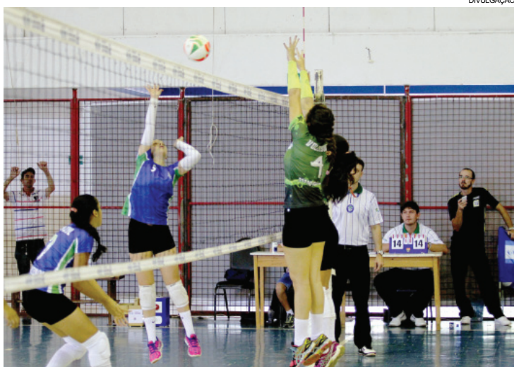
A equipe de Céu Azul conquistou o quinto lugar na primeira etapa

Após a primeira etapa, Palotina aparece na liderança da Copa Integração com 13 pontos. Toledo conquistou o segundo lugar na etapa, chegando aos 10 pontos. Formosa do Oeste aparece em terceiro, com oito, seguida por Medianeira, com seis. Céu Azul está em quinto, com cinco. Foz do Iguaçu, Santa Izabel do Oeste e Campo Mourão completam a tabela de classificação do torneio.