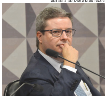
Senador Antonio Anastasia, ontem, na sessão da comissão

Para ser aprovado pelo colegiado, o documento precisa do apoio da maioria simples