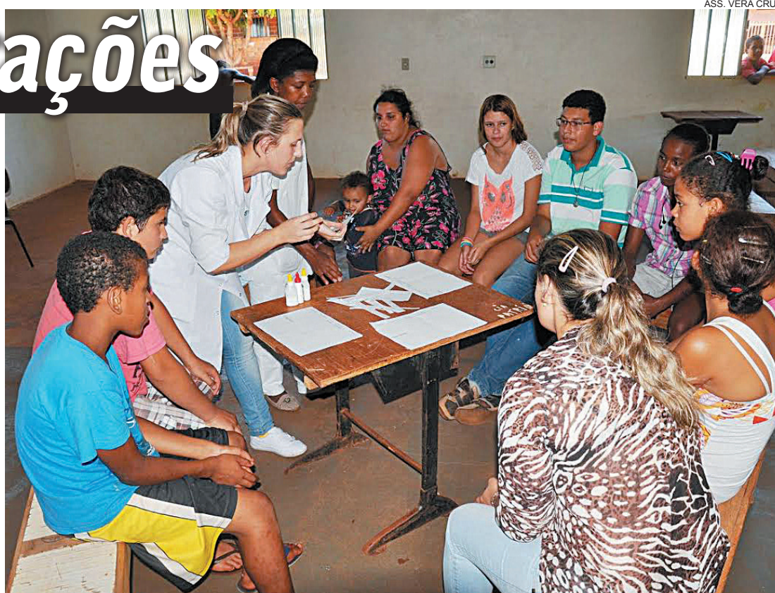
ASS. VERA CRUZ

Brasil entrega à Itália pedido de extradição de Pizzolato