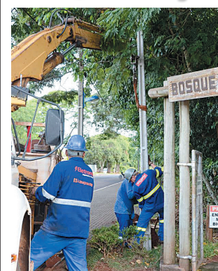
ASS. SANTA TEREZINHA

Vinte quatro postes com luminárias especiais estão sendo instalados no entorno do Bosque dos Pioneiros, em Santa Terezinha de Itaipu. Uma das finalidades é melhorar a segurança no local, principalmente aos que trafegam pela região à noite. Cidades B5