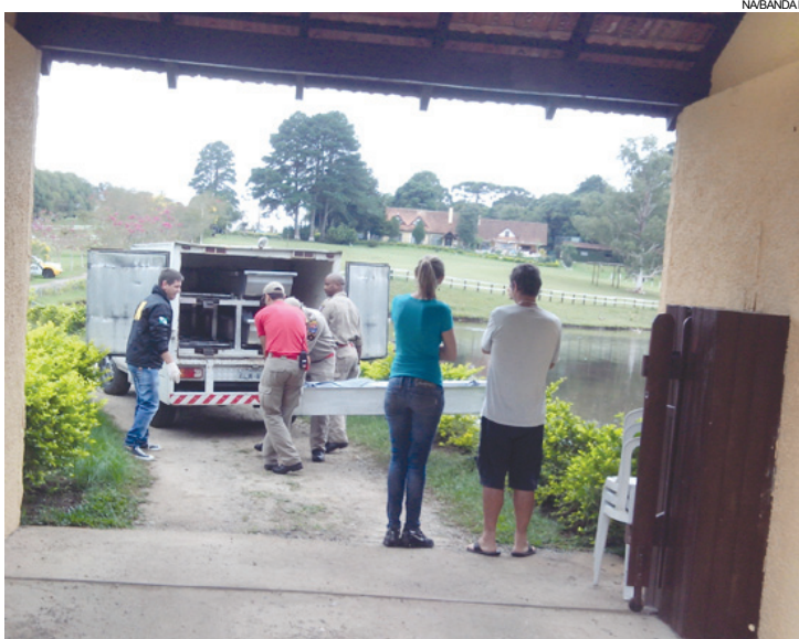
Os corpos foram retirados pelos bombeiros e levados para Curitiba

Na tentativa de pegar a garrafa que se desprende, um dos adolescentes entrou no lago e afundou. O outro mergulhou em seguida na tentativa de salvar o amigo e também se afogou. O lago tem dois metros de profundidade.