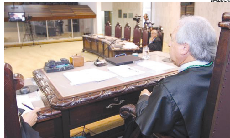
Segundo o TCE, faltam vários documentos que comprovem a aplicação de recursos

Em função dessas lacunas, o julgamento da Segunda Câmara concluiu pela irregularidade das contas da transferência.