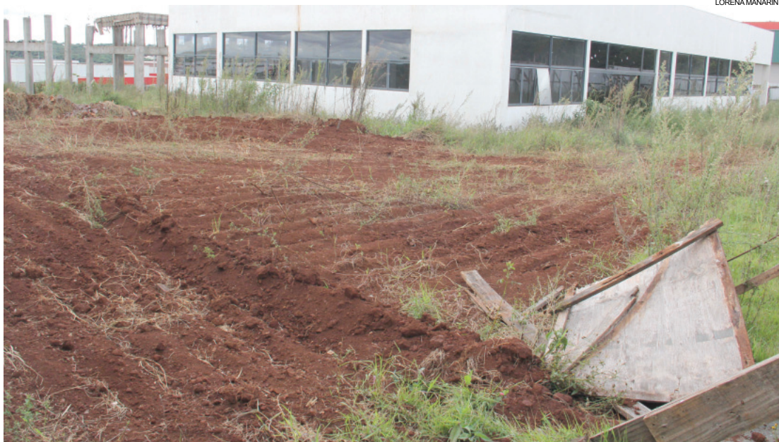
Promessa é de que obras do Moinho Escola deverão ser retomadas em breve

Base servirá para o Oeste, para o Brasil e para países próximos