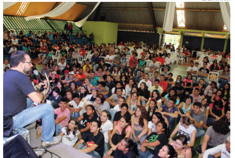
Jovens evangélicos aproveitam o Carnaval com muito louvor, pregação e adoração a Cristo

Cascavel - Sem luxo ou moradia, cerca de 500 jovens da Igreja Quadrangular estão acampados desde sábado nas dependências da Escola Municipal Edison Pietrobelli, o Caic II (Centro Atenção Integral a Criança), no Bairro Santa Cruz.