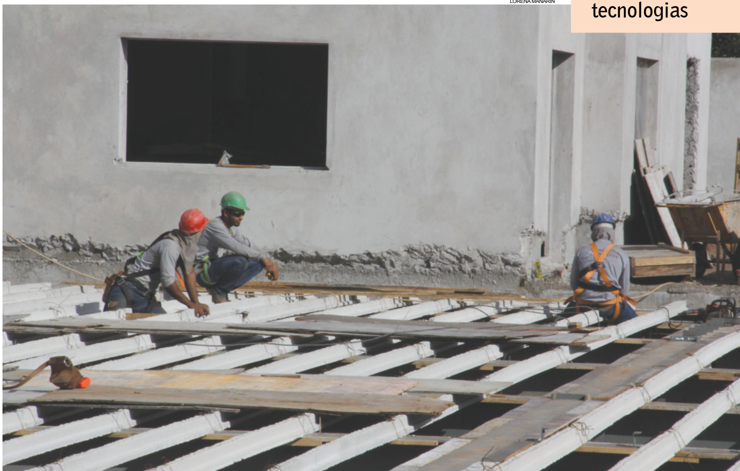
Avanço da construção civil esbarra na falta de capacitação