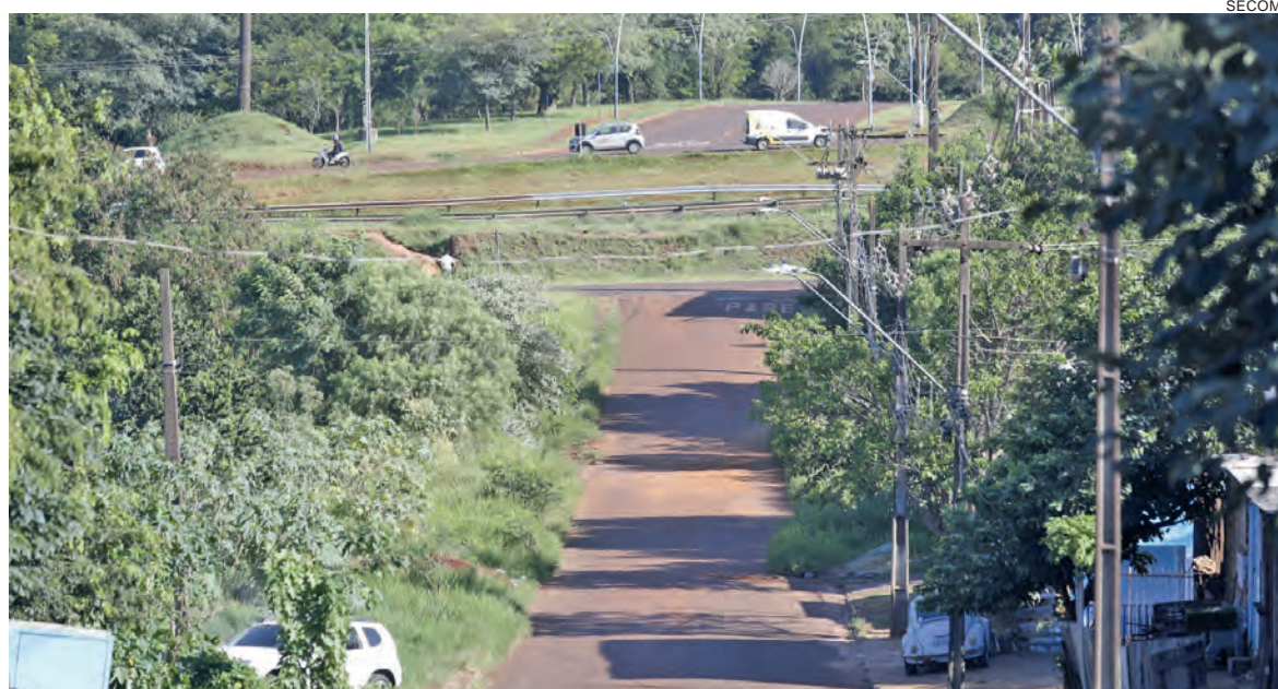
O viaduto ligará a Rua Munique à Rua Waldemar Casagrande

O viaduto ligará a Rua Munique, no Bairro Cascavel Velho à Rua Waldemar Casagrande, na área do Lago Municipal, sendo que o projeto ainda contempla as alças de acesso à BR-277. Atualmente, o principal acesso dos moradores é feito pelo Trevo da Portal – que não atende totalmente às necessidades do fluxo intenso