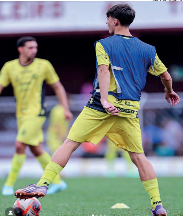
Cascavel tem baixa para o jogo de hoje. Time segue sem vencer na Copinha