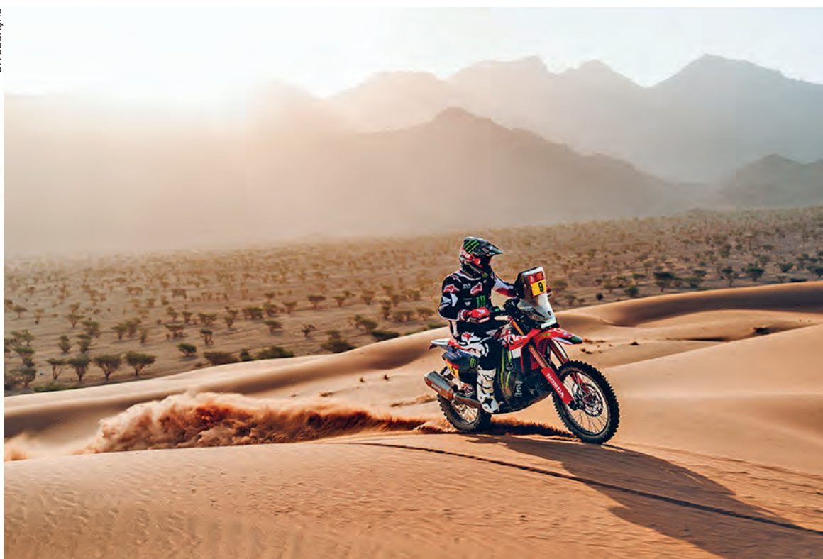
Ricky Brabec chega ao dia decisivo do Rali Dakar na liderança e próximo de conquistar o tricampeonato na categoria Motos

atrás do rival Luciano Benavides - foi colocada em teste na luta do norte-americano por sua terceira conquista no rali.