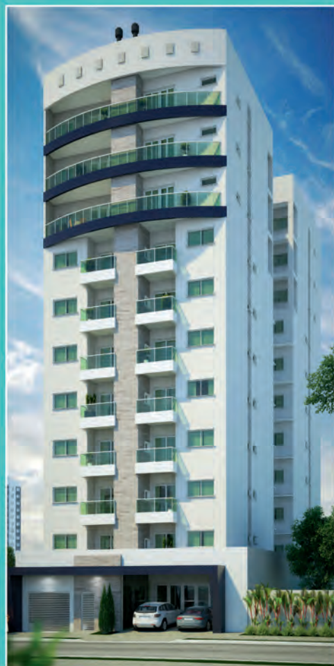
1 Edifício Valence

Para receber os kits, os municípios firmaram um Termo de Adesão e são responsáveis por organizar o armazenamento, manter o cadastro atualizado e prestar contas nos sistemas da Sedef.