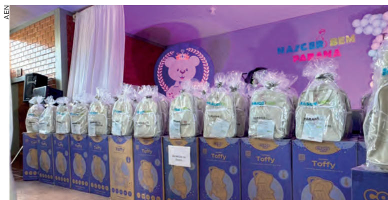
Os kits incluem itens essenciais para os primeiros meses de vida do bebê

O Nascer Bem atende gestantes a partir da 28ª semana de gravidez e puérperas até 30