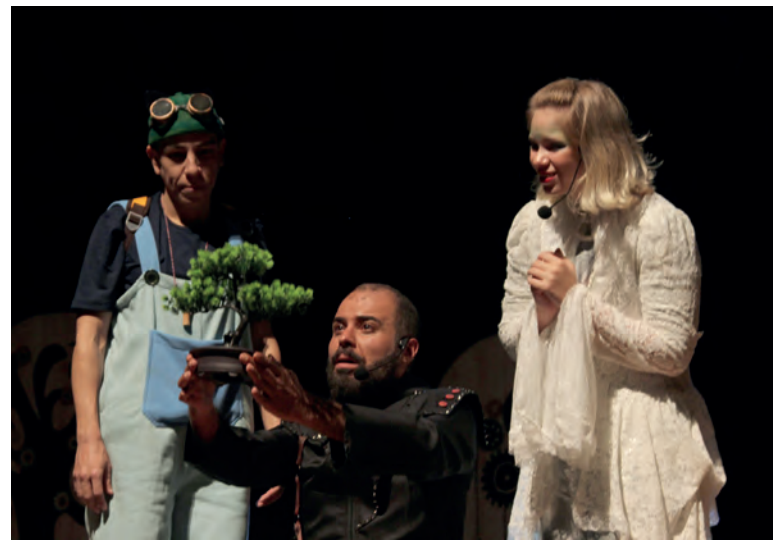
Secretaria de Estado da Cultura – Governo do Paraná, por meio da Política Nacional Aldir

A iniciativa é uma produção do Coletivo Cacareco e da Dupla de Dois Produções, com apoio da Secretaria de Cultura de Cascavel, e realização da