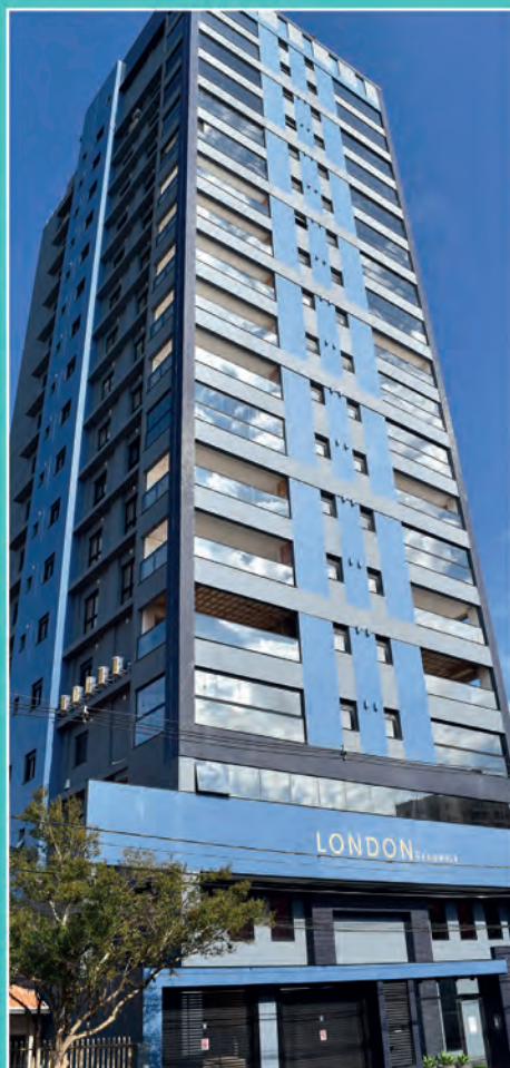
2 Edifício London