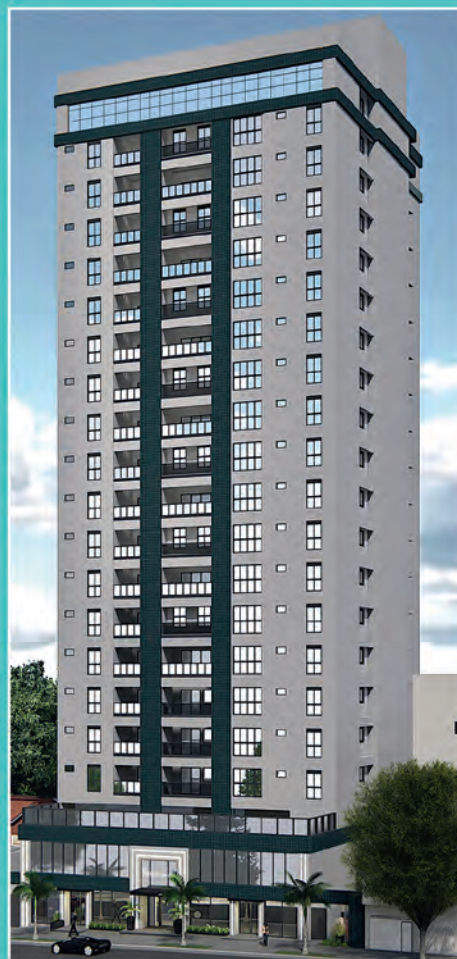
3 Edifício Presença