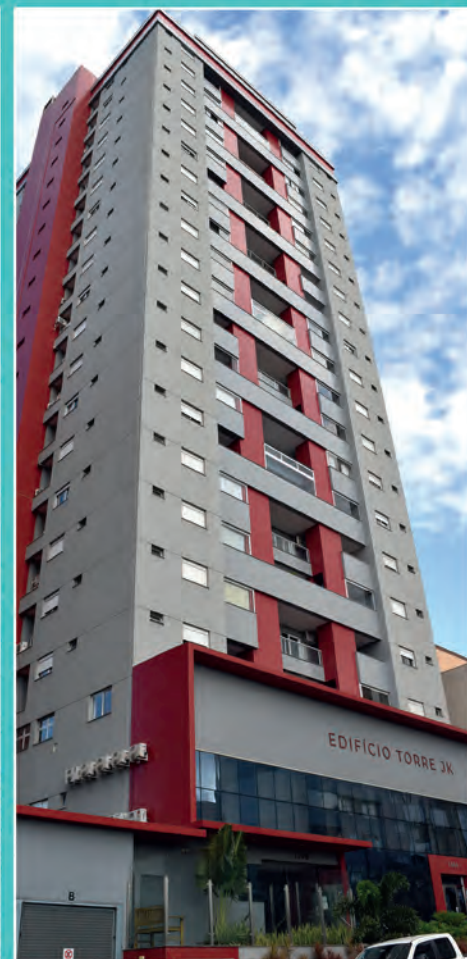
4 Edifício Torre JK