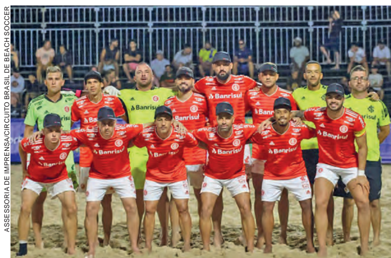
ASSESSORIA DE IMPRENSA CIRCUITO BRASIL DE BEACH SOCCER

Matinhos - O Litoral do Paraná recebe a partir desta sexta-feira (23) um dos principais eventos do calendário nacional de esportes de praia. A 3ª temporada do Circuito Brasil de Beach Soccer terá suas duas primeiras etapas realizadas na praia de Caiobá, em Matinhos, marcando a estreia histórica da competição no Estado.