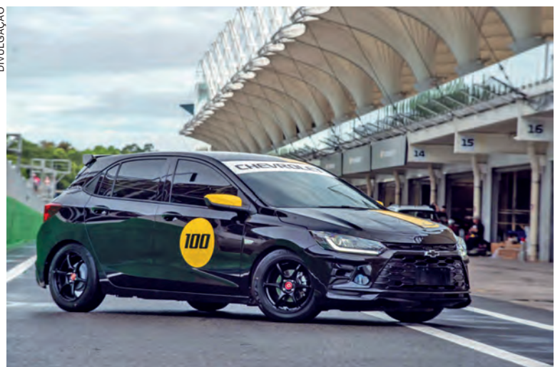
Show car comemorativo tem motor 1.2 turbo, transmissão manual de seis marchas e conjunto técnico dedicado à otimização da performance em autódromos

trajetória no país. Produzido localmente, desenvolvido com o protagonismo da criatividade nacional e adotado por legiões de brasileiros ao longo de diferentes gerações, o Onix se tornou o carro mais produzido da história da marca no Brasil, com mais de 3 milhões de unidades acumuladas.