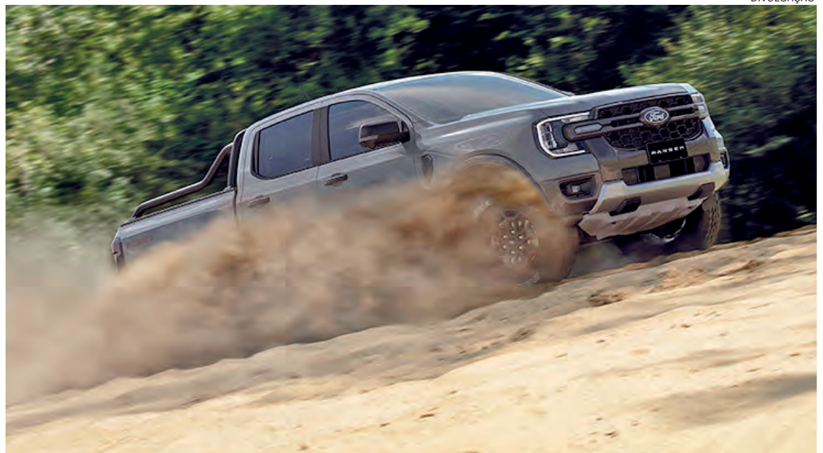
A proposta da Ranger Tremor é oferecer capacidade superior off-road sem abrir mão da dirigibilidade e conforto na cidade

Com oferta renovada de motores, robustez, máxima qualificação em segurança e nível inédito de tecnologia embarcada, incluindo conectividade de série e o mais avançado pacote de assistência à condução, a nova geração da Ranger redefiniu o padrão da categoria e é a picape média que mais cresceu em participação de mercado. Em 2025, ela comemorou 30 anos no Brasil e registrou o recorde de mais de 34.000 emplacamentos, que correspondem a 23% de participação no segmento.