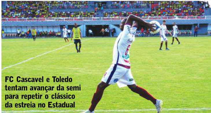
FC Cascavel e Toledo tentam avançar da semi para repetir o clássico da estreia no Estadual

Cascavel – A fase de grupos da primeira metade do Paranaense de Futebol 2019 terminou no último domingo e definiu os quatro semifinalistas da Taça Barcímio Supicira Jr. Destaque para FC Cascavel e Toledo, representantes do Oeste do Estado que terminaram na liderança dos dois grupos da competição e que agora atuarão em casa contra Coritiba e Operário, respectivamente, em busca da vaga na decisão. Ambos os jogos da semi serão domingo, às 17h – em caso de empate, o vencedor será definido nos pênaltis.