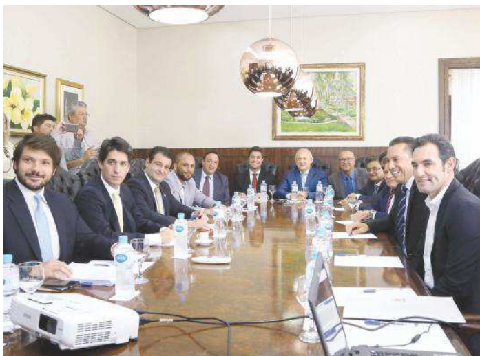
Chefe da Casa Civil e secretário de Planejamento do Governo apresentam projeto de reforma administrativa a deputados