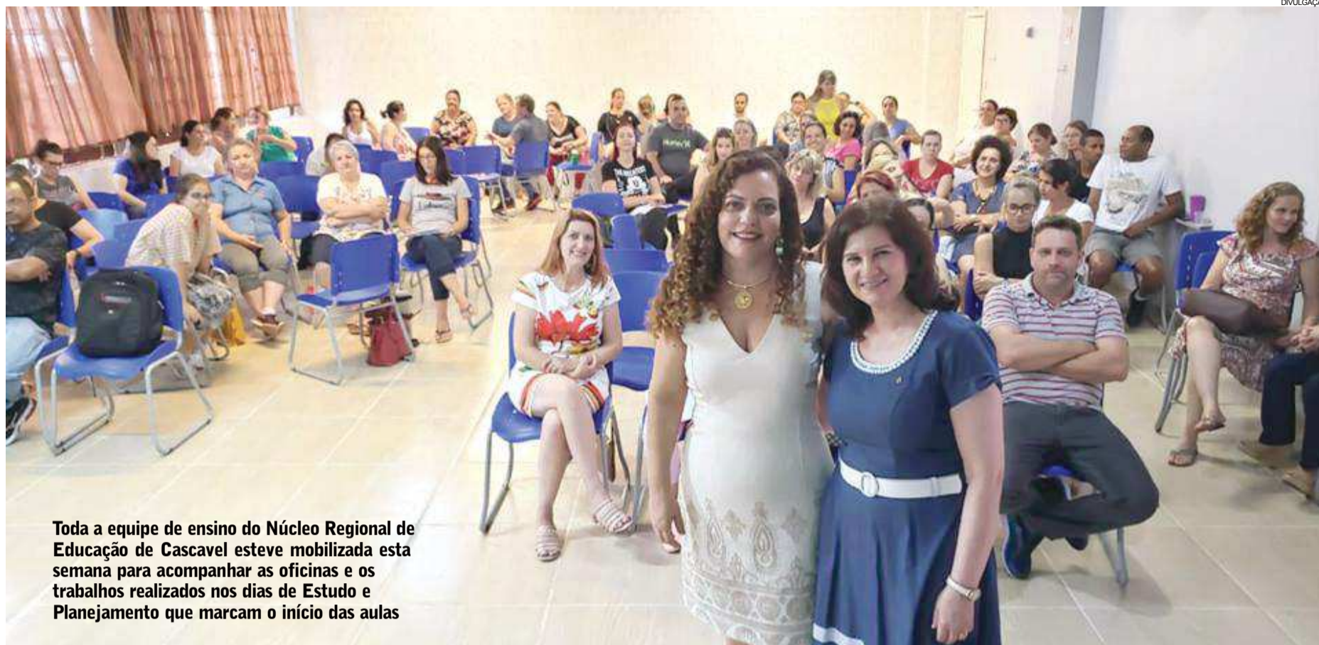
Toda a equipe de ensino do Núcleo Regional de Educação de Cascavel esteve mobilizada esta semana para acompanhar as oficinas e os trabalhos realizados nos dias de Estudo e Planejamento que marcam o início das aulas