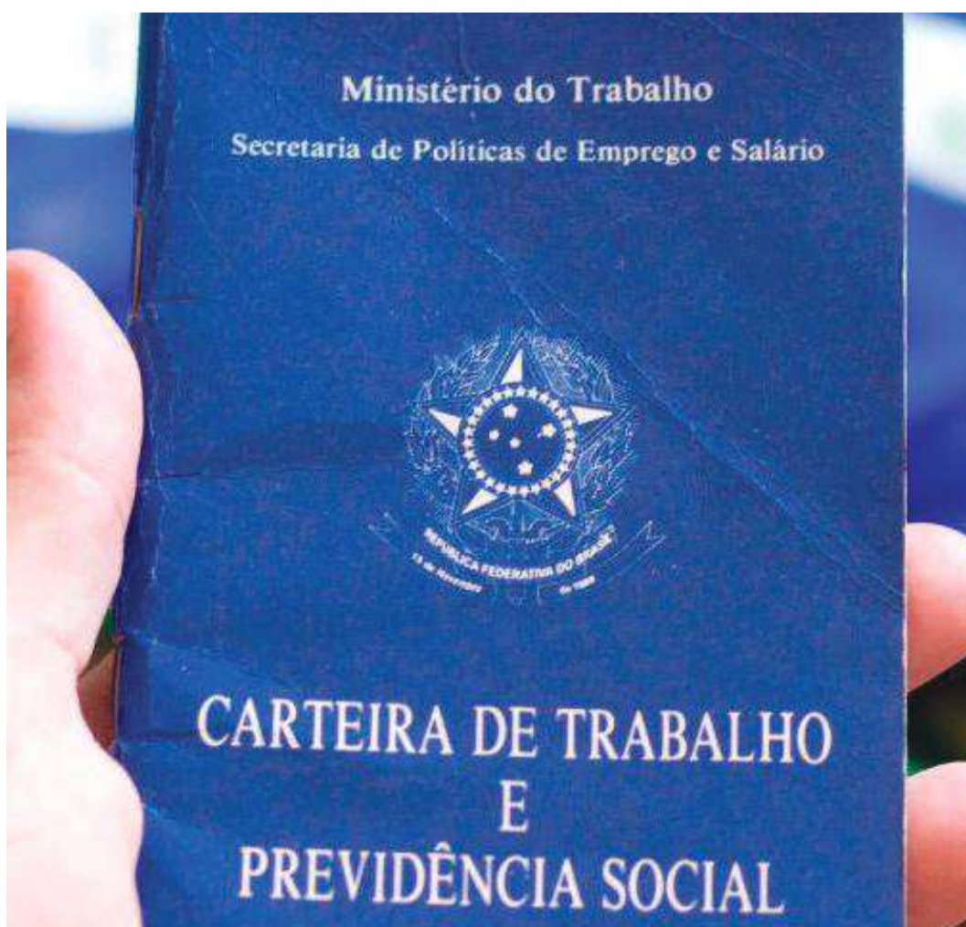
Um dos objetivos do curso é verificar as repercussões materiais e processuais das alterações da Legislação Trabalhista

Ex-alunos da Unipar e de outras instituições de ensino e integrantes das forças de segurança pública ganham descontos nas mensalidades. Mais informações podem ser obtidas no site ou pelo telefone (45) 3277-8500 - ramal 258.