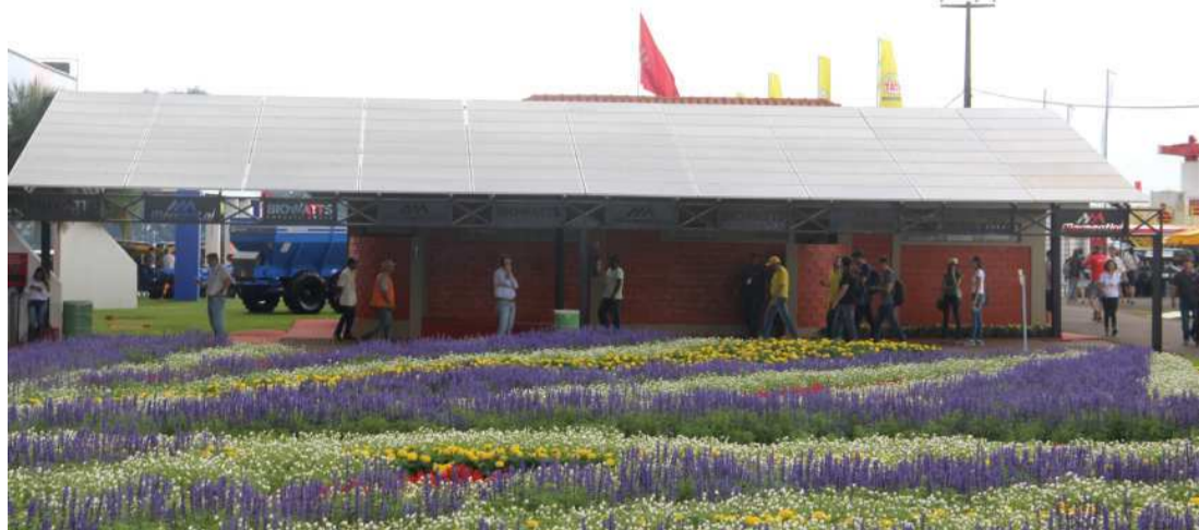
Placas foram instaladas sobre edificações no parque tecnológico