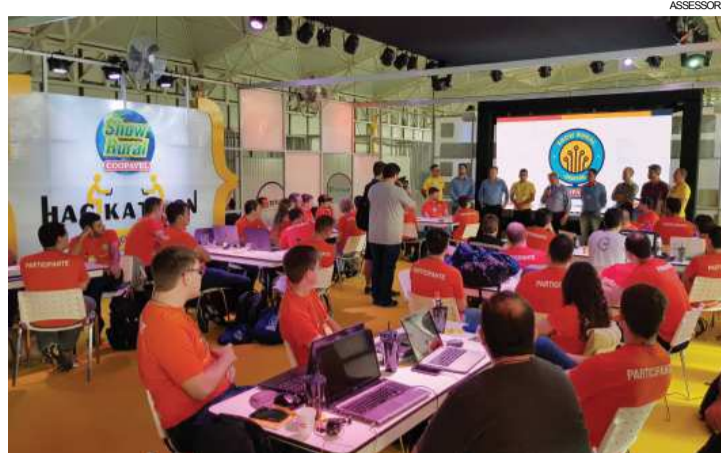
Uma das novidades deste ano, o Hackathon é uma maratona de tecnologia com dez equipes

Mais de 40 empresas apresentam seus portfólios e soluções na Villa Startup, um ambiente que já está atraindo investimentos dos mais diversos cantos do País. "Muitas novidades estão sendo apresentadas e qualquer pessoa pode participar e, segundo seu interesse, tornar-se investidor em uma dessas startups", diz Neto, animado com a grande repercussão que o Show Rural Digital alcança.