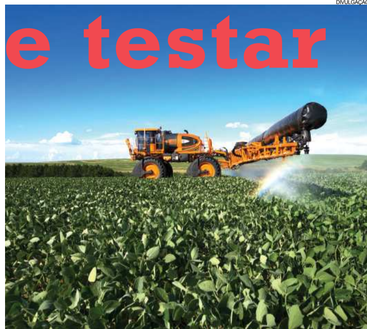
Quatro décadas depois, Uniport 3030 eletrovortex continua fazendo a diferença no campo

PASSE O LEITOR DE QR CODE DO SEU CELULAR E CONHEÇA MAIS SOBRE A UNIPORT 3030 ELETROVORTEX