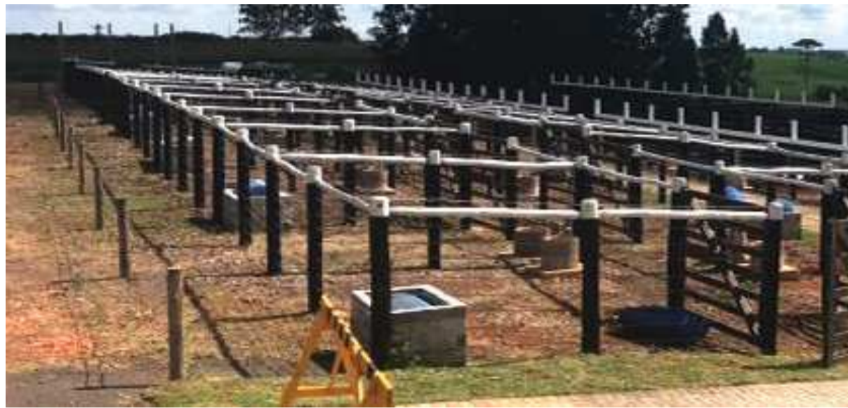
Novos currais foram construídos e reforçam a área de pecuária do evento técnico

Os animais que serão apresentados durante o evento têm o melhor da genética de suas raças. Eles são trazidos em parceria com as associações de criadores. São elas: Caracu, Charolês, Hereford, Bradord, Angus, Brangus, Pardo Suíço, Simental, Holandês, Canchim, Purunã, Brahman, Senepol, Sindi, Tabapuã e Nelore.