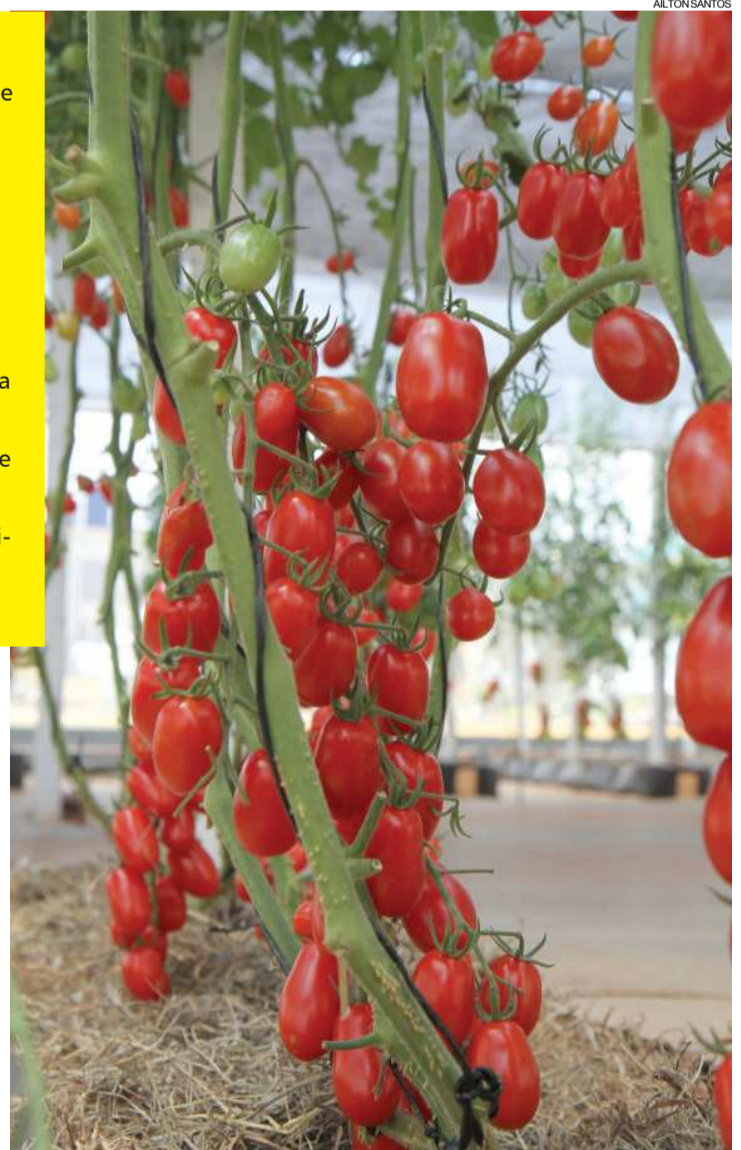
Frutas, legumes e verduras: tecnologia para produção comercial e caseira