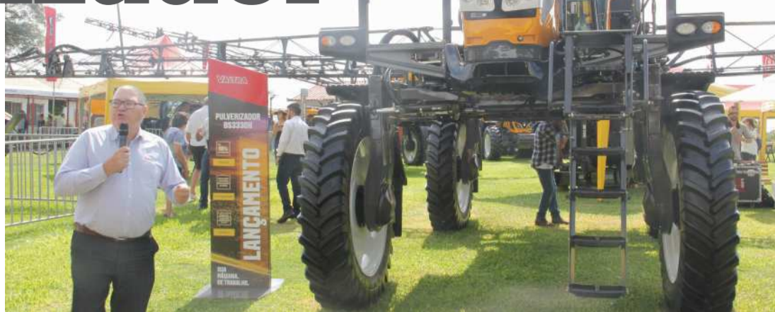
Valtra apresenta nova tecnologia durante o Show Rural

A nova barra de pulverização também chega com evoluções que proporcionam mais proteção e durabilidade ao equipamento. A suspensão horizontal transfere a carga entre as barras e melhora a estabilidade da máquina e o desarme multidirecional de 3 metros impede que possíveis impactos durante os trabalhos danifiquem a barra. Para evitar desperdícios, o BS3330H dispõe de válvulas pneumáticas ProStop, de ativação instantânea,