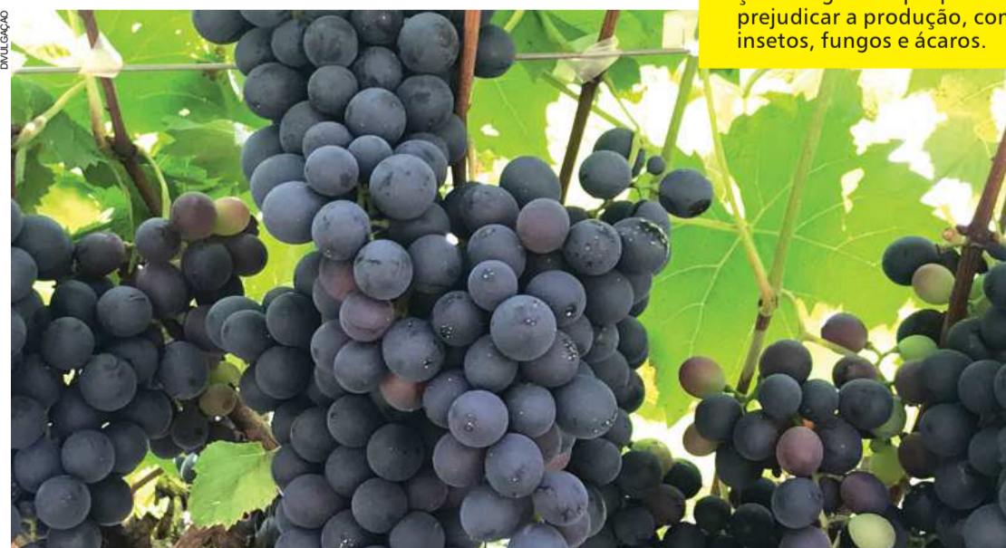
Em parreirais para o cultivo de uva, há exemplificação de diversos sistemas de condução

Em parreirais para o cultivo de uva, há exemplificação de diversos sistemas de condução; plantio, condução e demais tratos culturais de diversas espécies frutíferas, como caqui, figo, banana e goiaba. O planejamento de um pomar caseiro também está ali com produção de frutas o ano inteiro, a exemplo de mudas de qualidade na propriedade por meio da técnica da enxertia, produção da calda sulfocálcica a partir de cal virgem, enxofre e água, importante insumo utilizado na fruticultura para a diminuição de agentes que possam prejudicar a produção, como insetos, fungos e ácaros.