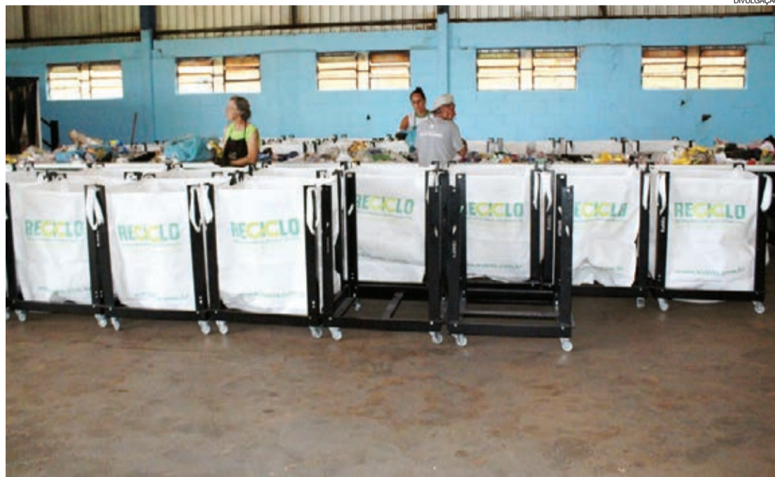
Associação beneficia cinco pessoas que trabalham com a separação de materiais

Tupãssi - O Município de Tupãssi recebeu na última semana uma série de equipamentos para o barracão da Acamartu (Associação dos Catadores de Materiais Recicláveis de Tupãssi).