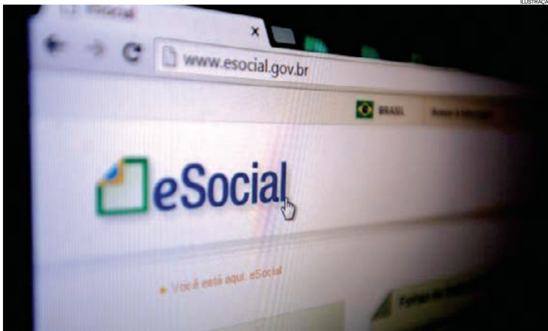
Sistema prevê desburocratizar, mas há regras importantes que precisam ser observadas

clusão do nome no Cadin (Cadastro Informativo de Créditos Não Quitados do Setor Público Federal) e a não liberação da CND (Certidão Negativa de Débitos) aos órgãos públicos o que compromete a possibilidade de investimentos externos ou assinaturas de convênio.