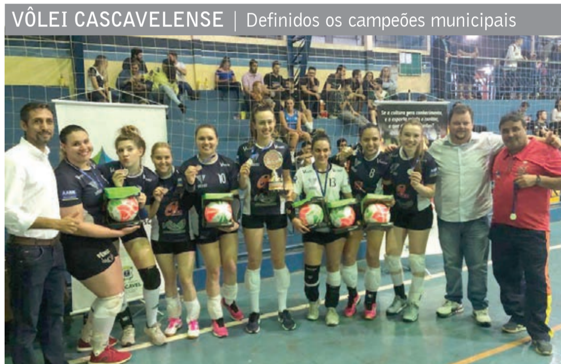
VÔLEI CASCAVELENSE | Definidos os campeões municipais Os primeiros campeões do Campeonato Municipal de Voleibol de Cascavel foram definidos na terça-feira, no ginásio da AABB. No feminino, o título ficou em casa, com a equipe da AABB Vôlei, que venceu o time da Copel Clube por 3 sets a 0 na final. No masculino, o título ficou com time Studio Fitness Life, que na final derrotou os Amigos do Vôlei por 3 sets a 1. No total, o Municipal de Vôlei reuniu 19 equipes e cerca de 230 atletas. A competição foi desenvolvida durante três meses, com 46 jogos em sete rodadas.

Já o Boca, além do arqueiro que fraturou o maxilar no choque com o cruzeirense, não conta também com o lateral-direito Jara e o centroavante Benedetto, ambos por lesão. Vale lembrar que o time do Guillermo Schelotto venceu o Cruzeiro por 1 a 0 até a expulsão de Dedé. Depois, aproveitou a superioridade numérica para abrir a vantagem de dois gols.