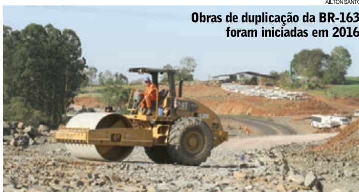
Obras de duplicação da BR-163 foram iniciadas em 2016

Licitada no fim de 2014, a obra teve início em 2016 e prevê investimentos de R$ 579 milhões nos 73,4 quilômetros que serão duplicados. Inicialmente, a previsão de conclusão era para 2018, mas faltando três meses para acabar o ano apenas 55% das obras estão concluídas, segundo informou o Dnit.