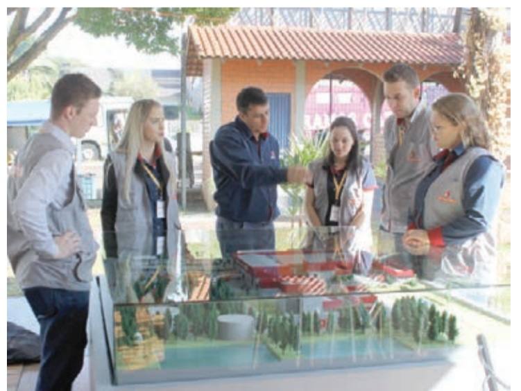
Maquete ilustra novo projeto e dá dimensão do investimento

Conforme o gerente, o número de integrados também vai subir. Hoje, 220 avicultores são parceiros da Diplomata. Até o fim do próximo ano serão 550 produtores. Além disso, o faturamento dos integrados vai passar de R$ 20,8 milhões para R$ 39,7 milhões ao ano, resultado de uma estrutura moderna e com alta capacidade de produção. A previsão mensal de faturamento com o negócio de aves também anima e deve chegar a cifras na casa dos R$ 54 milhões.