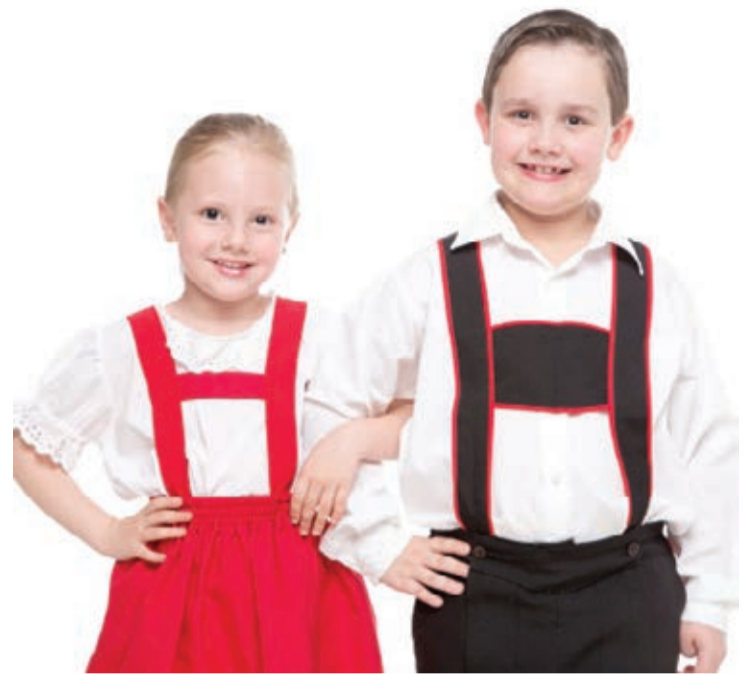
A composição do traje é baseada na cultura germânica

O traje masculino deverá ser composto por: calça até altura do joelho com suspensório, camisa branca, meias brancas, sapato preto e chapéu, além de gravata e colete, que neste caso, são opcionais.