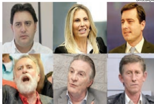
Hoje é o último embate entre os candidatos ao governo do Paraná

Os adversários de Ratinho somam 39% e a diferença é de 5%. Como a margem de erro de erro é de 3 pontos percentuais, há um empate técnico. Ratinho pode oscilar para 41% e a soma dos demais para 42%.