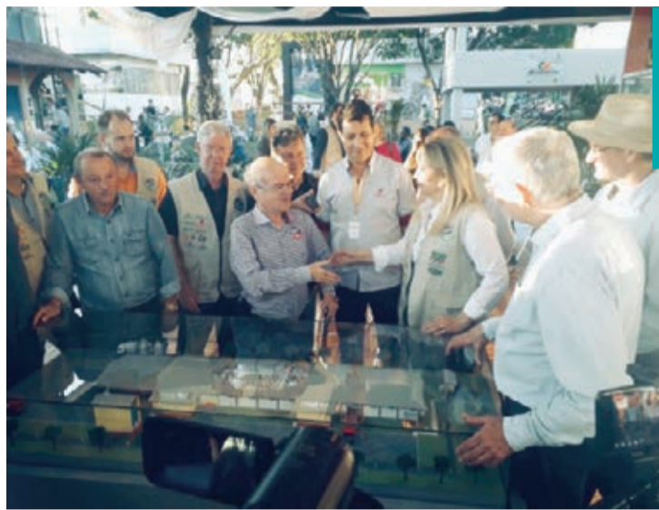
Governadora Cida Borghetti conheceu os detalhes do projeto, apresentado por Alfredo Kaefter

Para Belle, sem a estrutura ali, o município inteiro passaria por dificuldades inclusive para se manter. “Além da arrecadação de impostos, tem os empregos gerados, o comércio é beneficiado com esses salá-