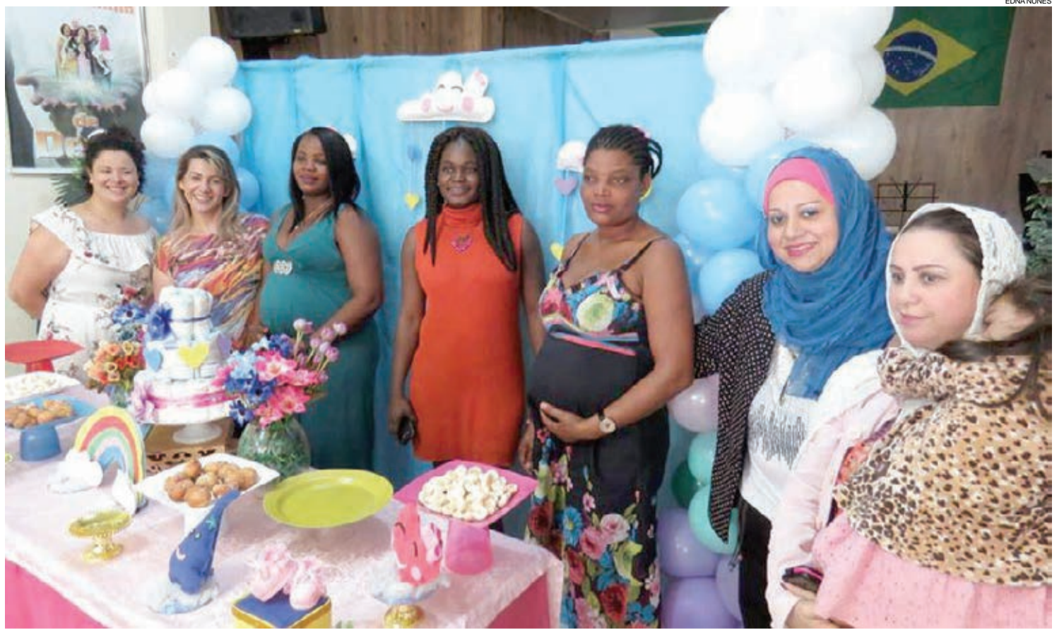
A organização espera que o sucesso do primeiro evento se repita nesta edição

Na primeira edição do evento foram montados 23 enxovais. Quanto às doações, foram recebidos oito berços, 24 colchões, 100 pacotes de fraldas, sete latas de leite e aproximadamente 1.500 peças de