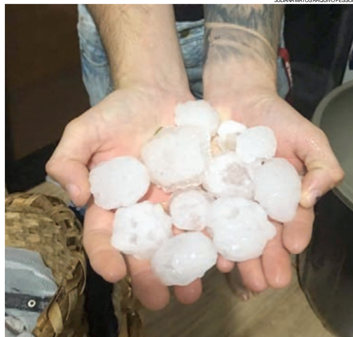
O tamanho das "pedras" de granizo surpreendeu os moradores

De acordo com o Cemaden (Centro Nacional de Monitoramento e Alertas de Desastres Naturais), o pluviômetro