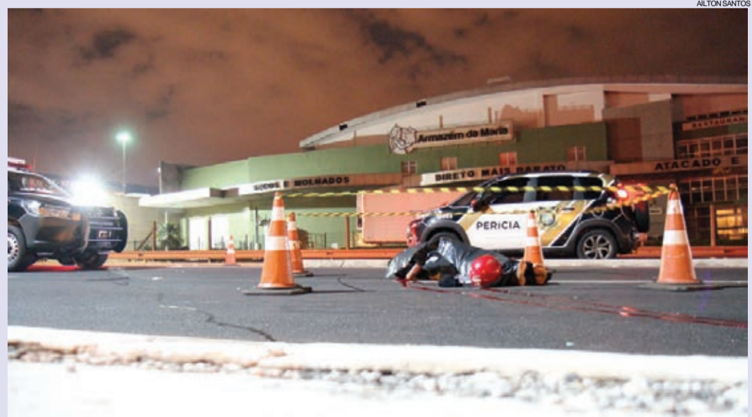
Acidente aconteceu na BR-277, perto do Trevo Cataratas