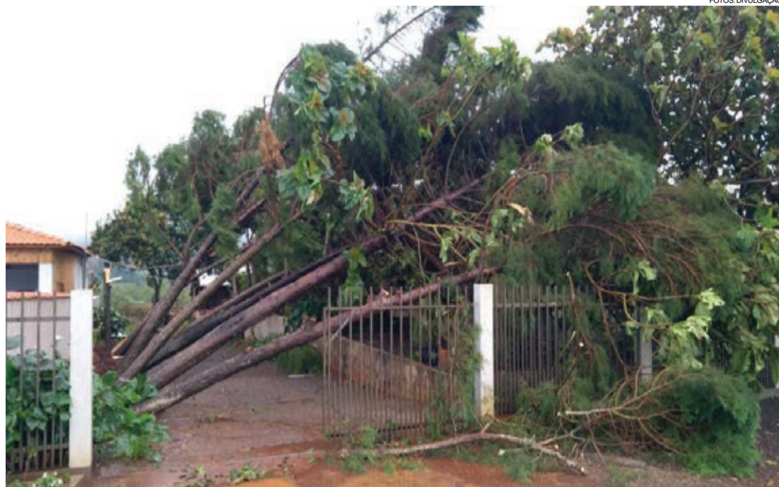
Mais de 30 árvores caíram e pelo menos 500 casas foram atingidas

São Miguel do Iguçu - O governo municipal de São Miguel do Iguçu, por intermédio da Defesa Civil e o Corpo de Bombeiros do Paraná, informa que na madrugada de ontem (2) ventos fortes e chuva de granizo provocaram estragos em vários pontos do Município.