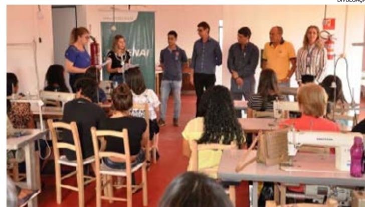
A formatura teve a participação de 27 alunos que estão aptos para o mercado de trabalho

Quedas do Iguaçu - O polo têxtil de Quedas do Iguaçu se transformou no segmento que mais gera emprego na cidade e tem fortalecido a economia local. Com o crescimento da demanda por mão de obra, foi necessário investir em cursos especializados e, na semana passada, a primeira turma com 27 alunos concluiu e recebeu os diplomas do curso de costura industrial. O curso foi desenvolvido pelo Senai/Sesi em parceria com o programa EJA (Educação de Jovens e Adultos).