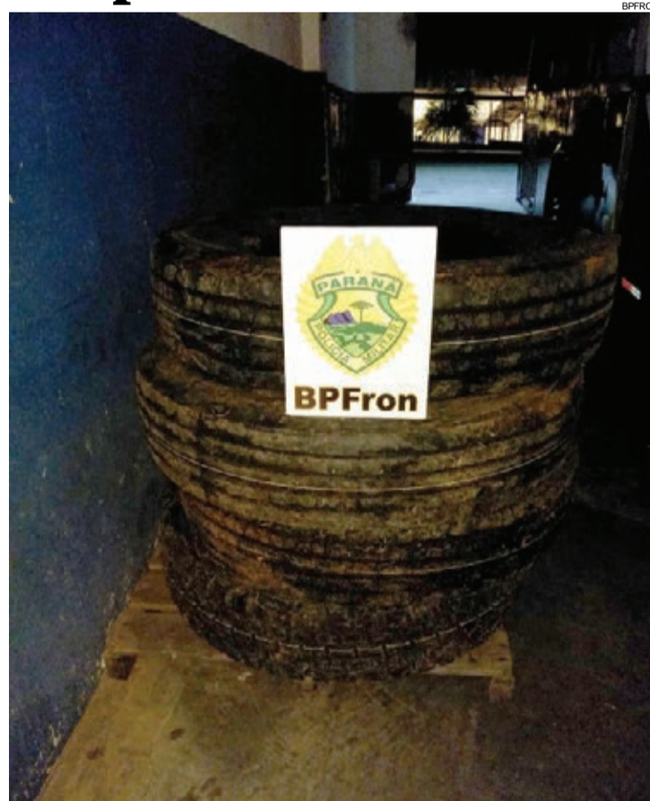
Carga foi recolhida pela polícia e levada para a Receita Federal

Foz do Iguçu - Policiais militares do BPFron (Batalhão de Polícia de Fronteira) apreenderam um carregamento de pneus contrabandeados do Paraguai.