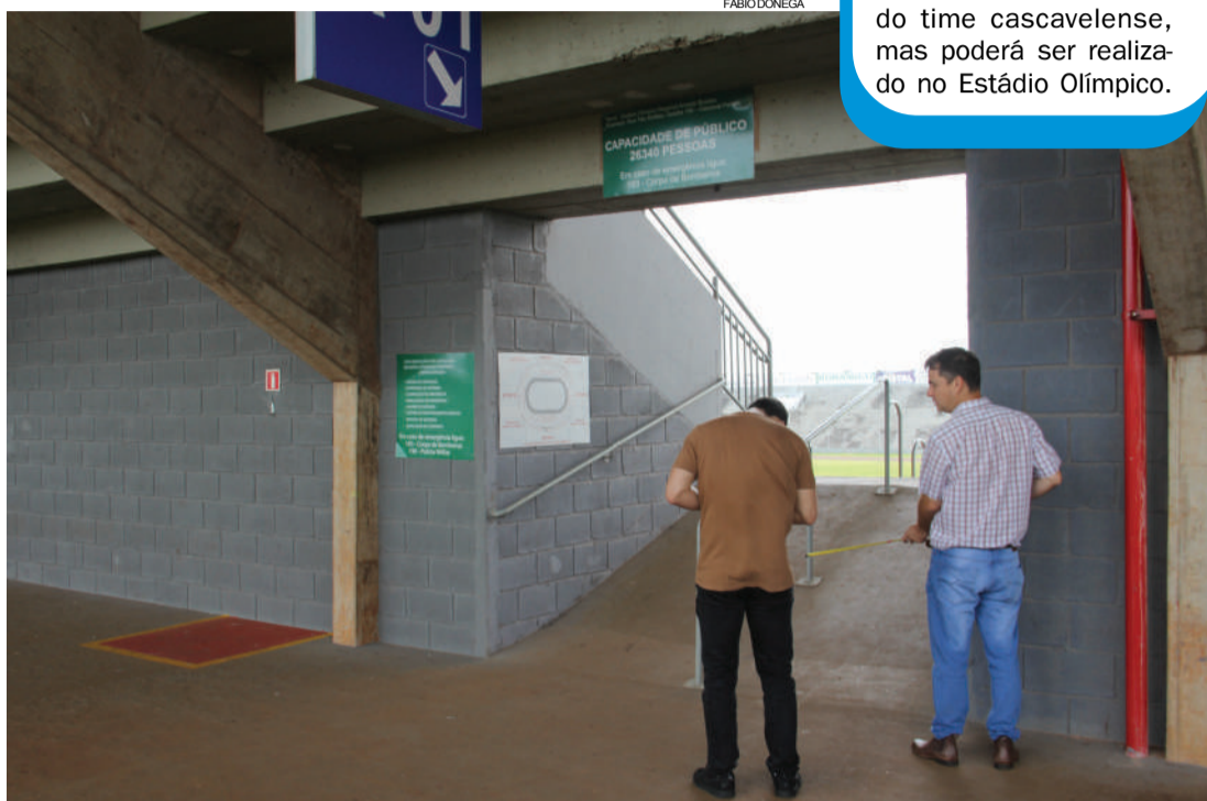
Rampas das arquibancadas estão com inclinação fora dos padrões

O imbróglio no Estádio Olímpico se dá na inclinação das rampas de acesso do público às arquibancadas. Ainda de acordo com Bulgarelli, o Ministério Público pediu confirmações de que o Município estaria buscando corrigir o problema: “foi oficiada a Secretaria de Obras, solicitando cópia da licitação do concreto bombeado e se teríamos mão de obra para o serviço, o que também foi atendido, com cópia do contrato com a PIC [Penitenciária Industrial de Cascavel], dos apenados. Então, acredito