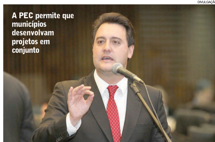
A PEC permite que municípios desenvolvam projetos em conjunto

A PEC, de autoria do deputado Ratinho Junior (PSD), entrou em tramitação no início do ano visando justamente o desenvolvimento regional do Estado. “Precisamos fortalecer os municípios e dar suporte para que desenvolvam projetos que beneficiem a população. Sabemos que sozinhos, muitas vezes, um município não consegue viabilizar as ações necessárias. Organizando-se em conjunto,