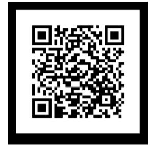
PASSE O LEITOR DE QR CODE DO SEU CELULAR PARA VER IMAGENS DOS ESTRAGOS EM FOZ DO IGUAÇU

beiros e parte da estrutura de um posto de combustível perto da Rodoviária ficou danificada.