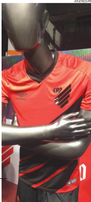
Nova camisa com o novo escudo do CAP a partir de 2019

“A partir de agora é uma nova marca, um novo visual, mas com o mesmo espírito do Furacão, da raça, da ambição, da briga, da ousadia. Isso nós não vamos perder. Modificam-se os costumes, mas os princípios têm que permanecer e isso vai permanecer para sempre com o Atlético”, garantiu o dirigente.