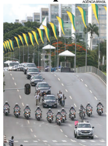
Todos os detalhes foram passados na véspera da posse

A cerimônia começa por volta das 14h, quando Bolsonaro e Michelle deixam a Granja do Torto rumo à Esplanada dos Ministérios. Pouco depois das 14h30, o presidente eleito e a primeira-dama devem trocar de carro em frente à Catedral. Tradicionalmente, o desfile é feito em carro aberto, um Rolls-Royce, mas ainda não está definido se o percurso será feito nele ou em carro blindado.