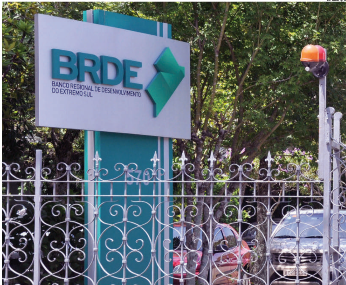
Grande desafio do BRDE foi conquistar novas fontes de recursos

O grande desafio do BRDE em 2018 foi buscar novas fontes de recursos, (fundings), diante da redução de repasses do BNDES, historicamente o maior parceiro do banco. Para diminuir a dependência do BNDES e principalmente cap-