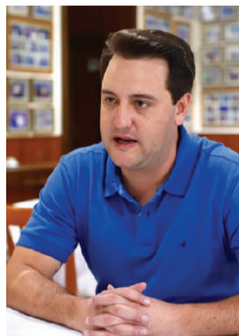
Ratinho Jr, novo governador do Paraná

Sobre seu governo, Ratinho disse que o povo paranaense pode "esperar muita vontade de trabalho, muito planejamento. Nós vamos fazer do Paraná o melhor estado do Brasil. Tenho convicção disso. Vamos fazer do Paraná o estado mais moderno do Brasil. Queremos colocar a educação entre as três melhores do País, fazer com que a segurança pública seja respeitada