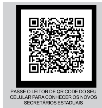
PASSE O LEITOR DE QR CODE DO SEU CELULAR PARA CONHECER OS NOVOS SECRETÁRIOS ESTADUAIS

e sirva de modelo para outros estados, utilizando para isso a tecnologia. Acima de tudo, queremos fazer do Paraná um estado que possa gerar oportunidades. A nossa missão será criar empregos. Para isso, vamos trabalhar para atrair empresas do Brasil e também de fora, para investir no Paraná e gerar emprego para a nossa gente. Esse é o nosso compromisso".