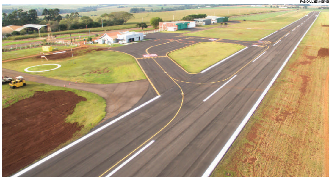
Toledo aguarda por esse voo inaugural há quase um ano