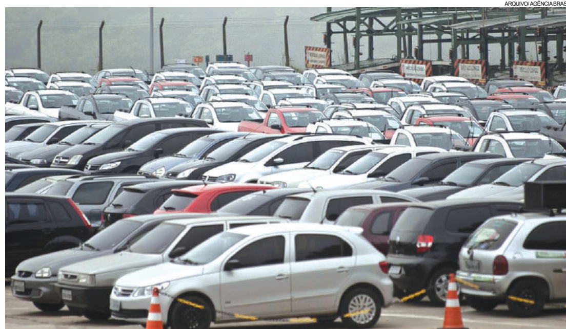
No ano passado, venda de veículos cresceu 13,7%

“Iniciamos 2018 com uma expectativa de alta mais mode-