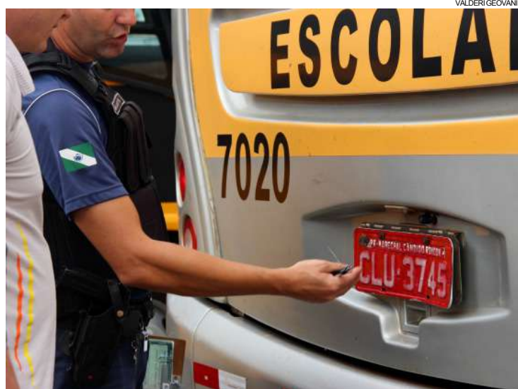
Vistoria visa garantir mais segurança ao transporte de estudantes

Na fiscalização serão verificadas as condições de pneus, acentos, cinto de segurança, faróis, luz de placa, buzina e demais exigências da legislação. Será feita também a vistoria na documentação do carro e do condutor.