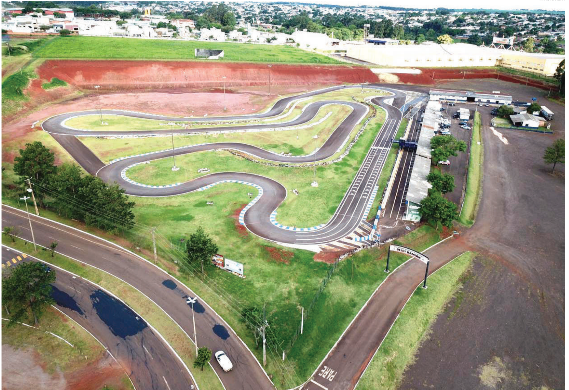
A primeira competição do ano no Kartódromo Delci Damian, em Cascavel, será nos dias 15 e 16 de fevereiro, com a etapa de abertura do Metropolitano

O automobilismo de Santa Catarina inicia a temporada 2019 nos dias 16 e 17 de fevereiro, com a tradicional prova 3 Horas de Joaçaba, no Autódromo Cavalos de Aço. A competição chega à sua terceira edição e atrai competidores da Velocidade na Terra de todo o Brasil. Também farão parte da programação as provas 2 Horas de Autocross e 1 Hora de Stock Car. A promoção e a organização são do Automóvel Clube de Joaçaba, com supervisão da Fausc (Federação de Automobilismo do Estado de Santa Catarina).