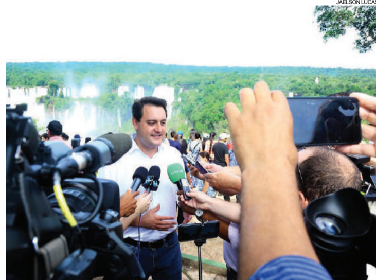
Em Foz, Ratinho anuncia dois programas para incentivar o turismo no Paraná

Iguaçu, segunda cidade do Brasil mais visitada por estrangeiros. "Não faz sentido Foz não possuir um aeroporto que comporte voos internacionais ou uma rodovia com pista dupla. Esses assuntos serão prioridades para o governo".