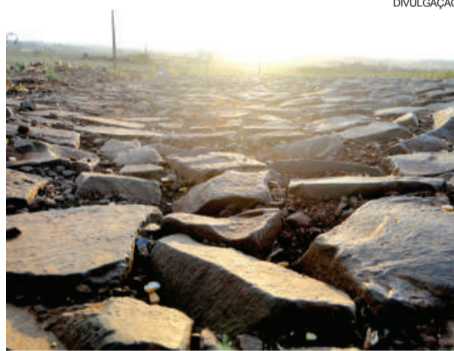
Pavimentação poliédrica está em péssimas condições de trafegabilidade

Segundo o prefeito Marcio Rauber, tudo o que era de obrigação do Município foi feito em tempo hábil. Para ele, a reivindicação da população é justa, pois as pedras irregulares que foram implantadas naquela rodovia são de péssima qualidade e causam transtornos aos usuários. Isso será