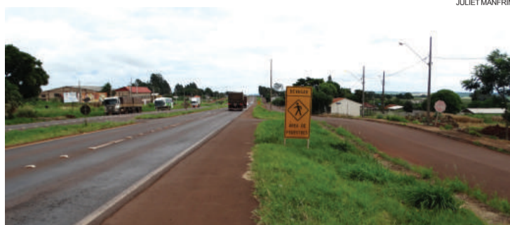
Radares foram removidos há cerca de duas semanas e condutores abusam da velocidade

Os moradores são os mais prejudicados e contam que em horários de pico atravessar a rodovia de um lado a outro ficou praticamente impossível. “Tem uma faixa de pedestre que ninguém respeita. Depois que tiraram os radares, e a gente nem sabe quem tirou, a situação ficou ainda mais complicada. Tem caminhão que passa acima dos 100 quilôme-