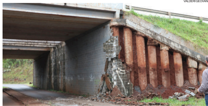
Estrutura está "desmanchando"

O local apresenta deterioração de parte das paredes que sustentam a estrutura de terra. O material fabricado em pequenos blocos de concreto