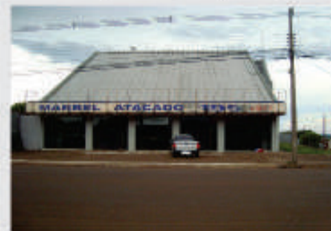
Sala Comercial localizada na Rua JK, 287. Imóvel com aproximadamente 1000 m², sendo térreo com três banheiro, 1 com acessibilidade; 1º andar com 2 banheiros e 4 salas e 2º andar com uma sala e um banheiro. Valor para a locação R$ 18.000,00