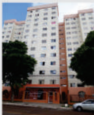
APARTAMENTO SEMI-MOBILIADO localizado na Rua Mato Grosso, 995. 64 m² com sala, cozinha, 2 dormitórios, banheiro social, área de serviço, 1 vaga de garagem. Valor para locação R$ 850,00 + condomínio