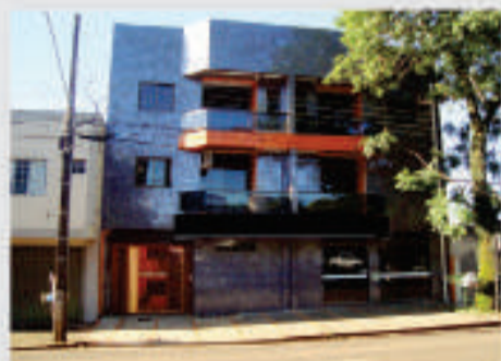
Apartamento localizado na Rua Rio Grande do Sul, 2293. 110 m². 1 Sala, 1 Cozinha, 2 dormitórios, 1 BWC, 1 Lavanderia, 2 Sacadas, 1 Vaga de Garagem Coberta. Valor para locação R$ 900,00