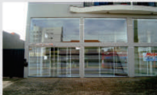
Sala Comercial localizada na Rua Pio XII, 1611, Neva. com 120 m², sendo 60 + 40 de mezanino. Próximo ao Muffatão. Valor para locação R$2.500,00