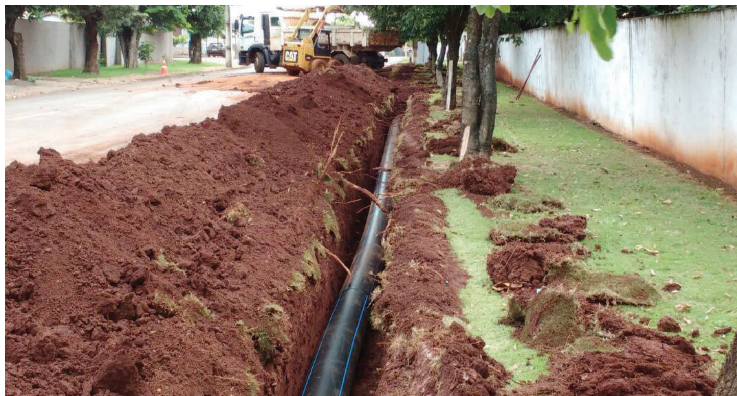
Obras de assentamento das redes de distribuição de água

Dois poços tubulares profundos vão ampliar o forne-