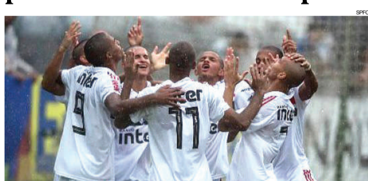
Antes da final, jogadores do São Paulo raspam a cabeça em homenagem a garotinha com cancer

São Paulo - Equipe que leva o nome da maior cidade do País, o São Paulo Futebol Clube, que ontem comemorou 89 anos de fundação, foi o grande campeão da 50ª Copa São Paulo de Futebol Júnior, encerrada com muita chuva ontem, dia também do aniversário de 465 anos de São Paulo. O Tricolor venceu o Vasco nos pênaltis, por 3 a 1, depois de empate por 2 a 2 no tempo normal, no Pacaembu.