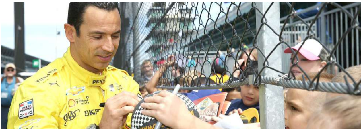
Helio Castroneves, competindo pela Penske, está na segunda colocação do grid de largada das 24 Horas de Daytona