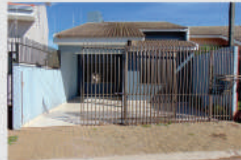
Casa localizada na Rua Cambará 490B, Cidade Verde. 97m² 01 sala com 02 ambientes; 01 cozinha; 02 dormitórios; 01 Suíte; 01 WC Social; área de serviço; 2 vagas de garagem. Valor para locação R$1.200,00