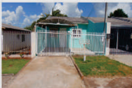
Casa Localizada na Rua Gurgel, 1605, com 60 m². 1 Sala; 1 Cozinha; 2 Quartos 1 Banheiro; 1 Lavanderia; 2 Vagas de Garagem. Valor para locação / venda R$ 750,00 / R$ 125.000,00.