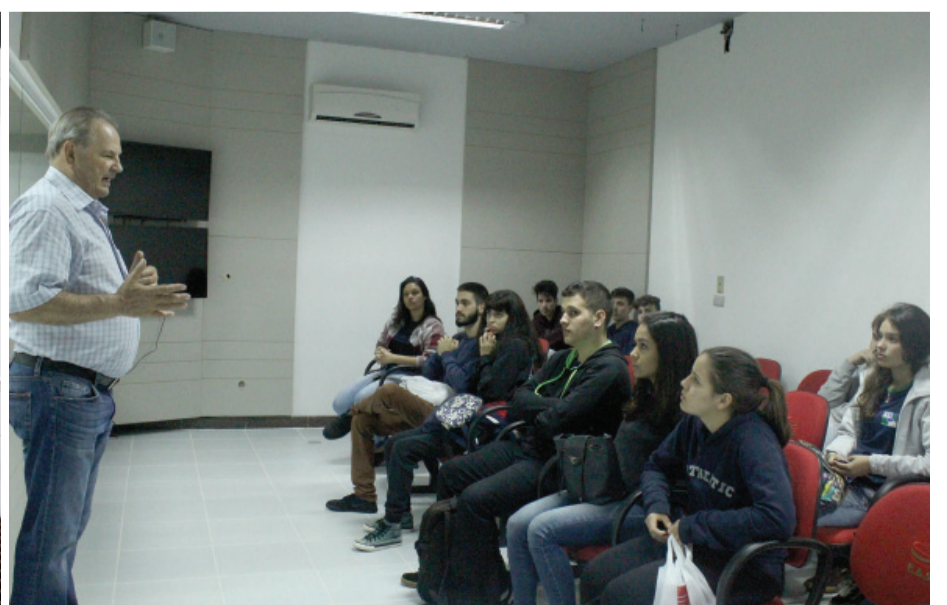
Quem passou pelo Laboratório de Habilidades recebeu dicas do reitor