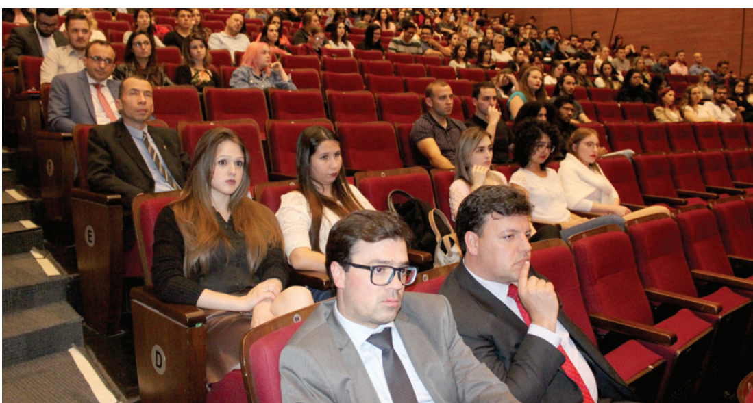
Acadêmicos de Direito prestigiam discussões junto à comunidade