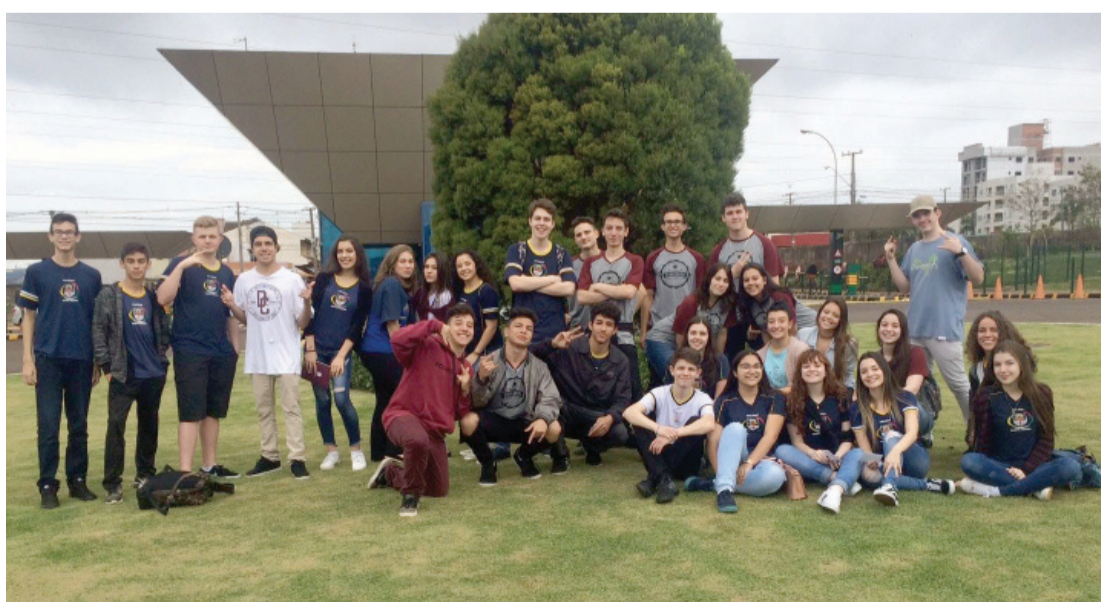
Alunos do ensino médio do Colégio Santa Maria conhecendo a FAG