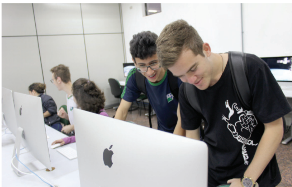
Alunos se encantaram com a estrutura dos cursos