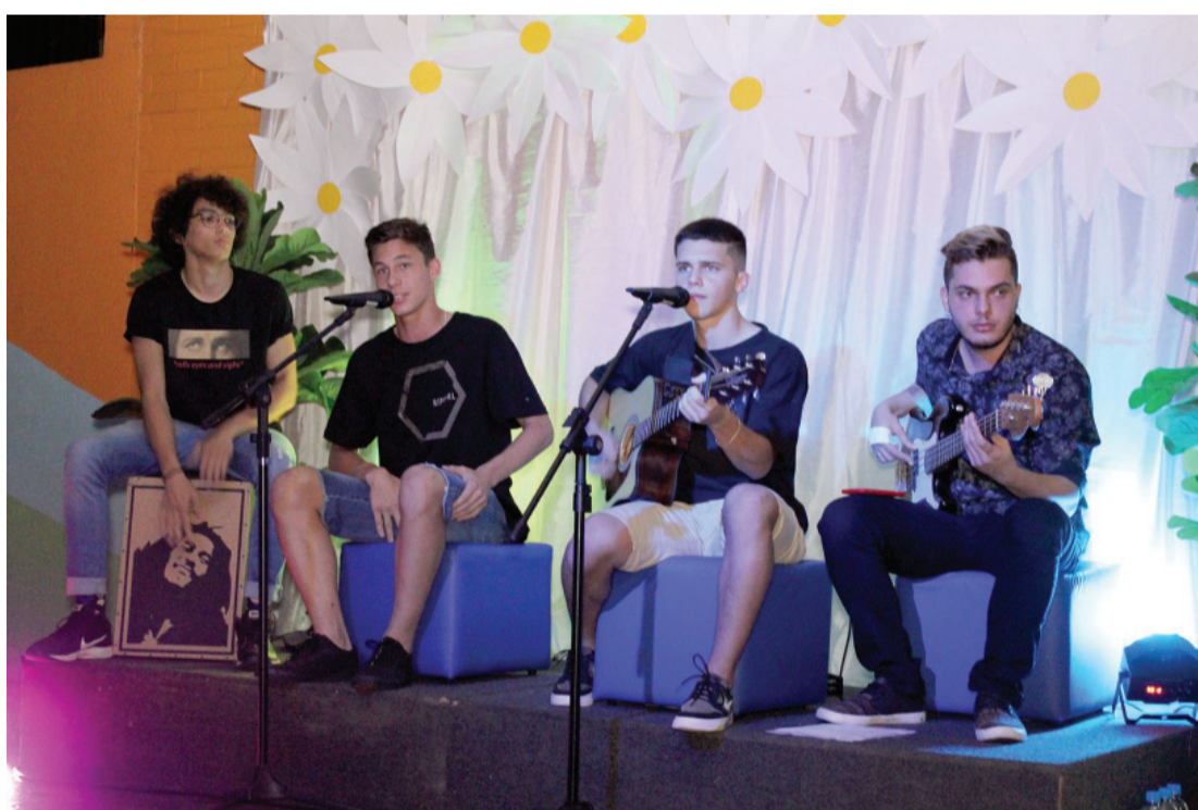
Abertura da 12ª edição dos Jogos da Rede ESI contou com apresentações culturais