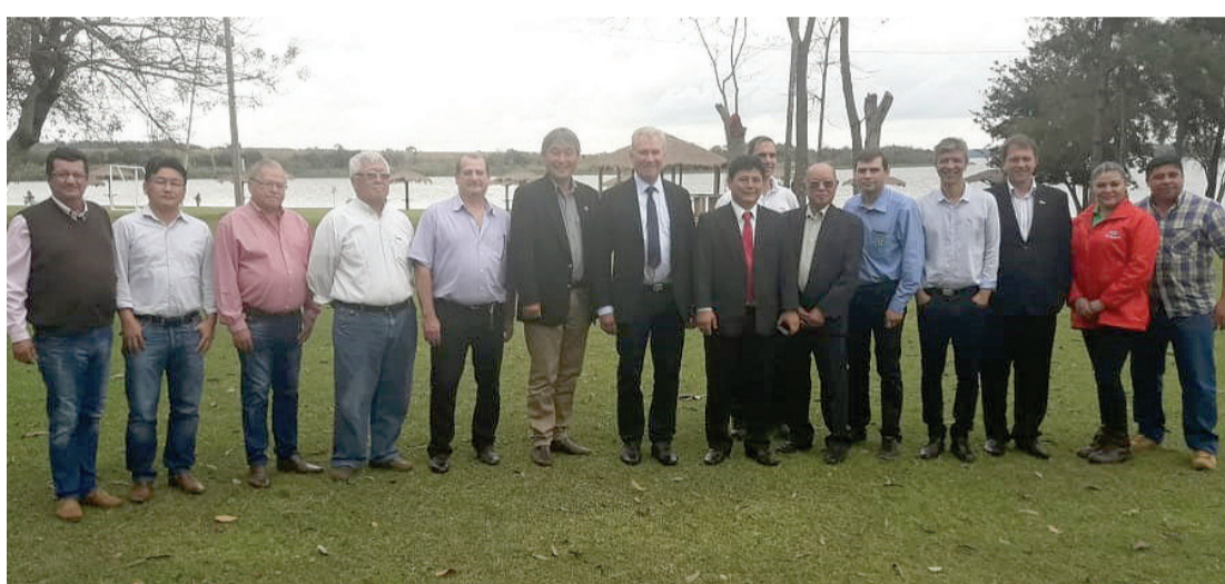
A Unioeste esteve com uma comitiva em Yguazú (Paraguai) para discutir cooperação em ações que visam ao desenvolvimento da aquicultura, pesca, benefício e fortalecimento da cadeia produtiva do pescado na Bacia do Lago Iguaçu

A Secretaria de Estado da Educação publicou três editais do PSS (Processo Seletivo Simplificado) com mais de 15 mil vagas para professores, professores pedagogos e tradutores e intérpretes de Libras (Língua Brasileira de Sinais), assistente administrativo, técnico agropecuário e florestal e auxiliar de serviços gerais. As inscrições podem ser feitas das 9h do dia 11 de outubro até 18h do dia 25 no endereço eletrônico www.pss.pr.gov.br .