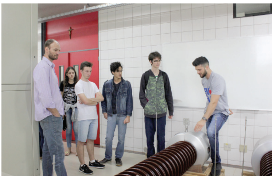
Setor das Engenharias chamou a atenção pela tecnologia