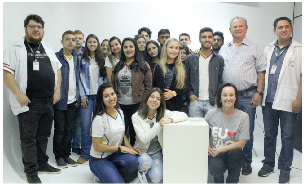
O reitor e a pró-reitora administrativa receberam os alunos