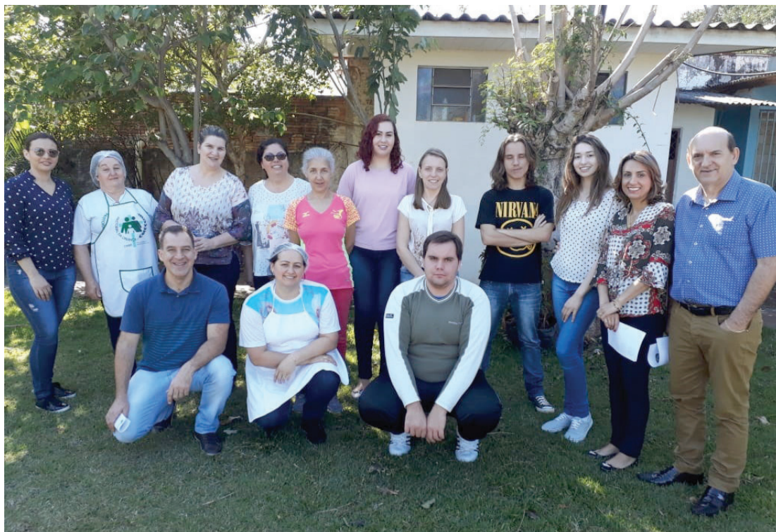
Equipe que atuou na organização da 9ª Jornada Acadêmica do Curso Técnico em Química e 8ª Jornada do Curso Técnico em Farmácia do Colégio Estadual Professor Victório Emanuel Abrozino em Cascavel