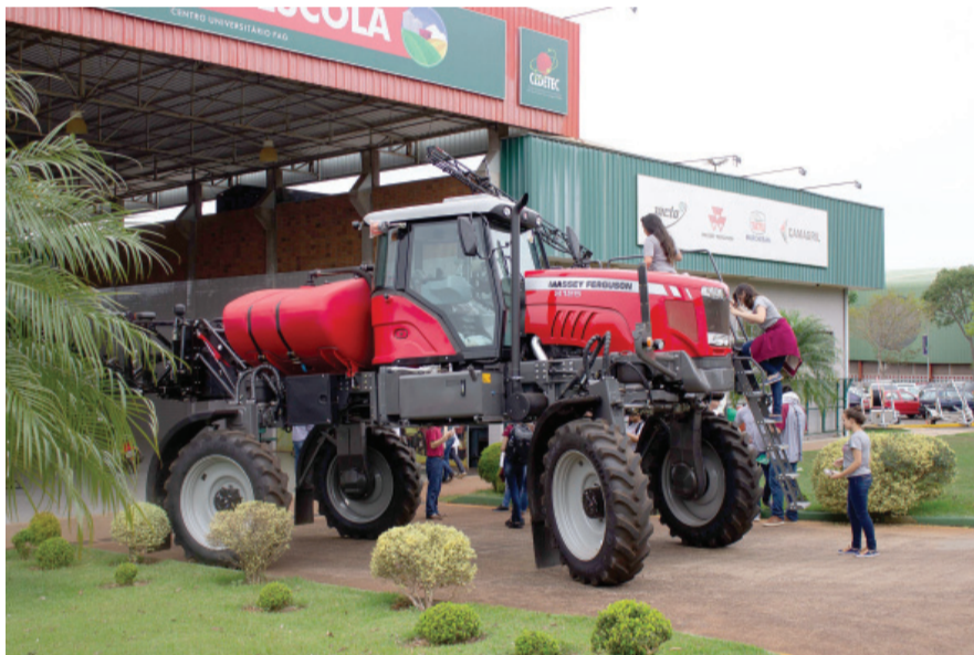
Os maquinários foram um dos setores preferidos dos alunos