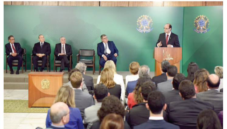
Evento que anunciou recursos foi realizado no Palácio do Planalto, em Brasília

PDDE – Entre quatro e cinco mil instituições de ensino médio vão receber R$ 400 milhões do PDDE para a implementação do Novo Ensino Médio, até 2020. A primeira parcela deste montante será paga ainda em 2018. O di-