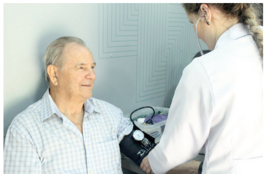
Reitor aproveitou para checar a saúde no ônibus