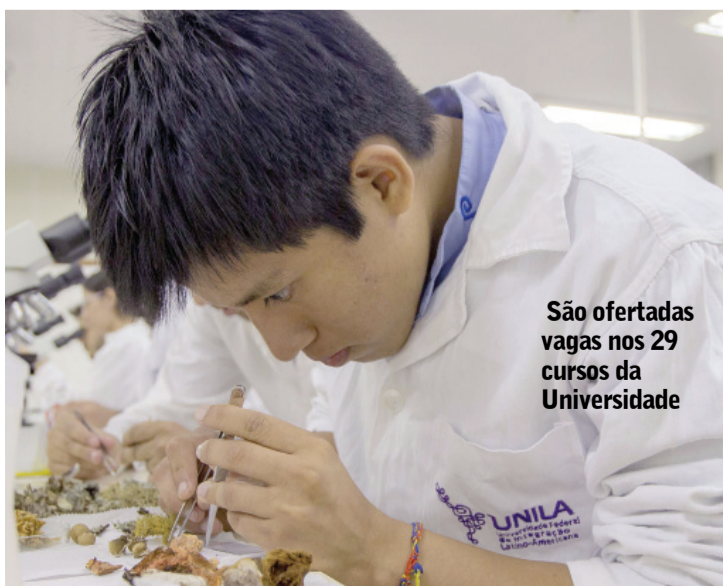
São ofertadas vagas nos 29 cursos da Universidade