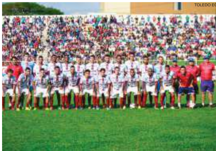
Toledo fez a festa da torcida em casa e agora quer comemorar em Curitiba

Já ao Furacão apenas a vitória interessa. Precisa vencer por ao menos um gol de diferença para levar a decisão aos pênaltis ou por dois ou mais gols para erguer o troféu estadual pela 25ª vez, a segunda consecutiva.