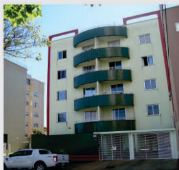
Apartamento semi-mobiliado localizado na Rua Salgado Filho, Centro. Imóvel com sala, cozinha, dois quartos e banheiro social. Valor de locação R$ 850,00 + condomínio. Valor de Venda R$ 200.000,00