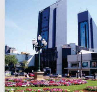
Sala comercial localizada na Av. Brasil no Central Park em Cascavel Imóvel com área de 35,17 m². Valor para locação R$ 570,00 + condomínio. Venda R$ 97.000,00