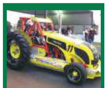
| Bandeirada 11