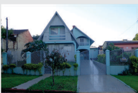
Xalé localizado na Rua Marumbi, 390. Imóvel com 02 Suítes com sacada; 01 Quarto com sacada; 01 Sala; 02 Cozinha; 01 Banheiro Social; 01 Lavanderia; 01 Edícula com 02 quartos, sala cozinha e banheiro; 02 vagas de garagem. Valor para venda R$370.000,00