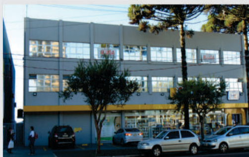
Sala comercial localizada na Avenida Brasil, esquina com a Rua Pio XII, 1º e 2º pavimentos disponíveis, sala com acessibilidade (elevador) e divisórias. Valor da locação a combinar.