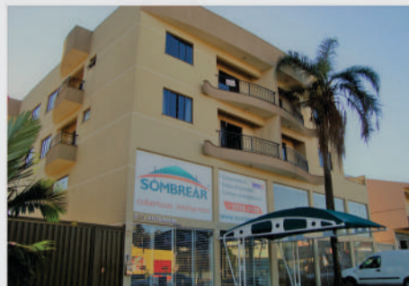
Apartamento localizado na Rua Pio XII, 1611. Imóvel com 2 Quartos (1 com sacada), sala com dois ambientes com sacada, Cozinha, área de serviço, despensa, 1 vaga de garagem. Valor para locação R$950,00