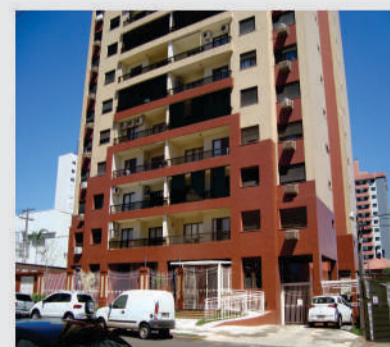
Apartamento localizado no Ed. Belvedere, Rua Presidente Bernardes no centro, 01 suite, 01 quarto mobiliado; sala com sacada; cozinha mobiliada; 02 vagas de garagem. Valor para locação R$ 1.320,00 + condomínio