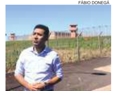
Visita do deputado ao presídio federal de Catanduvas nesta semana

“E outra, a gente só discute o sistema prisional quando acontece uma rebelião. Quando não se tem rebelião fica tudo quieto e este é um problema que precisa ser resolvido (...) o que não pode é continuar ouvindo que existem penitenciárias em obras e que nunca são inauguradas. Além da PEC, soube que existe uma estrutura em Piraquara que foi considerada modelo no estado e que está desativada. São questões que