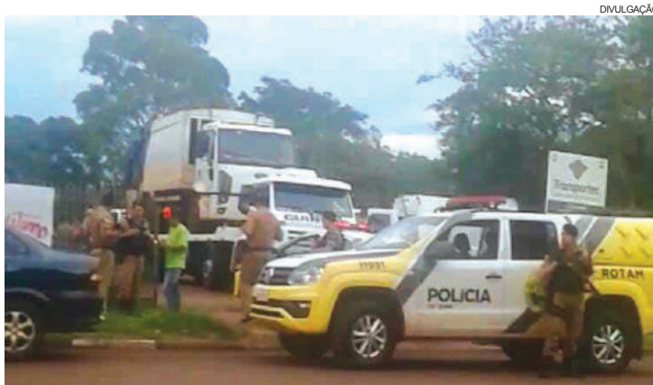
Segundo o Município, caminhões estavam sendo levados de Toledo para São Paulo

Agora, a Prefeitura de Toledo confirma o rompimento unilateral do contrato, mas não deixou claro se já estava programado para ocorrer ou se a decisão foi tomada após a tentativa de a coletora levantar acampamento.