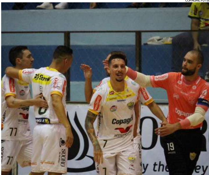
Marechal vem de goleada pouco tempo depois de elenco ter sofrido com virose

Além desses jogos, o Marechal acumula vitórias na temporada contra o próprio Cascavel (3 a 1) e também o Toledo (7 a 0), em jogos amistosos, e também contra Marreco (2 a 1), Campo Mourão (4 a 3), e Apaf/Paranaguá (4 a 2), pela Copa Paranaguá, a qual se sagrou campeão. No acumulado do ano, foram 37 gols marcados em nove jogos, média superior a quatro por partida.