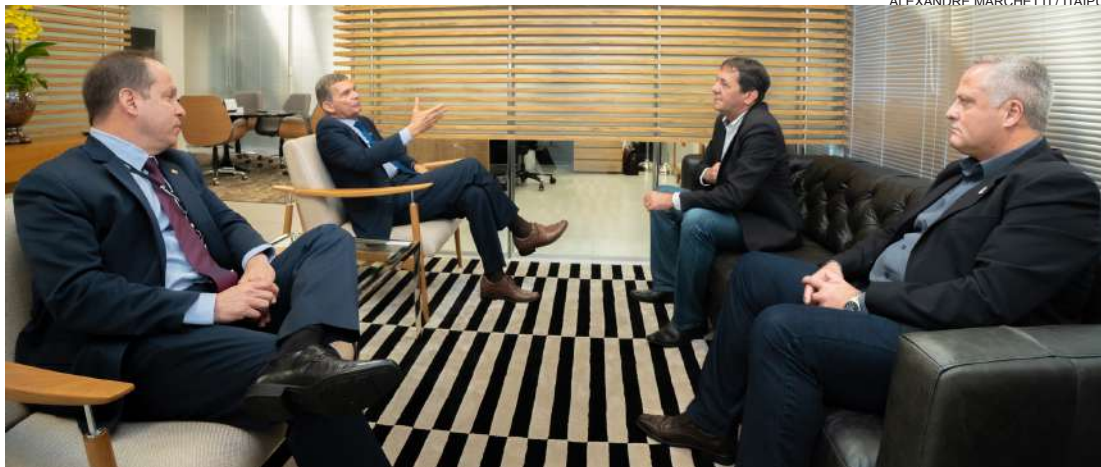
Joaquim Silva e Luna reforça que portas de Itaipu estão abertas

Foz do Iguaçu - Primeiro diretor-geral brasileiro de Itaipu Binacional a fixar residência em Foz do Iguaçu, no exercício do cargo, o general Joaquim Silva e Luna recebeu nessa quinta-feira (4) o prefeito do Município, Chico Brasileiro, e reafirmou a intenção da empresa de fortalecer a relação com os municípios da região oeste do Estado.