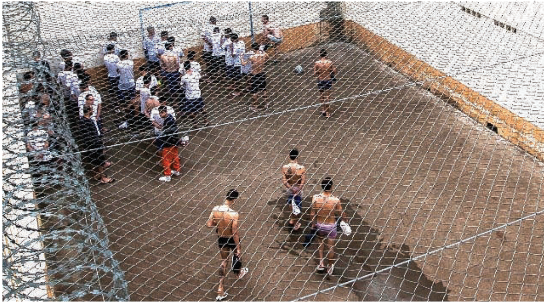
Sindarspen teme sobrecarga ainda maior de agentes

Cascavel - Depois de pedir a suspensão de transferências de presos para a para a PEC (Penitenciária Estadual de Cascavel) por conta da superlotação e número reduzido de agentes penitenciários, o Sindarspen (Sindicato dos Agentes Penitenciários do Paraná) protocolou novo documento no Depen (Departamento Penitenciário). O pedido agora tem relação com a proximidade do fim da obra de reconstrução do Bloco 3, destruído na rebelião de 2017.