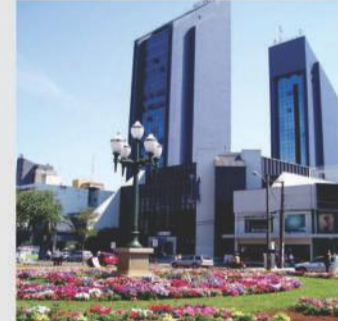
Sala comercial localizada na Av. Brasil no Central Park em Cascavel Imóvel com área de 35,17 m². Valor para locação R$ 570,00 + condomínio. Venda R$ 97.000,00