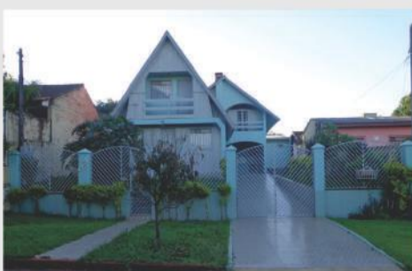
Kalé localizado na Rua Marumbi, 390. Imóvel com 02 Suítes com sacada; 01 Quarto com sacada; 01 Sala; 02 Cozinha; 01 Banheiro Social; 01 Lavanderia; 01 Edícula com 02 quartos, sala cozinha e banheiro; 02 vagas de garagem. Valor para venda R$370.000,00