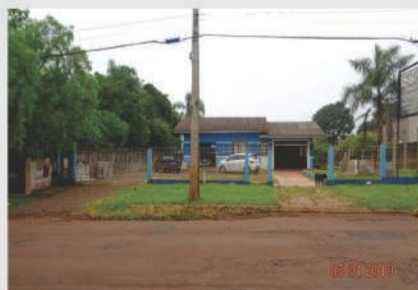
Casa com barracão localizados na Rua Rio da Paz, área construída da residência de 196 m² e barracão com 240 m². Valor para locação R$2.500,00.