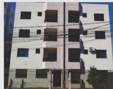
Apartamento para venda próximo a FAG, com 68 m². Imóvel com 1 sala, cozinha, 1 dormitório, 1 suíte, 1 banheiro social, 1 vaga de garagem coberta. R$220.000,00