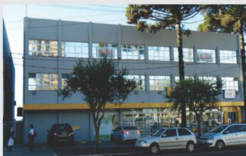
Sala comercial localizada na Avenida Brasil, esquina com a Rua Pio XII, 1º e 2º pavimentos disponíveis, sala com acessibilidade (elevador) e divisórias. Valor da locação a combinar.