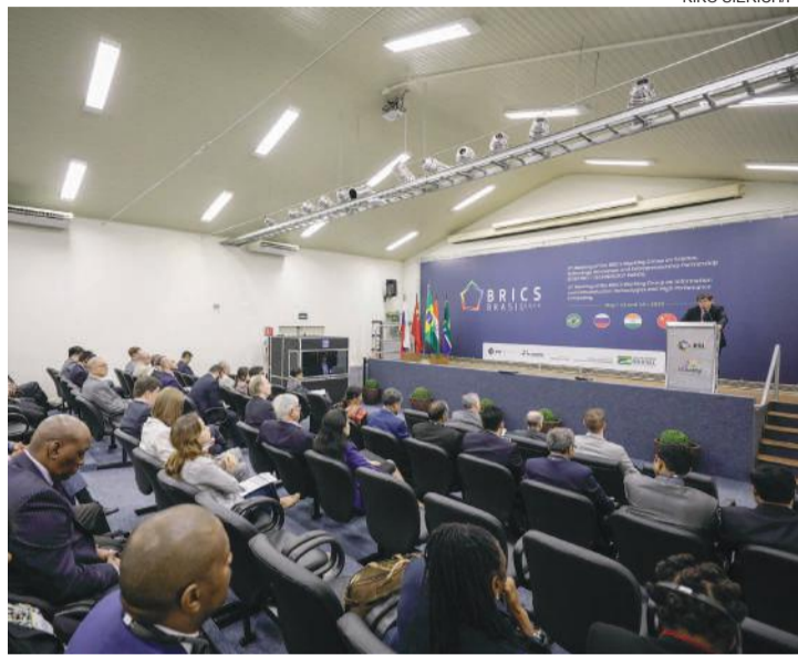
Evento segue até esta terça-feira com uma série de discussões de interesse dos países que compõem o bloco

Ontem os representantes dos Brics debateram a cooperação em transferência de tecnologia e as atividades do 4º Fórum de Jovens Cientistas dos Brics. Nesta terça-feira (14), o evento tem continuidade no PTI, quando será discutida a próxima reunião do Grupo de Trabalho sobre Parceria para Ciência, Tecnologia, Inovação e Empreendedorismo e os representantes dos países que compõem o bloco acompanharão uma apresentação sobre os projetos desenvolvidos no PTI. No período da tarde, o grupo fará uma visita técnica à Itaipu e à unidade de produção de biogás da usina.