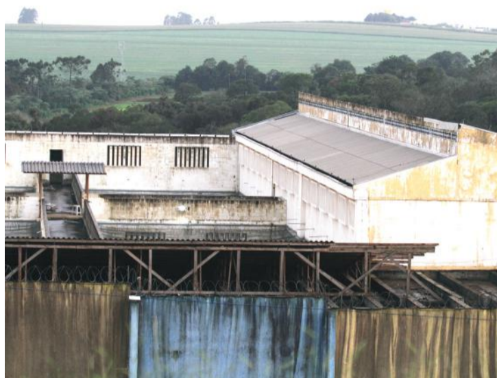
Expectativa é para que a PEC volte a contar com o bloco 3 em poucas semanas

Para assegurar que os encarcerados não escondessem