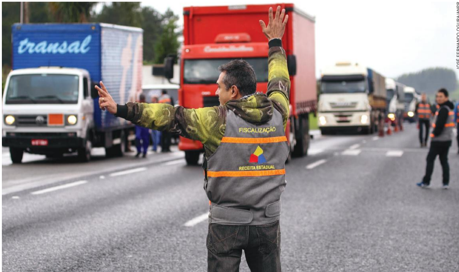
JOSE FERNANDO OGURA/ANPR