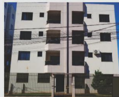
Apartamento para venda próximo a FAG, com 68 m². Imóvel com 1 sala, cozinha, 1 dormitório, 1 suite, 1 banheiro social, 1 vaga de garagem coberta. R$220.000,00