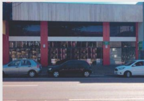
Sala comercial localizada na Av. Brasil, 7572. Imóvel com 640m², com mezanino em frente a praça do Migrante. Valor para locação R$ 12.500,00