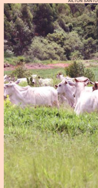
Trânsito de animais vindos de outros estados pode ser feito até setembro

O Paraná não cogita mais voltar a vacinar o rebanho: “Já tivemos o aval do Mapa para vacinarmos pela última vez em maio e