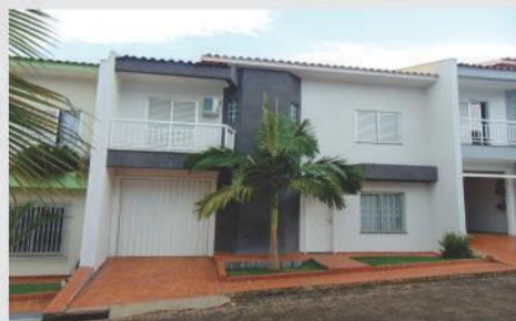
Sobrado mobiliado localizado na Rua Rodrigues Alves, 507 no Maria Luiza. 3 Suítes, 1 sala, cozinha, lavabo, área de serviço, 3 vagas de garagem. Valor para locação R$ 1.800,00 + condomínio.