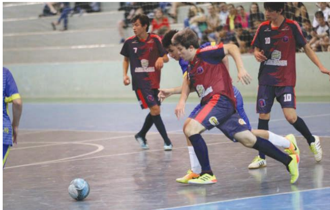
Futsal definirá os campeões nesta quarta-feira em Corbélia

Curitiba – Competição que movimentou alunos-atletas de 13 Núcleos Regionais de Educação desde a última sexta-feira, a fase regional da 66ª edição dos Jeps (Jogos Escolares do Paraná) definirá os últimos campeões da primeira parte da competição nesta quarta-feira.