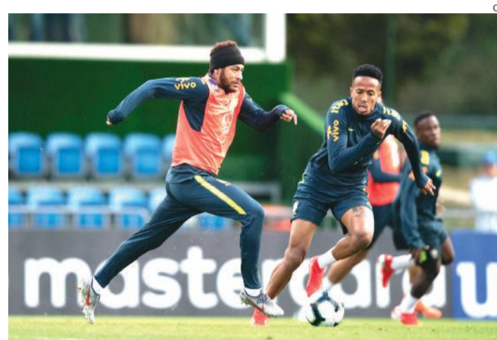
Neymar tentou se concentrar para o jogo de hoje em meio à polêmica extracampo