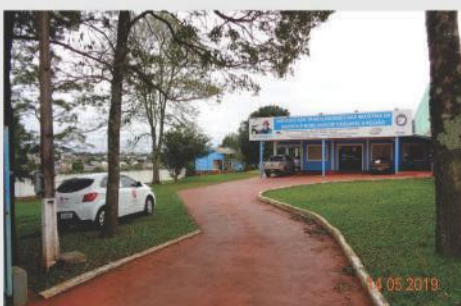
Área própria para associação ou construção de condomínio com 4.433m² localizado no bairro Alto Alegre atrás do Fórum. Valor para venda R$1.500.000,00