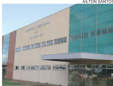
Hospital Regional está fechado há três anos

O Ministério Público investiga ainda em uma terceira frente o possível desaparecimento de aparelhos e equipamentos novos que estavam no Hospital Regional, mas que teriam desaparecido antes de serem descaixotados. Além do possível sumiço em investigação, com possíveis responsabilizações criminais, boa parte dos utensílios que segue na estrutura já perdeu a garantia por estar ali por muito tempo e sem uso.