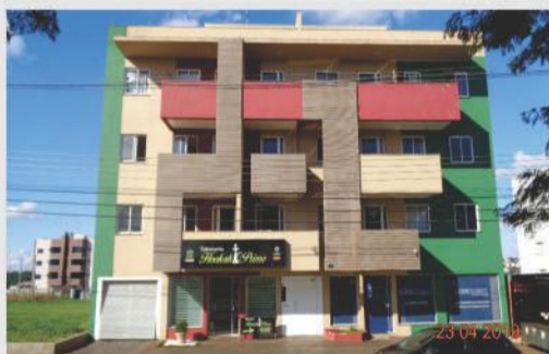
Apartamento localizado na Av. da FAG, Imóvel com sala e cozinha integrados, 1 dormitório, 1 banheiro social, 1 vaga de garagem. Valor para venda R$ 97.000,00