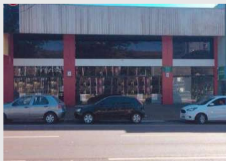
Sala comercial localizada na Av. Brasil, 7572. Imóvel com 640m², com mezanino em frente a praça do Migrante. Valor para locação R$ 12.500,00