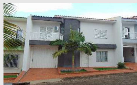
Sobrado mobiliado localizado na Rua Rodrigues Alves, 507 no Maria Luiza. 3 Suítes, 1 sala, cozinha, lavabo, área de serviço, 3 vagas de garagem. Valor para locação R$ 1.800,00 + condomínio.