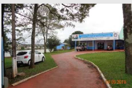
Área própria para associação ou construção de condomínio com 4.433m² localizado no bairro Alto Alegre atrás do Fórum. Valor para venda R$1.500.000,00