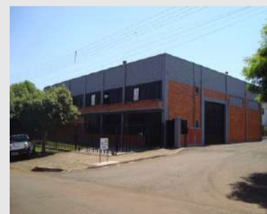
Barracão localizado no Núcleo Industrial III (saída para Toledo), com aproximadamente 543 m². Imóvel com recepção, sala administrativa, refeitório com churrasqueira, banheiro com vestiário. Valor para locação R$5.000,00