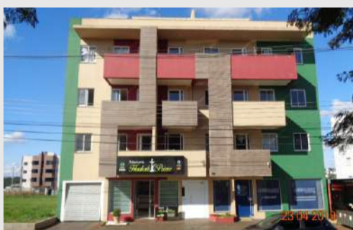
Apartamento localizado na Av. da FAG, Imóvel com sala e cozinha integrados, 1 dormitório, 1 banheiro social, 1 vaga de garagem. Valor para venda R$ 97.000,00