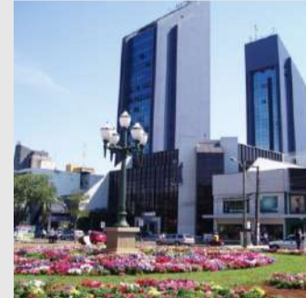
Sala comercial localizada na Av. Brasil no Central Park em Cascavel Imóvel com área de 35,17 m². Valor para locação R$ 470,00 + condomínio. Venda R$ 97.000,00