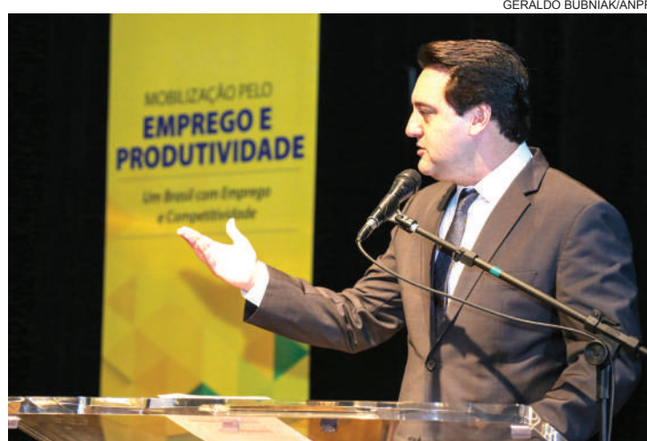
Ratinho apresentou ações do Estado que darão sustentação a novos empregos

O governo do Estado desenvolve três novos programas para seguir na escalada da abertura de postos de trabalho. O Paraná mais Empregos quer levar oportunidades para as 50 cidades com menor IDH (Índice de Desenvolvimento Humano). Nesses municípios haverá