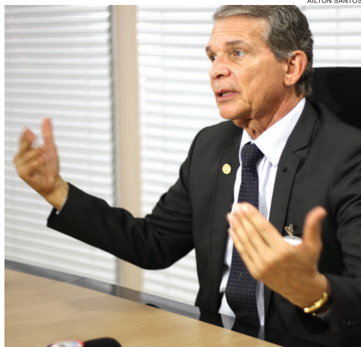
Silva e Luna atendeu a reportagem do Jornal O Paraná

Ainda sobre as medidas de contenção de gastos, ele afirma que a ideia é auxiliar