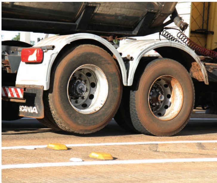
Veículos carregados que passam com eixo suspenso estão sujeitos a multa

Além de oferecer risco aos outros motoristas, medida pode onerar o bolso de outros condutores na hora da composição da tarifa