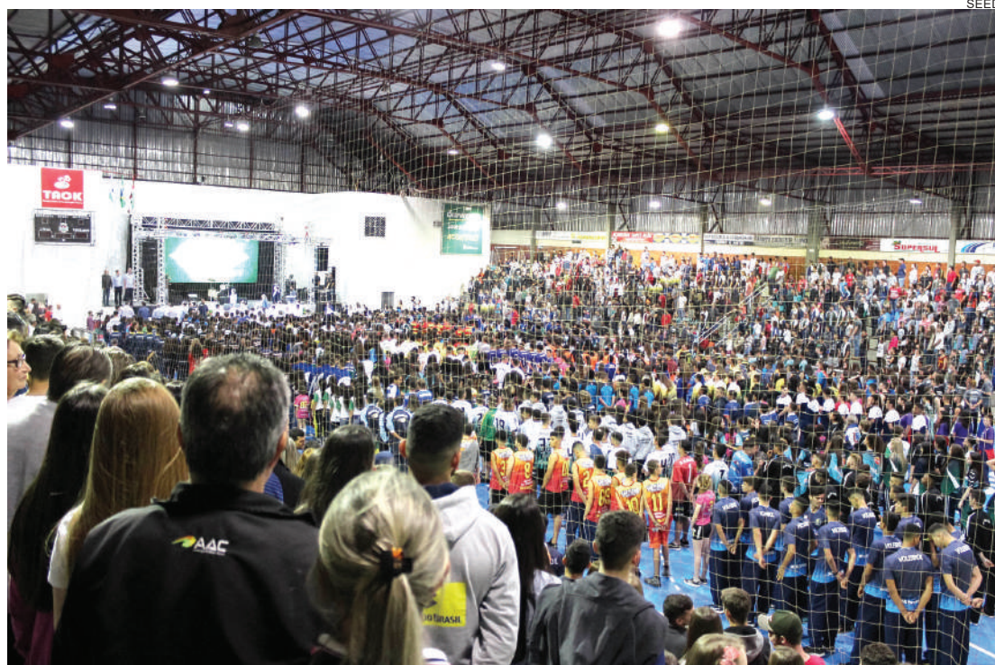
Segunda etapa regional dos JEPs começa hoje

Curitiba - Começa nesta sexta-feira (14) a segunda etapa da fase regional da 66ª edição dos JEPs (Jogos Escolares do Paraná) nas categorias 15 a 17 anos e 12 a 14 anos.