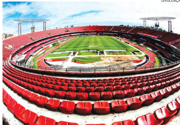
Morumbi está pronto para a abertura da Copa América

O atual campeão é o Chile. O último título do Brasil foi em 2007, na Argentina. O Brasil ganhou todas as vezes que foi sede.