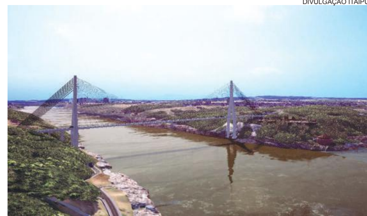
Início das obras da Ponte da Integração está previsto para esta semana

A ação do Departamento do Trabalho atende determinação do secretário de colocar em prática um formato proativo de captação de vagas a serem intermediadas pelas Agências do Trabalha-