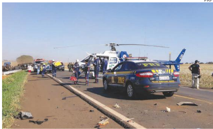
Com o impacto, a carreta tombou; partes do outro veículo ficaram espalhadas na pista

Já o condutor da Fiorino foi socorrido com lesões graves e foi levado a um hospi-