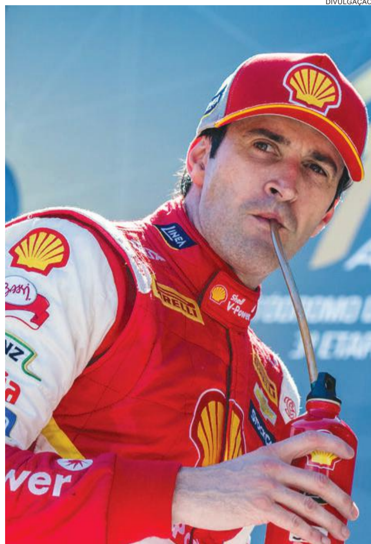
O paranaense Ricardo Zonta venceu a Corrida do Milhão em 2013

Até a disputa da Corrida do Milhão, a Stock Car ainda vai realizar duas etapas. A próxima será dia 21 de julho, em Santa Cruz do Sul (RS), seguida pela etapa de Campo Grande (MS), em 11 de agosto. Ao todo, a Stock Car fará 12 eventos em 2019 - dos quais quatro já foram realizados.