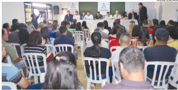
Em assembleia domingo, trabalhadores deram mais tempo às cooperativas

Eles são funcionários de C.Vale (Palotina), Copagril