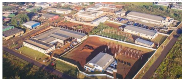
Distrito Industrial do Morumbi terá infraestrutura completa de saneamento

Foz do Iguaçu - A Sanepar já assentou mais de 2,27 quilômetros de rede de esgoto na região do Distrito Industrial do Morumbi em Foz do Iguaçu. Com isso, 25% da obra prevista para a região já foi executada.