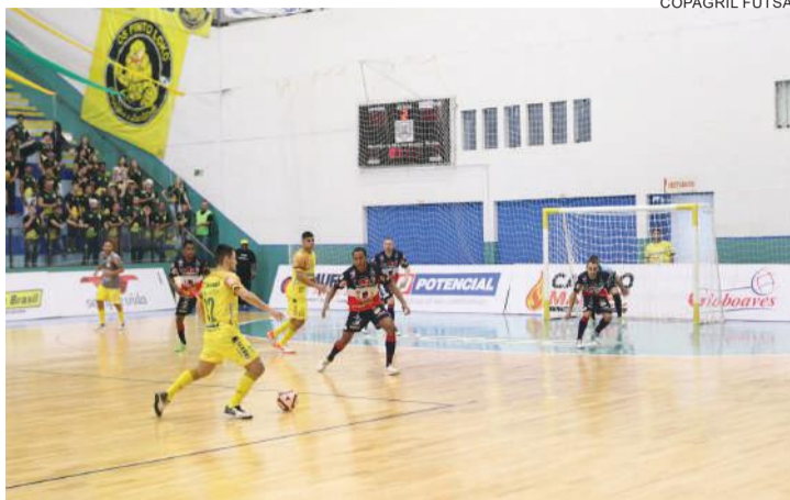
Marechal vem de derrota na Liga, mas está embalado no Paranaense

Já o Dois Vizinhos não ostenta tantos jogos de invencibilidade, mas se apega a uma estatística como mandante para tentar vencer o Marechal. O time do Sudoeste já levou a melhor sobre dois dos representantes da Liga no Teodorico Guimarães. A última vitória foi há duas semanas, por 3 a 2, sobre o Campo