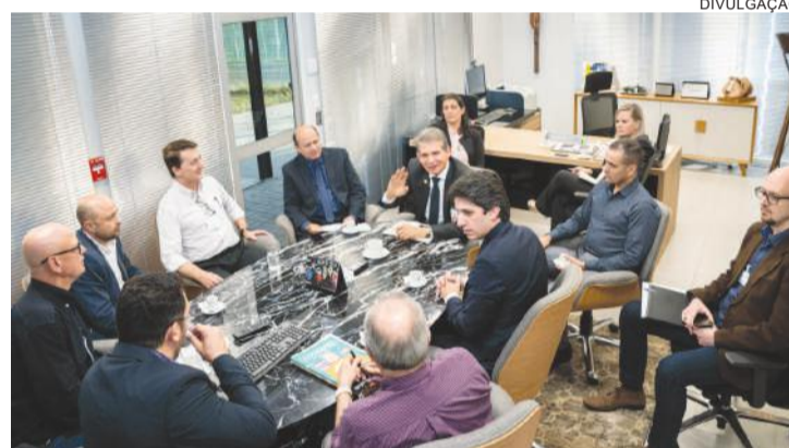
Encontro de líderes discute projeto de novo traçado de trilhos no oeste

De acordo com o secretário Valdemar Bernardo Jorge, o governo do Estado vem trabalhando para viabilizar a elaboração do projeto executivo da obra, tornando possível realizar um forte trabalho de atração de investidores. "O projeto da ferrovia está entre as principais prioridades do governador Ratinho Júnior e o trabalho conjunto entre o setor produtivo, o governo do Estado e a Itaipu poderá garantir maior