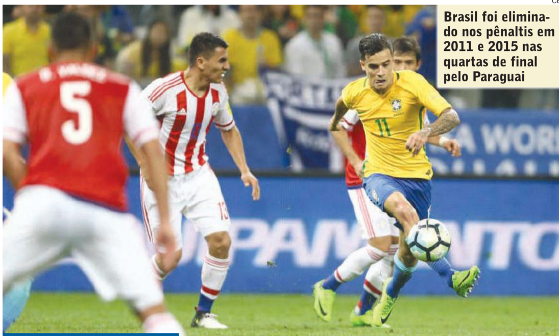
Brasil foi eliminado nos pênaltis em 2011 e 2015 nas quartas de final pelo Paraguai

Copa América vão dar ao Brasil a oportunidade de uma revanche dupla. Depois de ser eliminada pelo Paraguai nos pênaltis em 2011 e 2015 nesta mesma fase em que as equipes se enfrentarão amanhã, a seleção brasileira pode espantar esses fantasmas e voltar a disputar uma semifinal do torneio depois de 12 anos. Quando se trata de Copa América, o Paraguai é um adversário complicado para o Brasil. Em 12 encontros, foram cinco vitórias brasileiras, duas paraguaias e outros cinco empates. Mas entre esses jogos que terminaram empatados, alguns na verdade significaram resultados positivos para o time guarani, como nos dois últimos duelos, nas duas quartas de final de 2011 e 2015. Em ambas houve empate no tempo normal, mas vitória paraguai nos pênaltis.