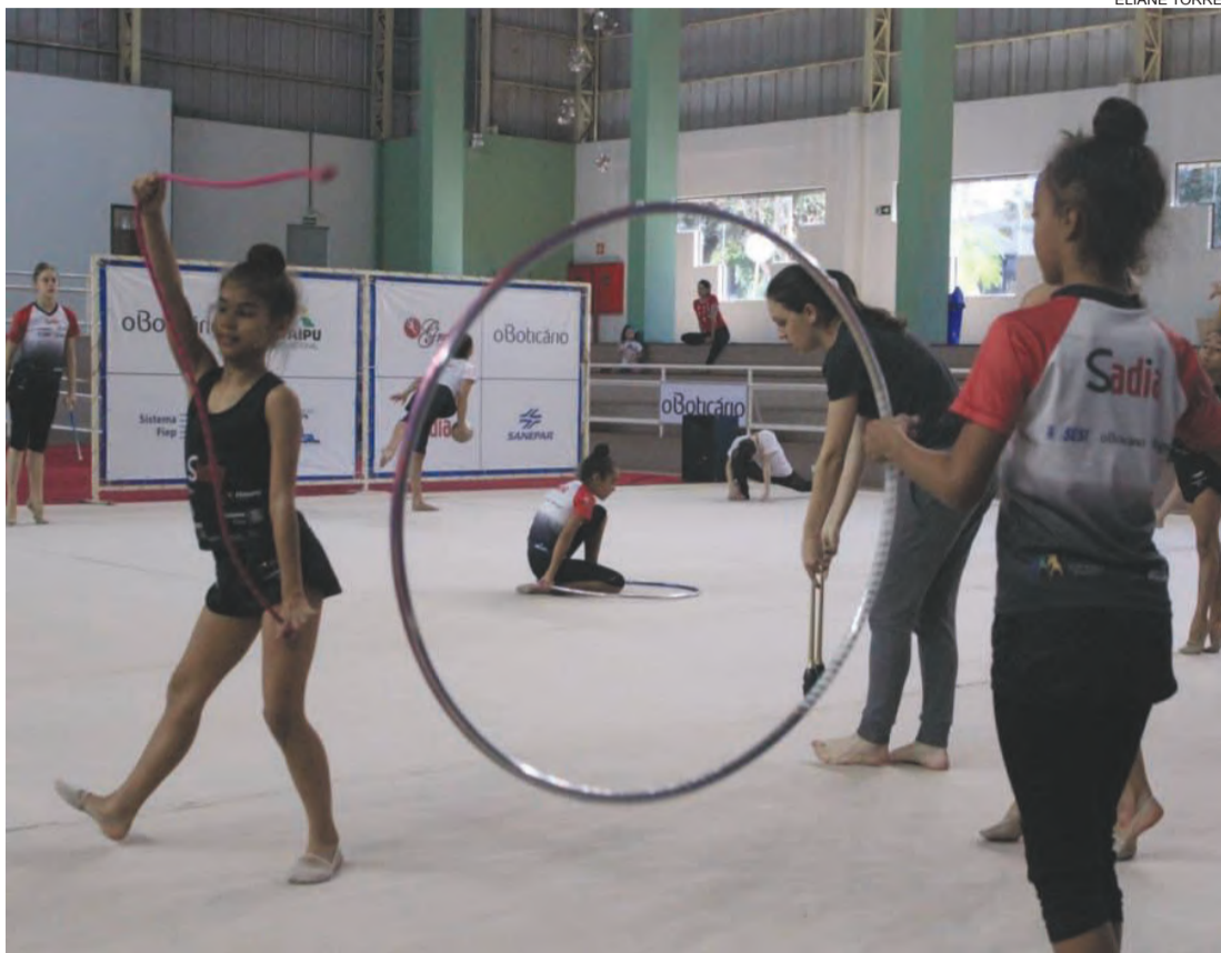
Ginastas toledanas em treinamento antes do embarque para o Rio de Janeiro

O palco do torneio será na Arena Carioca 3, que compõe o Parque Olímpico da Barra da Tijuca. Nada mais apropriado para a modalidade, pois foi neste mesmo local que a seleção brasileira de Conjunto conquistou o 9º lugar geral nas Olimpíadas Rio 2016.