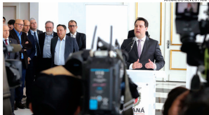
Governador anunciou a proposta por meio de uma coletiva à imprensa

Após vários estudos, técnicos do governo conseguiram alcançar o índice anunciado. Segundo Ratinho Junior, essa foi a forma para proteger as contas públicas e não ultrapassar os limites impostos pela Lei de Responsabilidade Fiscal para o gasto com pessoal. Em declaração à imprensa, o governador afirmou que o governo chegou ao "limite do possível" e reforçou que a