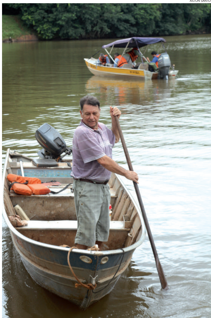
Na região, expectativa é para que publicação auxilie pescadores que enfrentam problemas

O cadastro é necessário para que o pescador tenha acesso à carteira de pes-