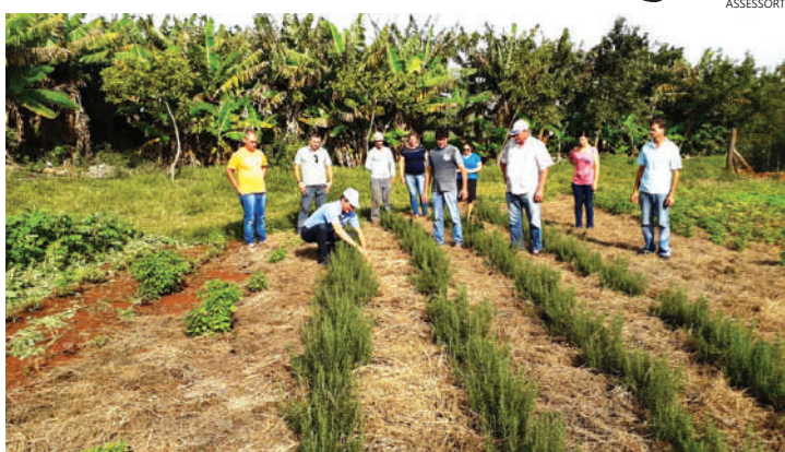
Produtores receberam orientação técnica para desenvolver atividades ligadas à olericultura

A produção própria de mudas de olerículas em bandejas, em pequena estufa, com melhores resultados e redução dos custos de produção foi outro ponto destacado. "Todos os insumos naturais gerados pela própria natureza propiciaram sanidade para as plantas e para o próprio ecossistema dando isenção ou quase na totalidade, de pragas e doenças e gerando um alimento saudável e