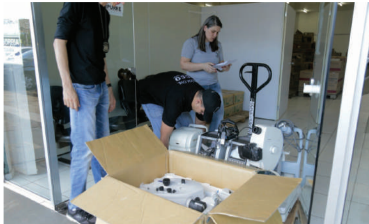
Equipamentos haviam sumido durante mutirão há quatro anos

Os equipamentos passarão por uma avaliação técnica e posteriormente serão destinados ao CEM (Centro de Especialidades Médicas). O espaço passa por reformas e será entregue no próximo ano à população. “Essa é uma ação muito importante da Polícia Civil. Com a recuperação desses equipamentos, teremos condições de preparar uma sala de diagnóstico, por exemplo, para os novos profissionais de oftalmologia que serão contratados para atender a demanda existente na cidade”, adianta o secretário.