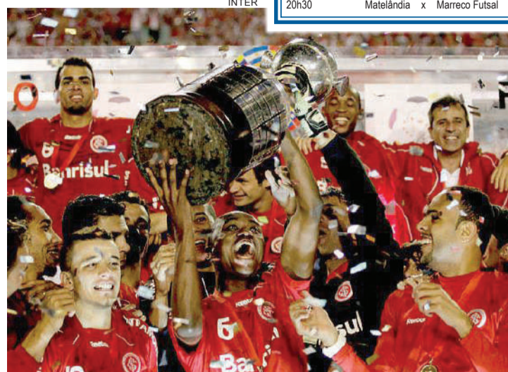
Inter que conquistar a América novamente

Libertadores e vai precisar lidar com nada menos que quatro desfalques. Vitinho e Everton Ribeiro foram vetados pelo Departamento Médico. O uruguaio Arrascaeta também já vinha lesio-