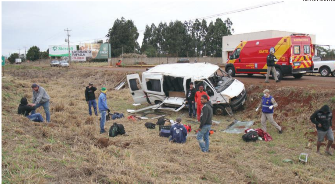
Veículo ficou bastante destruído

Cascavel - Três homens ficaram feridos após a van em que estavam capotar na BR-467, em Sede Alvorada, distrito de Cascavel. O veículo transportava 11 trabalhadores da construção civil que saíram de Assis Chateaubriand e se dirigiam para Cascavel.