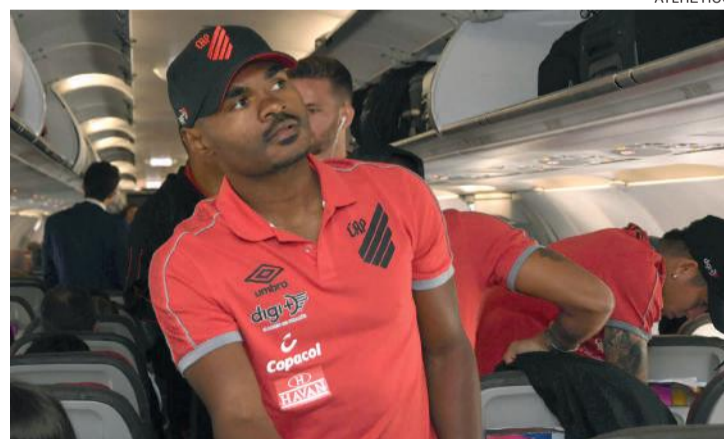
Delegação atleticana chega ao Japão neste sábado, pelo horário brasileiro

Os dois voos chegarão em solo europeu na manhã deste sábado (3), no horário de Brasília. Depois de uma rápida