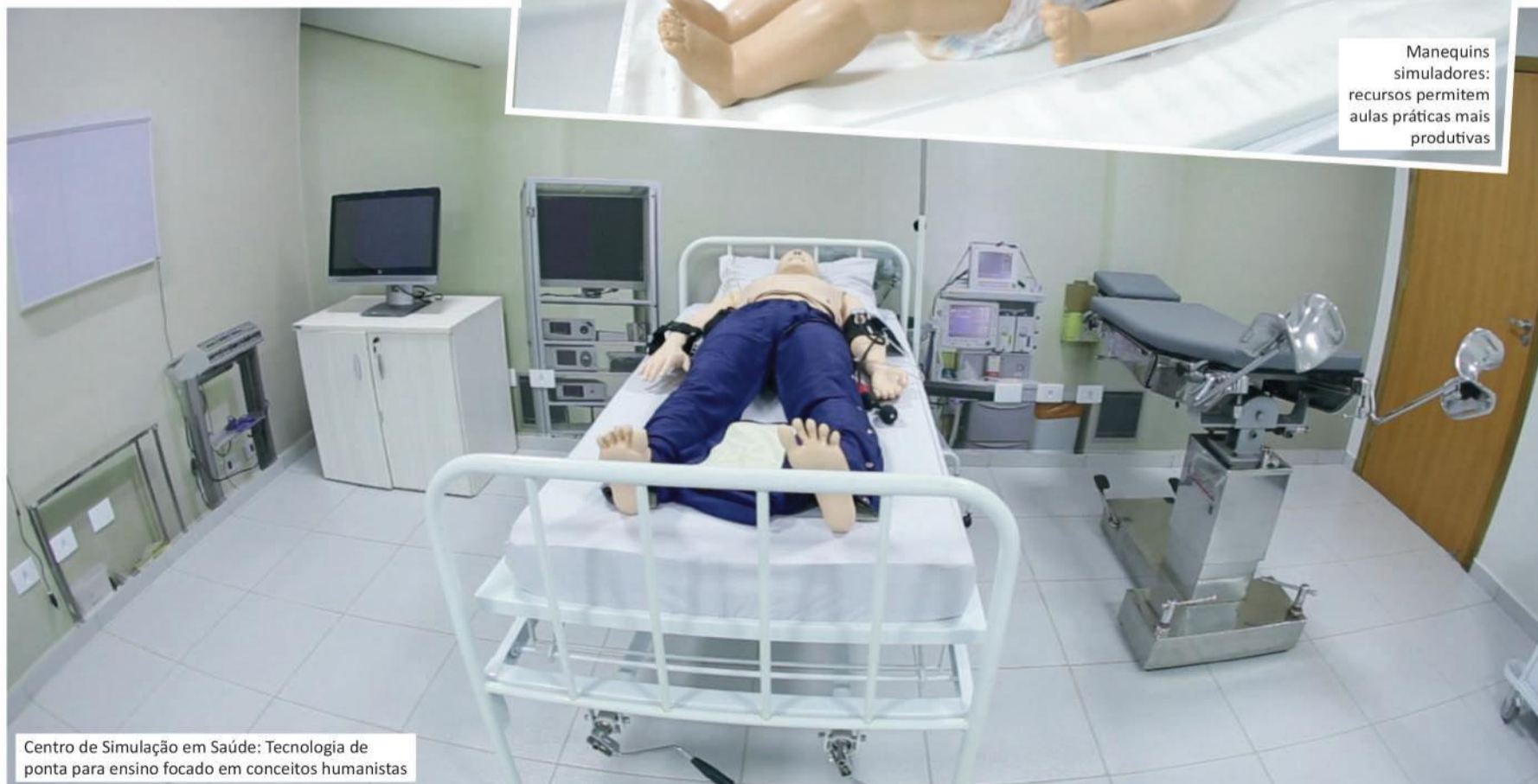
Centro de Simulação em Saúde: Tecnologia de ponta para ensino focado em conceitos humanistas

Vestibular MEDICINA UNIPAR • Programe-se. Período de inscrição: de 23/07 a 13/09 – Prova: 29/09