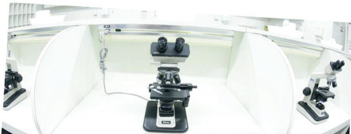
Mais de vinte laboratórios para aulas práticas, em várias áreas das Ciências da Saúde

No comando de tudo isso está uma equipe de professores competente e atenciosa. Por tradição, a Universidade Paranaense seleciona para seu corpo docente profissionais altamente qualificados, critério decisivo para continuar inserida no time das instituições com padrões acadêmicos de excelência.