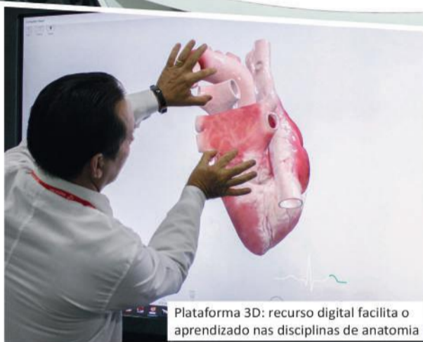
Plataforma 3D: recurso digital facilita o aprendizado nas disciplinas de anatomia