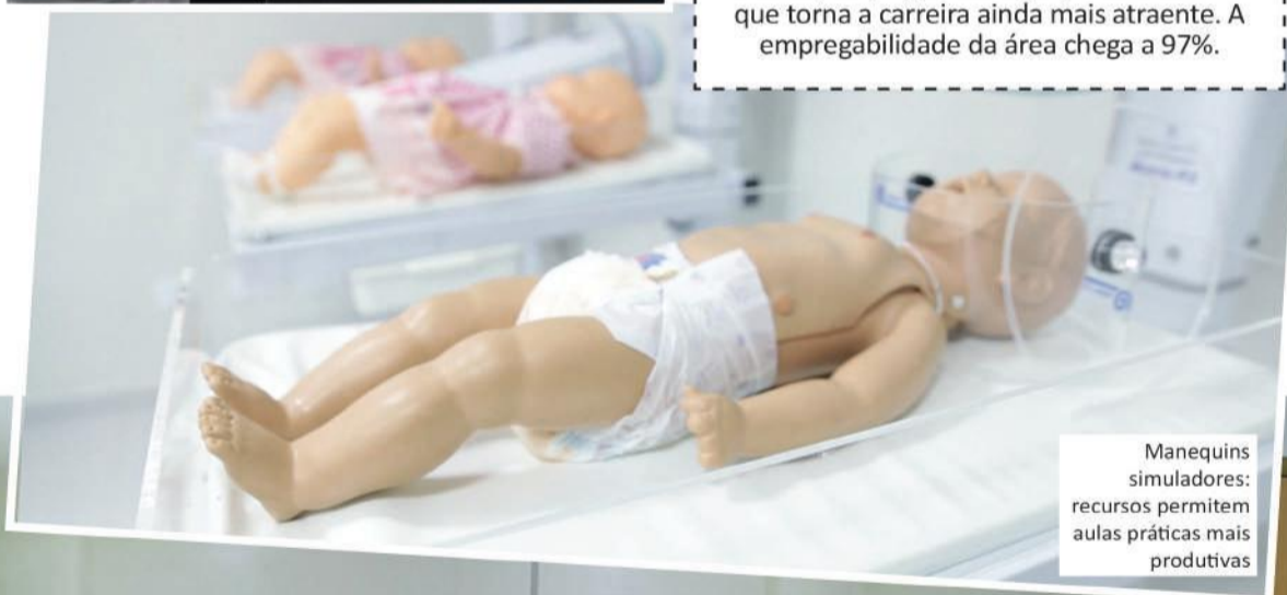
Manequins simuladores: recursos permitem aulas práticas mais produtivas

O curso de graduação em Medicina da Universidade Paranaense tem por objetivo específico formar médicos generalistas, para atender uma demanda bastante diversificada. Existem boas oportunidades de emprego em empresas como hospitais, clínicas, clubes, centros de pesquisa ou no serviço público, além da opção que o médico tem de montar seu próprio consultório. Segundo pesquisas, o mercado de trabalho está aquecido. Números do IPEA (Instituto de Pesquisa Econômica Aplicada) mostram que Medicina ocupa o primeiro lugar entre as 48 melhores profissões de nível superior analisadas pelo estudo. É campeã em quesitos como salário, empregabilidade e previdência – o que torna a carreira ainda mais atrativa. A empregabilidade da área chega a 97%.