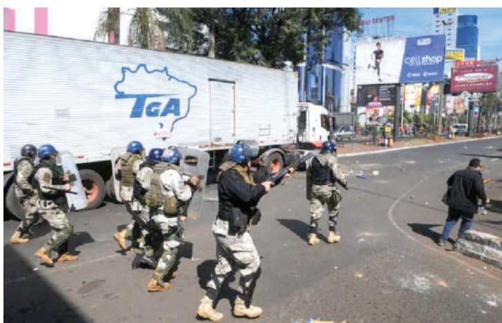
Confronto entre manifestantes e policiais em Cidade do Leste

JULHO DOURADO DURANTE O MÊS DE JULHO, A ADMINISTRAÇÃO MUNICIPAL DE TRÊS BARRAS DO PARANÁ DESENVOLVEU E APOIOU AÇÕES EM ALUSÃO AO JULHO DOURADO, MÊS DE CONSCIENTIZAÇÃO CONTRA O ABANDONO DE ANIMAIS.