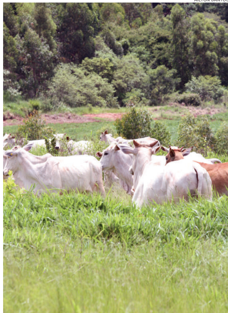
Norma que torna Estado livre da vacinação deve ser publicada em setembro