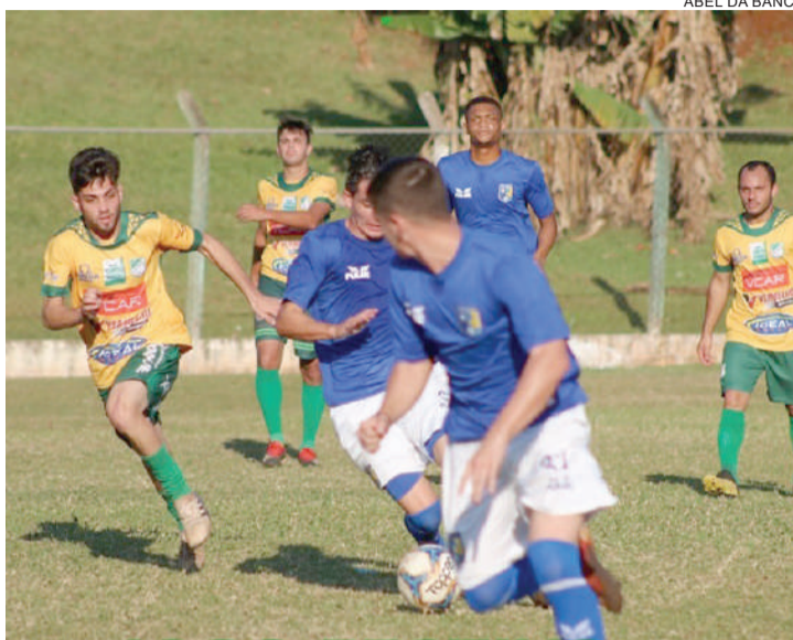
Foz voltou de São José dos Pinhais com um ponto na bagagem, mesmo com dois jogadores a menos em campo