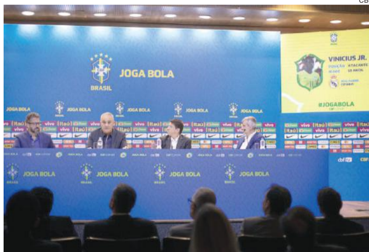
Tite chamou sete novidades em relação à lista da Copa América

Nesse mesmo contexto está o lateral-esquerdo da