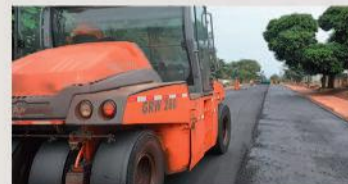
Mais de R$ 30 milhões aplicados em recapes e pavimentação de ruas em mais de 10 bairros