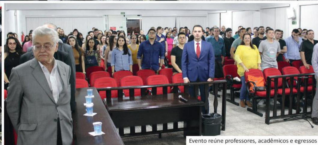
Evento reúne professores, acadêmicos e egressos