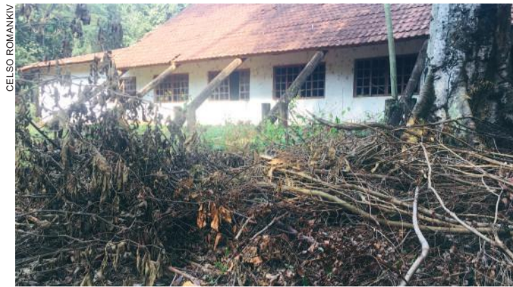
Abandonado, local vira motivo de desespero de moradores

Uma das moradoras disse que a casa está abandonada há mais de cinco anos e que várias vezes foi à prefeitura pedir providências, mas que