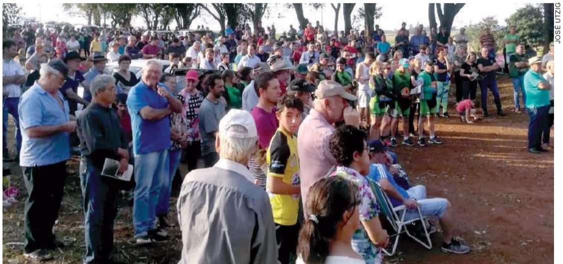
População de Serranópolis do Iguaçu foi às ruas pedir a reabertura da estrada

A grande participação popular nas duas audiências públicas em prol da reabertura da Estrada do Colono deu mais força ao projeto, o que pode acelerar um sonho de quase duas décadas: ver novamente o caminho de 17,5 km que liga o oeste ao sudoeste do Paraná. A comissão vai agora buscar o apoio da bancada paranaense no Congresso e não descarta um contato direto com o presidente Jair Bolsonaro, que já se manifestou favorável à reabertura. O projeto prevê uma estrada-parque, com restrição de horários e de veículos. Oeste 8