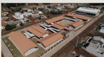
Destinação de R$ 3.261 milhões para a construção da escola do Jardim Mônaco