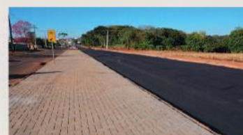
Duplicação da Avenida Industrial: investimento de R$ 1,284 milhão