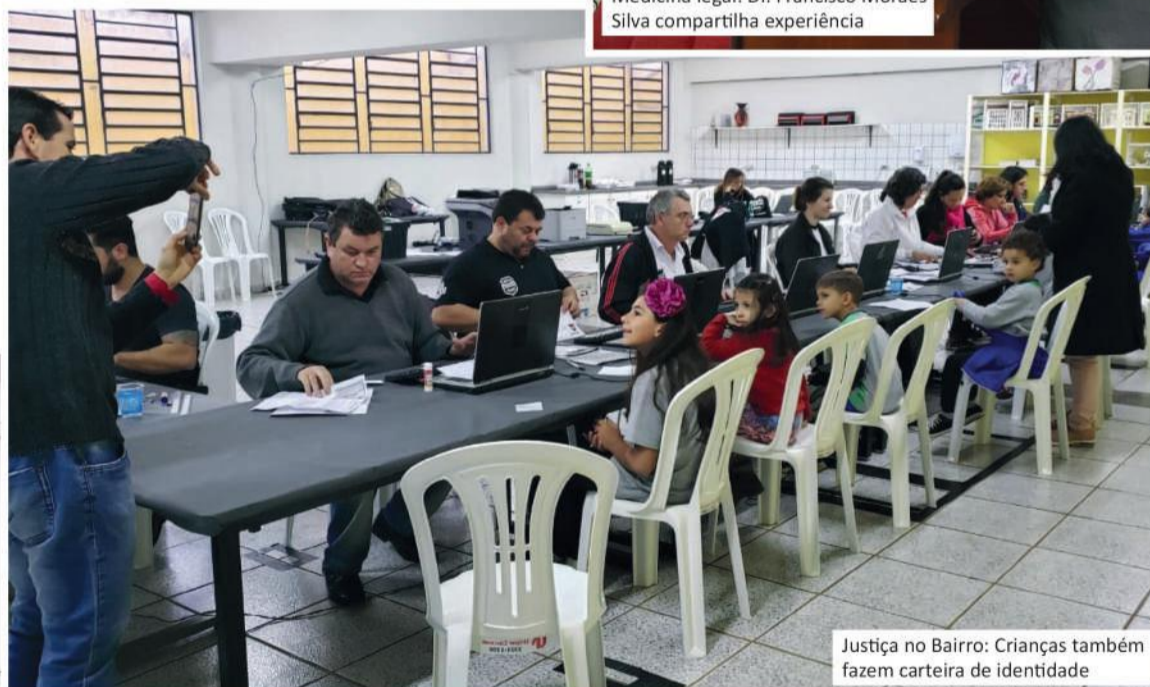
Justiça no Bairro: Crianças também fazem carteira de identidade