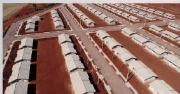
Residencial Moacir Micheletto: R$ 15 milhões para a construção de 200 casas populares

A garra da nossa gente, presente desde o início da nossa colonização, tem escrito, ao longo de 53 anos, páginas repletas de conquistas. Os recentes investimentos do governo municipal em várias áreas nada mais são que um justo reconhecimento aos protagonistas desta história de trabalho e sucesso: o cidadão chateaubriandense. Vamos mostrar alguns investimentos.