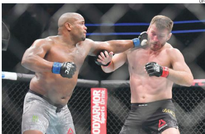
Cormier tirou o cinturão dos pesados de Miocic em julho de 2018

A conquista da vaga para os Jogos Olímpicos Tóquio 2020 era o principal objetivo da temporada 2019. Como objetivo alcançado após a vitória sobre a Bulgária, no último domingo, a seleção brasileira masculina de vôlei ganhou folga até esta segunda-feira (19), quando se reapresenta no CT de Saquarema (RJ), visando aos próximos compromissos do ano. O time dirigido por Renan Dal Zotto ainda tem pela frente as disputas do Sul-americano, de 10 a 14 de setembro, no Chile, e a Copa do Mundo, de 1º a 15 de outubro, no Japão. Antes disso, a equipe fará quatro amistosos contra a Argentina, sendo dois fora de casa e outros dois em Campinas (SP), estes últimos nos dias 30 e 31 de agosto.