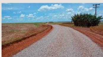
Melhorias em quase 200 km de estradas rurais somente neste ano