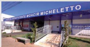
Reforma/ampliação do Hospital Beneficente Moacir Micheletto: R$ 7,2 milhões investidos