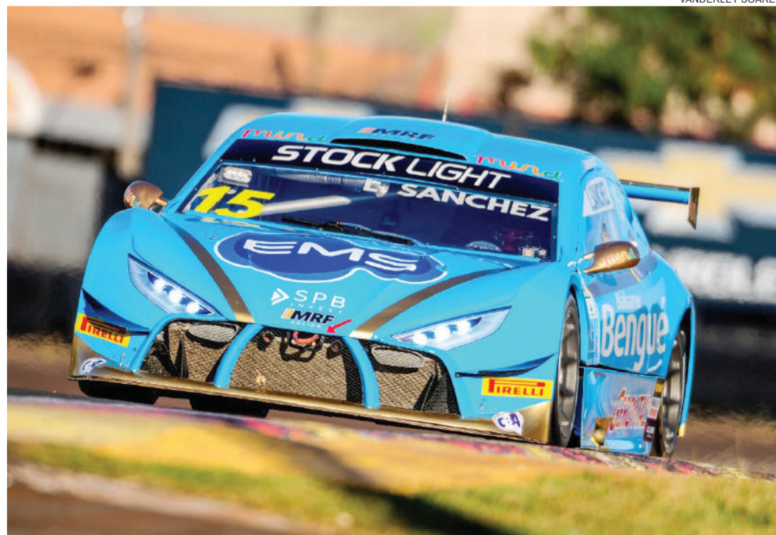
Leonardo Sanchez marcou pontos em todas as provas da Stock Light na atual temporada