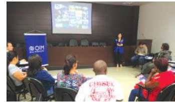
Envolvimento da sociedade civil e poder público dará origem a banco de dados sobre migrantes

"Observamos que existe um fluxo migratório considerável em muitas cidades do Estado, então precisamos descentralizar as ações, oportunizando as capacitações a mais pessoas por todo o Paraná", sugere.