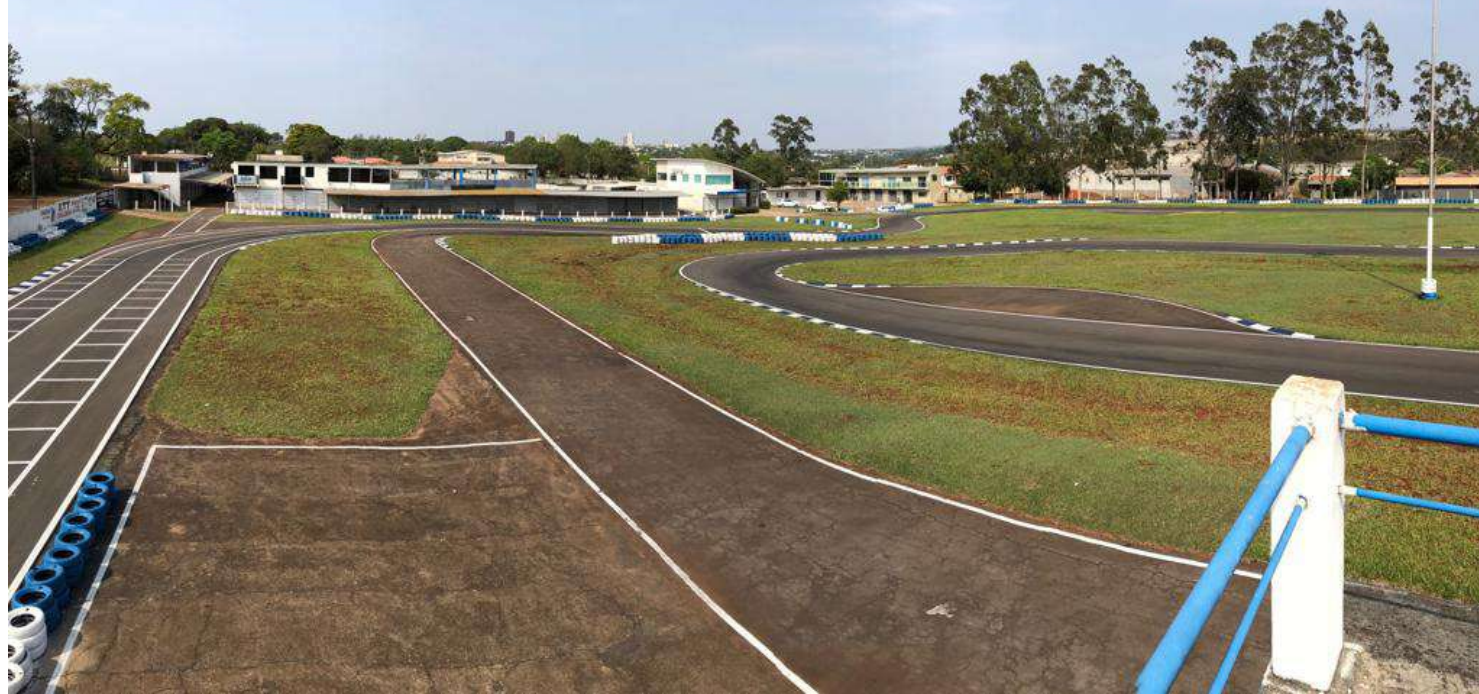
A pista do Kartódromo Municipal de Campo Mourão foi recapeada para o Paranaense de Kart deste ano