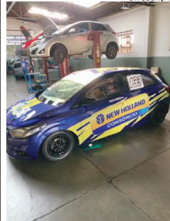
Paulo Bento estreia o Chevrolet Onix na etapa de Cascavel