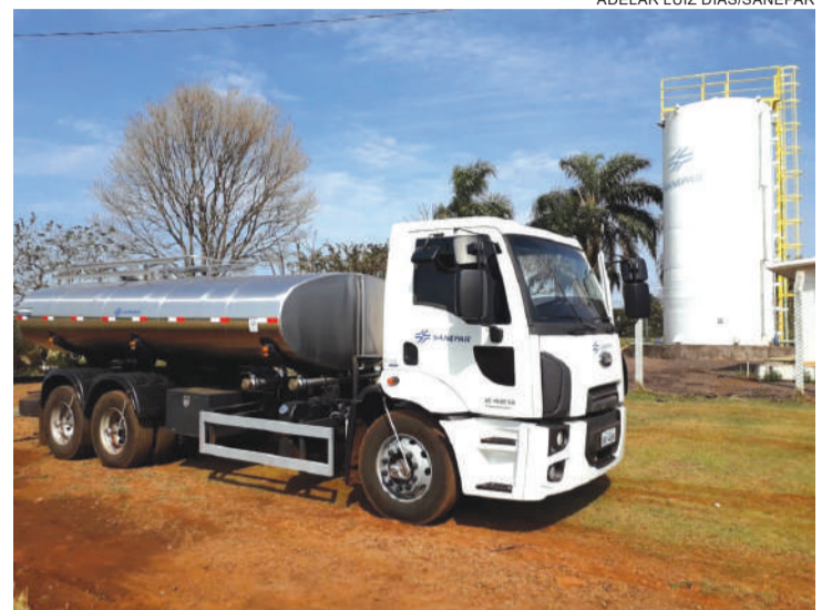
ADELAR LUIZ DIAS/SANEPAR

O Simepar reforça que pode haver regularização pluviométrica a partir de novembro, mas ainda sem confirmação se as chuvas avançam mesmo no próximo mês sobre o Paraná.