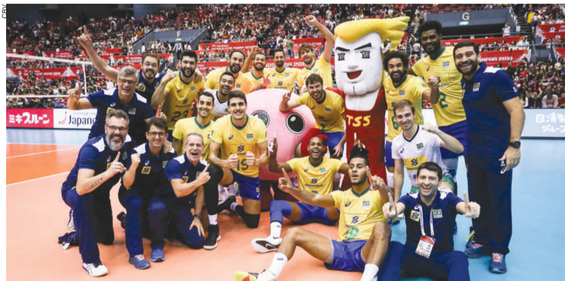
Título foi comemorado com uma rodada de antecedência

Hiroshima - O Brasil é campeão da Copa do Mundo 2019. Ontem (14), a seleção brasileira masculina de vôlei bateu o Japão, donos da casa, por 3 sets a 1 (25/17, 24/26, 25/14 e 27/25) e conquistou com uma rodada de antecedência o título da tradicional competição que ocorre de quatro em quatro anos. Em Hiroshima, o time dirigido pelo técnico Renan assegurou a décima vitória em 10 jogos disputados.