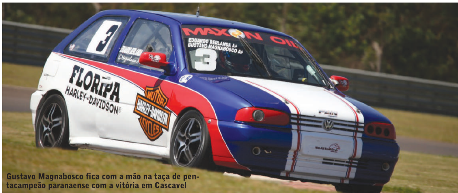
Gustavo Magnabosco fica com a mão na taça de pentacampeão paranaense com a vitória em Cascavel