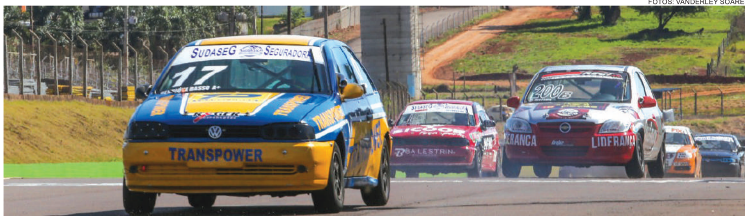
Henrique Basso venceu a categoria Turismo B ao ganhar as duas baterias da etapa de Cascavel