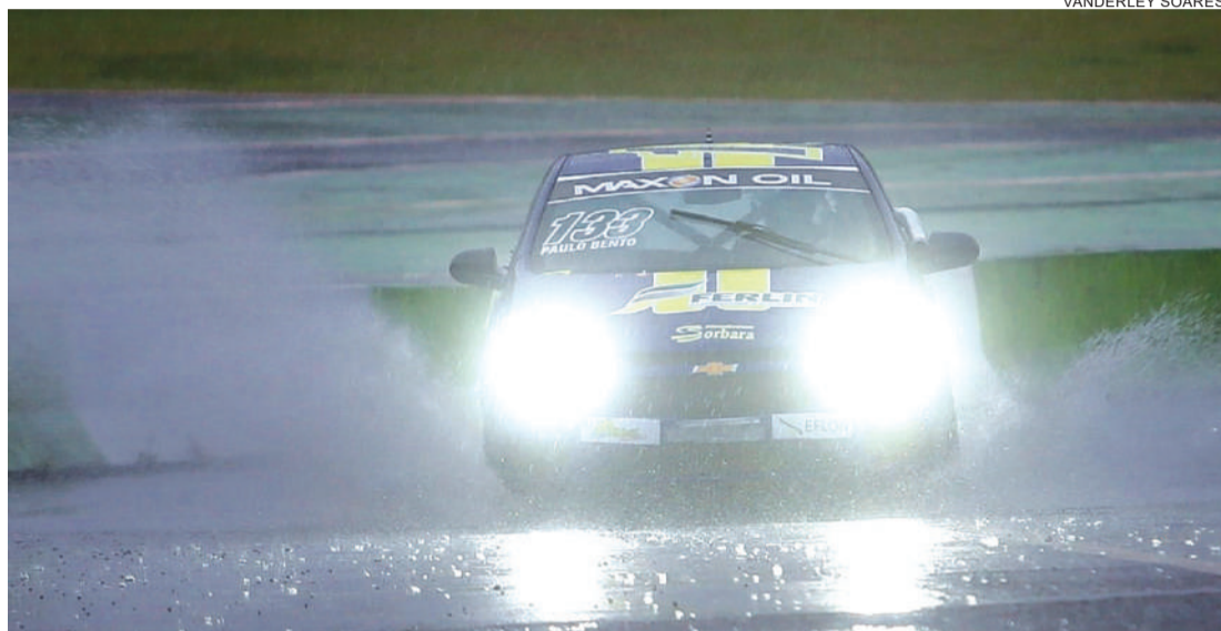
O cascavelense Paulo Bento testou várias opções de acertos do Onix para pista molhada nos treinos de ontem

Os treinos começaram ontem e a chuva mudou o rumo dos trabalhos. Com a possibilidade de chuva para domingo, fez com que os pilotos buscassem acertos para pista molhada. O site Climatempo prevê 15mm de chuva no domingo, com pancadas a qualquer momento.