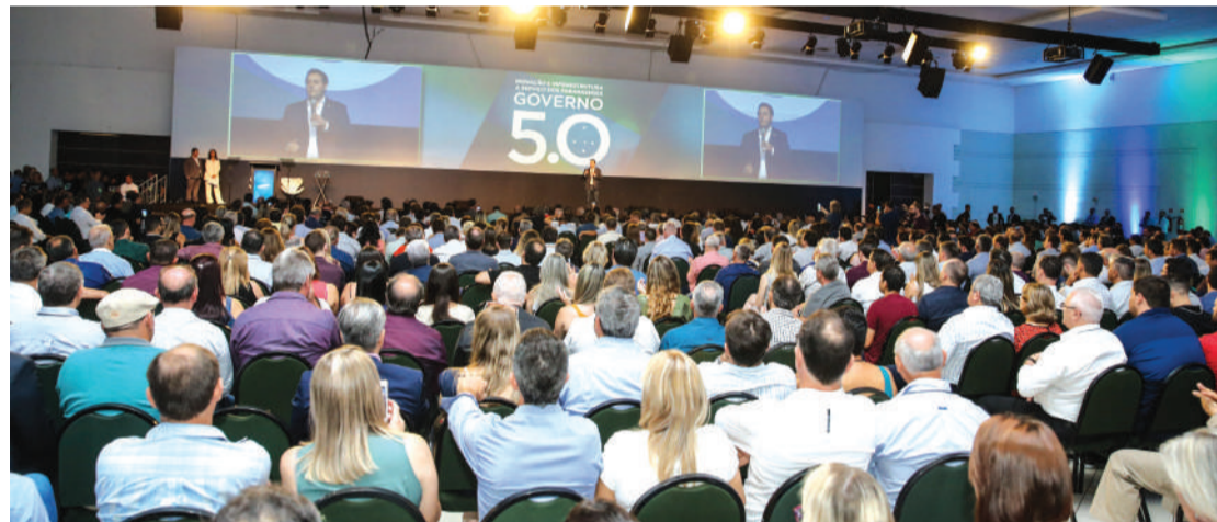
Evento reúne governador, secretários e prefeitos em Foz do Iguaçu

Ele destacou que os recursos permitiram tirar do papel ações importantes que ajudaram na modernização da máquina pública. Citou o Banco da Mulher - de crédito a juros mais baixos para empreendimentos pertencentes a mulheres - e o programa Descomplica, que facilitou e simplificou a abertura de empresas em todo o Estado.