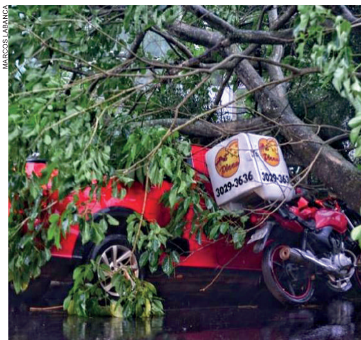
Uma árvore caiu em cima de um carro e uma moto na Rua Belarmino de Mendonça

equipes trabalhavam para restabelecer o sistema.