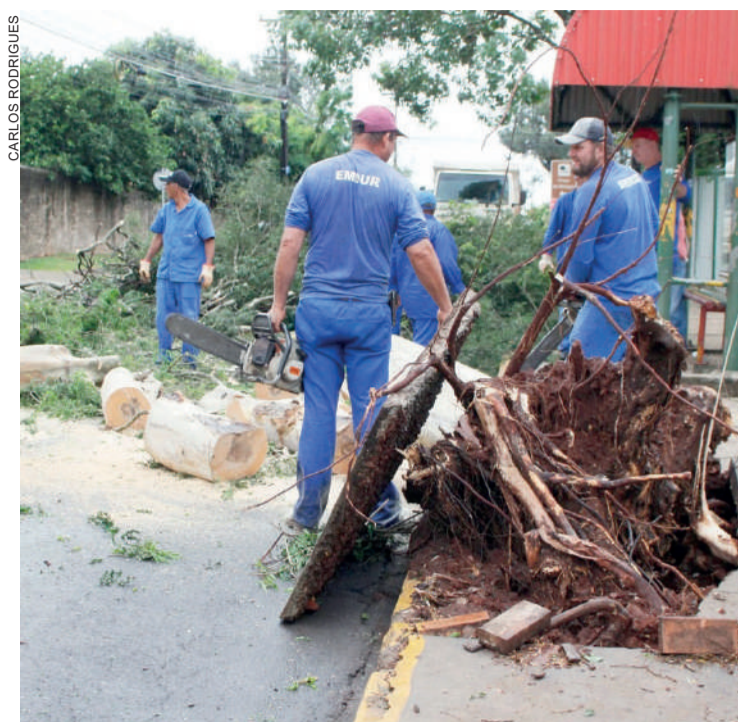
Pelo menos 28 árvores caíram em Toledo

Em Foz do Iguaçu a situação foi semelhante. As rajadas