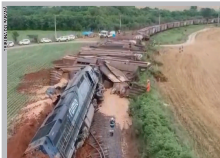
Imagem aérea impressiona pela dimensão do acidente

primeiro passo para a construção dos trechos. É ele quem vai apurar o valor da obra, para que então seja aberta a licitação para a execução física dos trilhos.