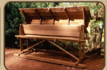
Saleiro móvel para gado de Itaúba