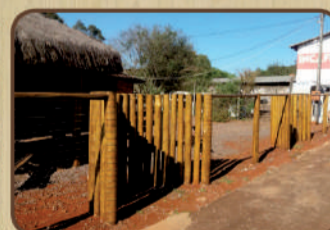
Palanques de Eucalipto Citriodoro para cerca tratado em autoclave