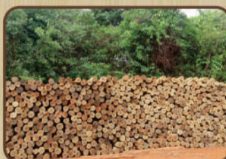
Palanque de Eucalipto Citriodoro tratado em autoclave