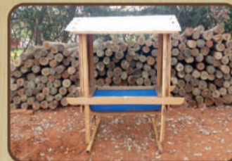
Saleiro para bezerro de Itaúba