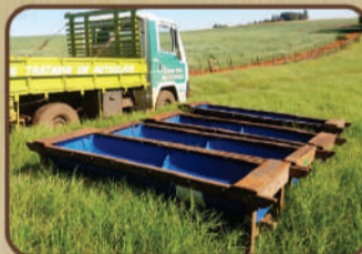
Cocho para silagem de Itaúba

EUCALIPTOS TRATADOS EM AUTOCLAVE "CITRIODORA"