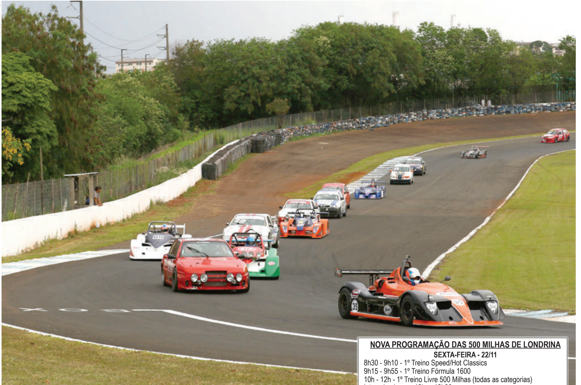
As 500 Milhas de Londrina são uma das mais importantes provas de longa duração do Brasil

A sétima e penúltima etapa da Copa HB20 será disputada neste sábado e domingo em Goiânia. Será a primeira vez que a categoria estará com a Stock Car e isso só será possível porque os bólidos da Hyundai não acompanharam a Copa Truck no Uruguai.