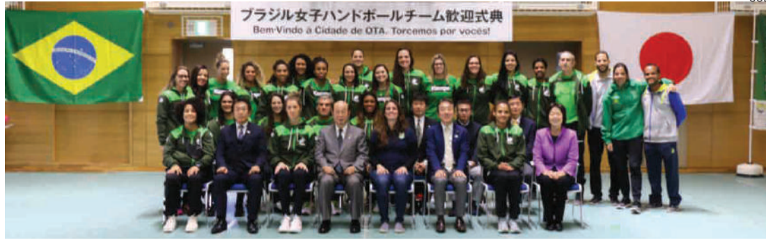
Equipe de handebol feminino disputa a Japan Cup a partir desta quinta-feira

Campeã mundial em 2013, a seleção brasileira feminina de handebol se prepara para tentar repetir o feito na competição mais importante do ano, que será disputada em Kunamoto de 30 de novembro a 15 de dezembro. Antes disso, a equipe treinará por dez dias na base de apoio do COB (Comitê Olímpico do Brasil) de Ota, uma das regiões da capital japonesa. Ontem