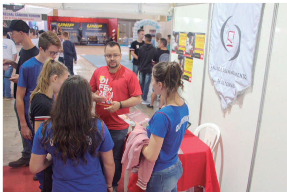
Engenheira Civil faz experimentos com estudantes para mostrar um pouco do curso

Uma grande Mostra de Profissões. Assim foi o Unipar Aberta, que abriu as portas da Universidade Paranaense para mais de 1.500 alunos de escolas estaduais de Toledo e cidades da região no dia 2 de outubro.