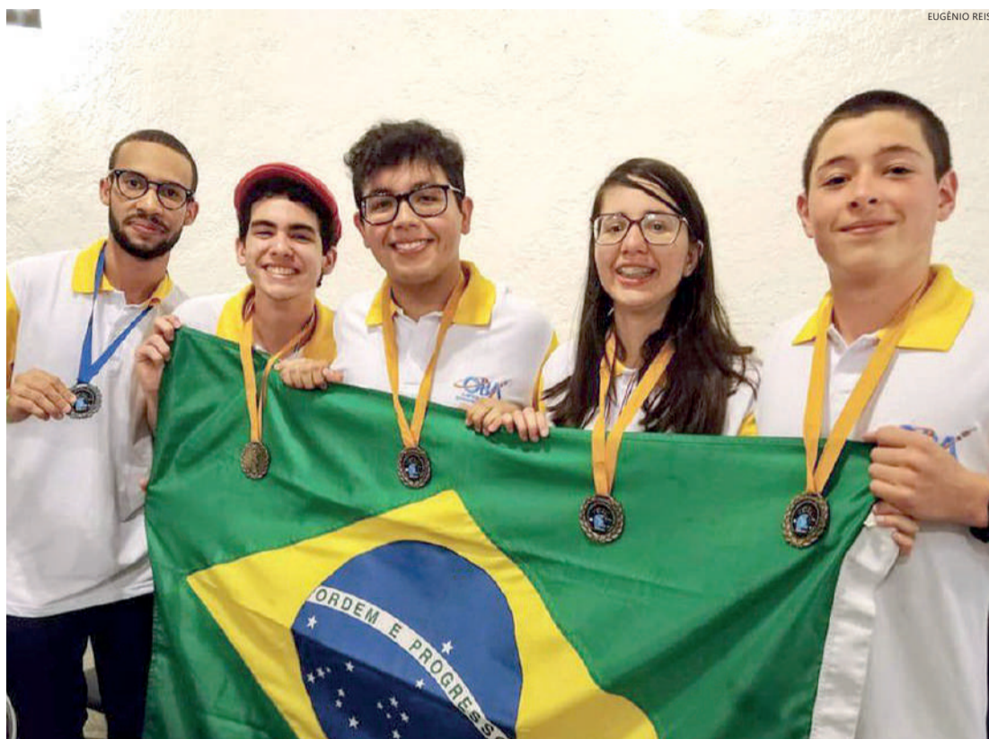
Equipe brasileira campeã

No cômputo geral, das 11 olimpíadas, o Brasil assume também a liderança com 34 medalhas de ouro, 17 de prata e quatro de bronze. “O Brasil lidera a olimpíada desde o início, com os estudantes melhor preparados. A gente é o