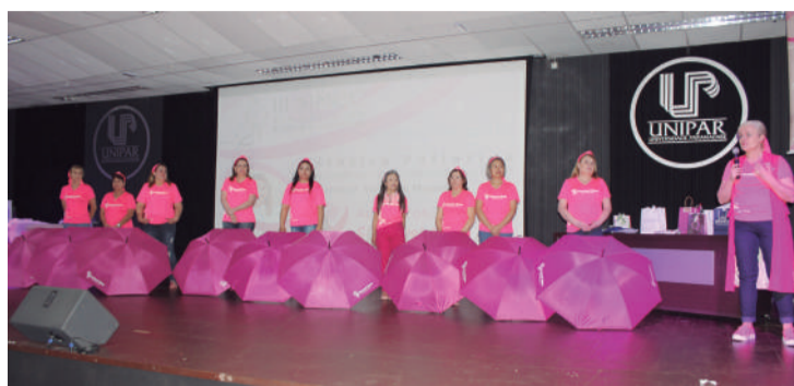
Equipe do Cascavel Rosa abriu campanha na Unipar

Os locais contemplados foram a Feira do Produtor de Cascavel, a USF (Unidade de Saúde da Família) do Bairro 14 de Novembro, o Terminal Urbano Oeste e o Escritório Cais Coworking.