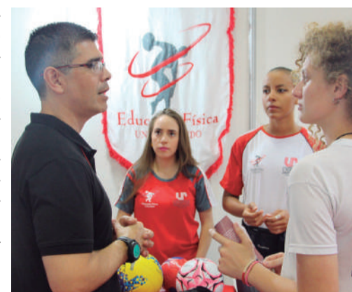
Colaboradores do Primato Supermercado

Uma das ações realizadas recentemente contemplou os funcionários dos supermercados Allmayer e Primato, de Toledo e Vera Cruz do Oeste. A Unipar foi convidada para a Sipat (Semana Interna de Prevenção de Acidentes do Trabalho) das