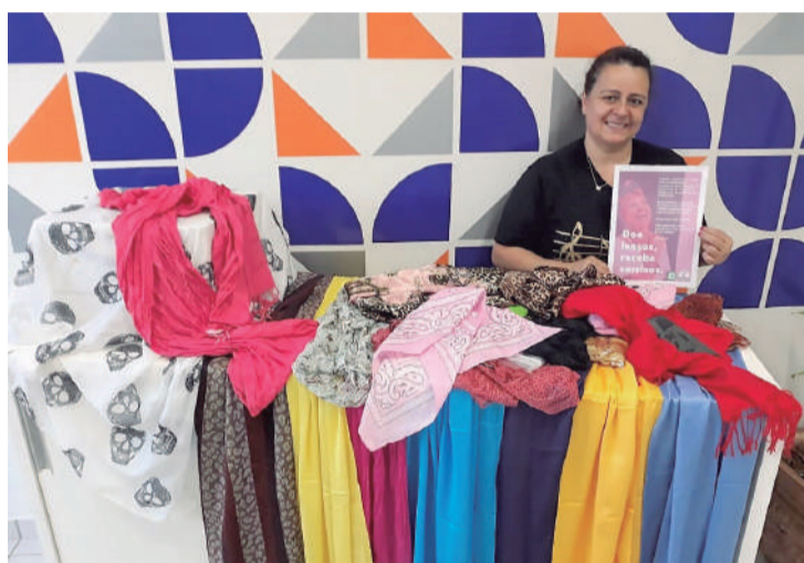
Cipa encabeça campanha 'Doe lenços, receba sorrisos'

Solidariamente, a Cipa (Comissão Interna de Prevenção de Acidentes) encabeçou, com coordenações de cursos, a campanha "Doe lenços, receba sorrisos" e, como sempre, o gesto dos acadêmicos