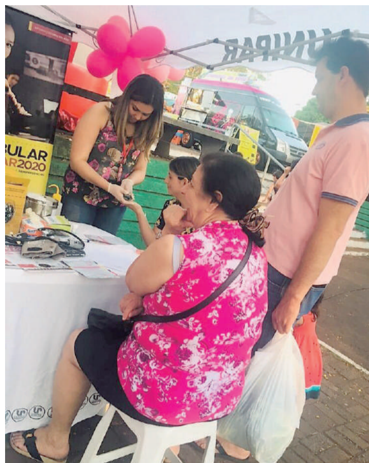
Equipe de Enfermagem faz testes rápidos de saúde no mês Rosa

Ainda dentro da instituição palestra foi realizada para as