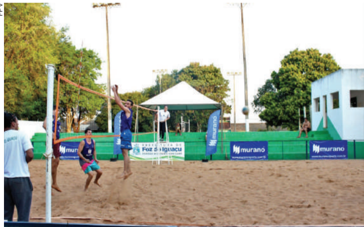
Superpraia reunirá as dez melhores duplas do Circuito 2019

Foz do Iguaçu - A cidade de Foz do Iguaçu recebe neste final de semana a grande final do Circuito Paranaense de Vôlei de Praia, o “Superpraia” com as dez melhores duplas da competição. A competição será no Complexo Esportivo Costa Cavalcanti, com entrada gratuita ao público.