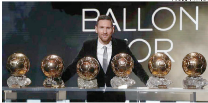
Lionel Messi é o único no mundo com seis bolas de ouro

“Eu entendo por que não vencia (nos anos anteriores)”, disse Messi. “Como equipe não alcançamos nosso grande objetivo que era conquistar a Champions League e ganhar essa competição nos dá mais chance de vencer a Bola de Ouro. Quando Cristiano estava ganhando todos os troféus, era porque ele estava realizando grandes temporadas, vencendo a Champions Lea-