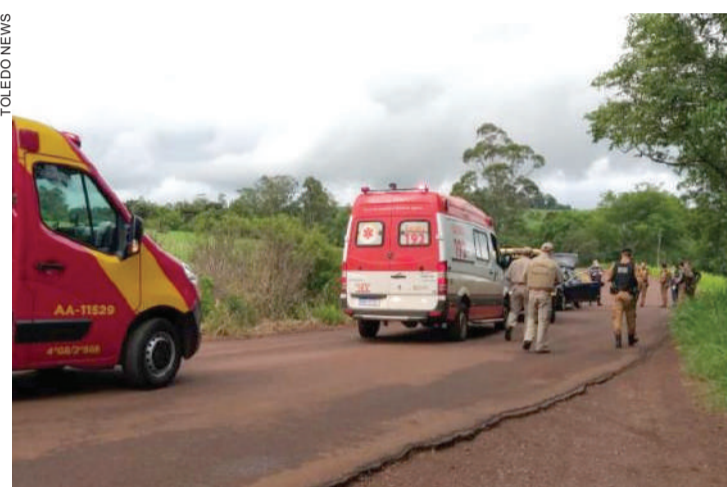
Socorristas foram acionados, mas a dupla morreu no local

Segundo a PM, o confronto aconteceu durante uma tentativa de abordagem em um local no qual possivelmente estariam dois indivíduos atuando no tráfico de drogas. Eles reagiram e a equipe revidou, culminando