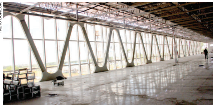
Novo terminal de passageiros deve ser entregue até março do ano que vem

À espera da nova estrutura, o aeroporto inicia novas operações a partir desta sexta-feira (13), quando começa um voo diário para Porto Alegre pela Azul. Até ontem, a passagem de ida era vendida a R$ 352 pelo site da companhia. A expectativa é de que o aeroporto tenha uma movimentação de 230 mil passageiros neste ano - já chegou a 211 mil até novembro. Ano passado, foram 149 mil passageiros.