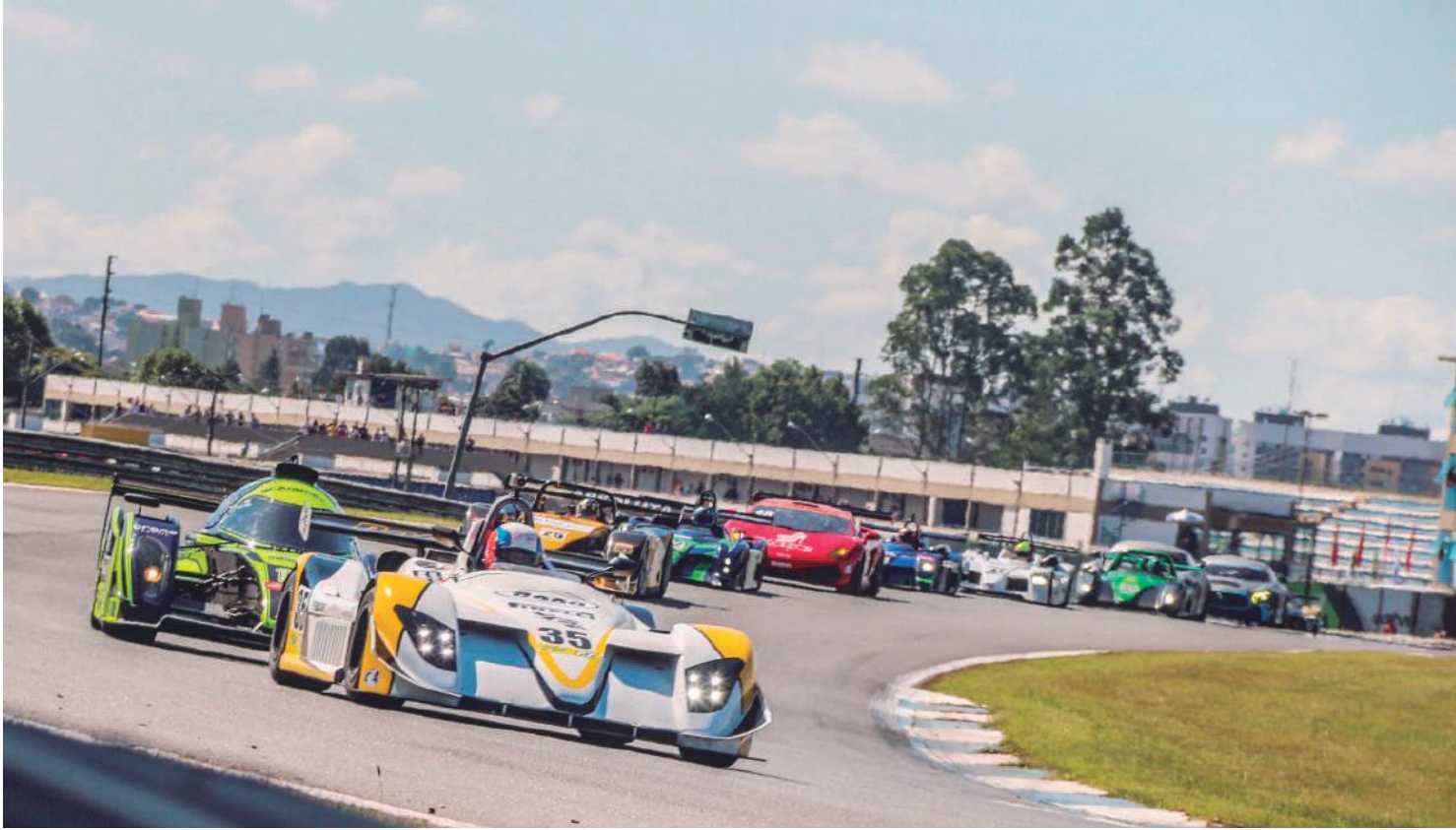
Correndo em casa, Jair e Duda Bana buscam a segunda vitória na temporada na categoria P2