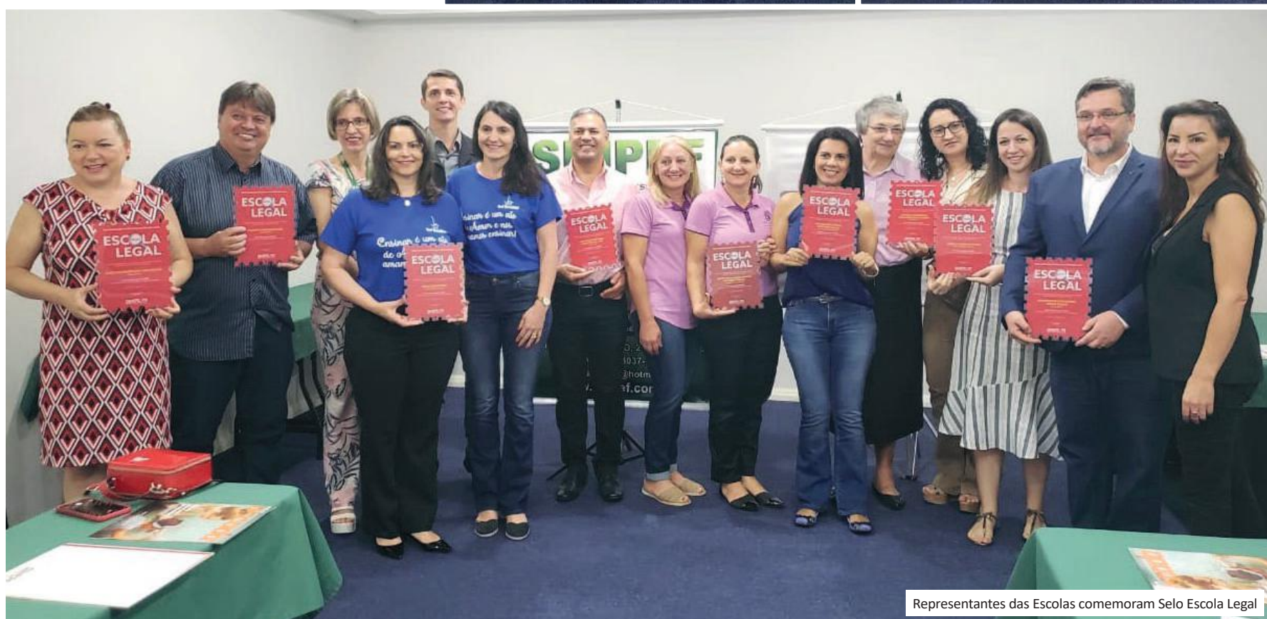
Representantes das Escolas comemoram Selo Escola Legal