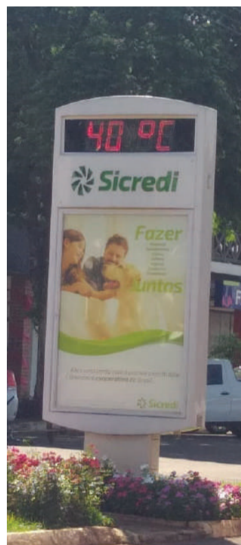
Em Missal, termômetro ontem à tarde indicava 40°C