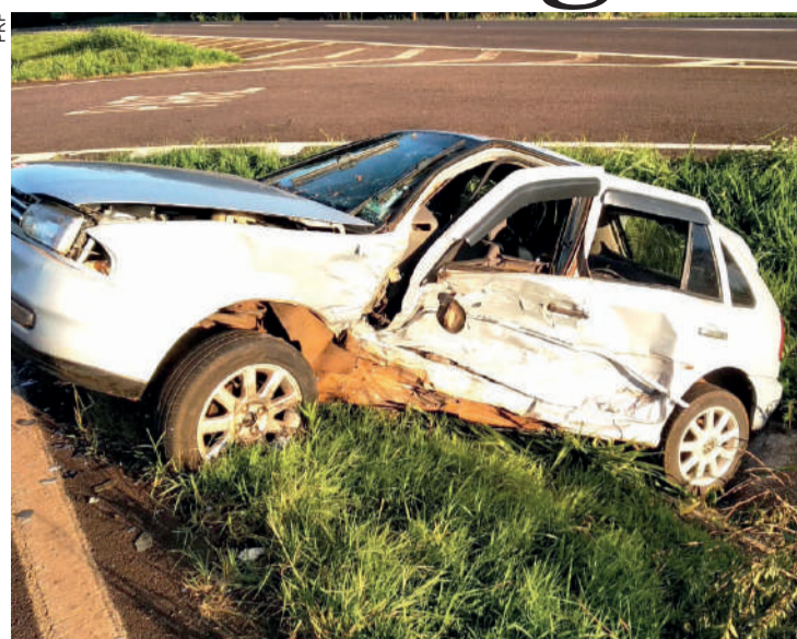
A quinta morte registrada pela PRF aconteceu no dia de Natal, na BR-467, entre Toledo e Cascavel

Nas rodovias estaduais, a PRE (Polícia Rodoviária Estadual) registrou três mortes nesse último feriado. Ano passado não houve vítimas fatais. O número de acidentes atendidos diminuiu de 14 para 13 este ano.